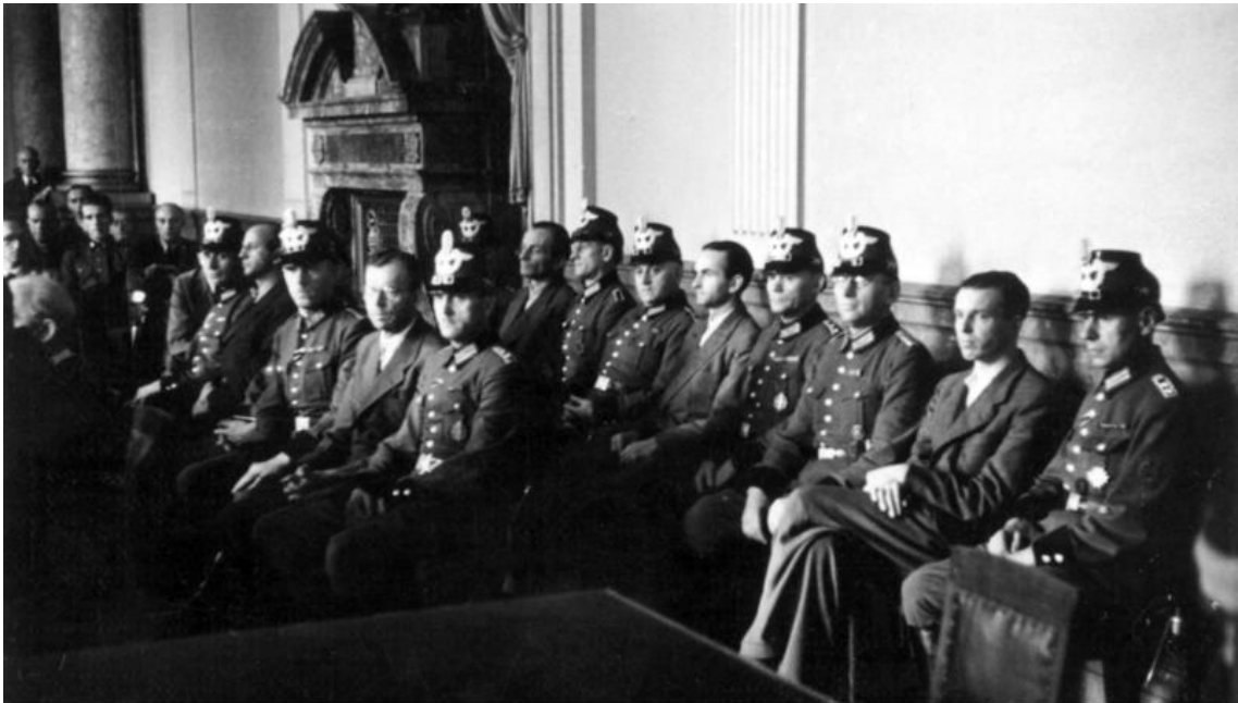
10. August 1944