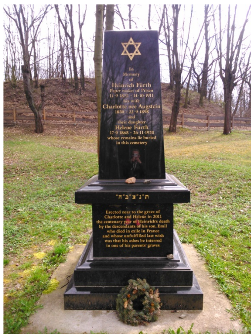
10.2. Pamětní deska na židovském hřbitově na Lochotíně. [2016-4-6].