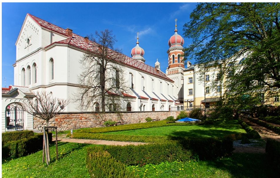
10.6. Velká synagoga – pohled ze zahrady.