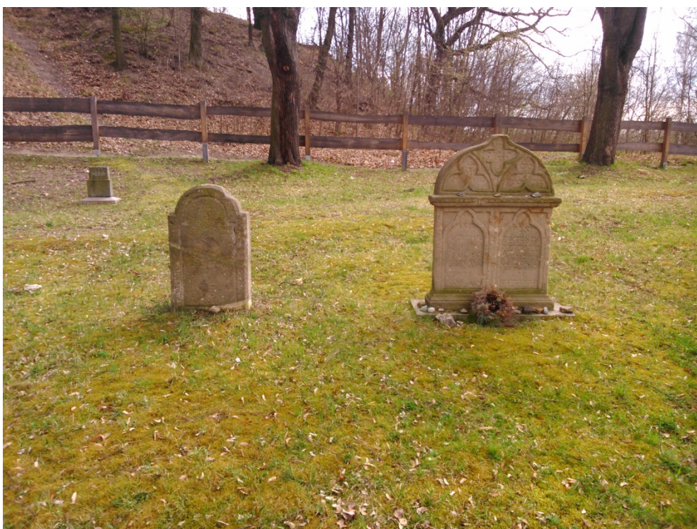
10.4. Zachovalé náhrobky na židovském hřbitově na Lochotíně. [2016-4-6].