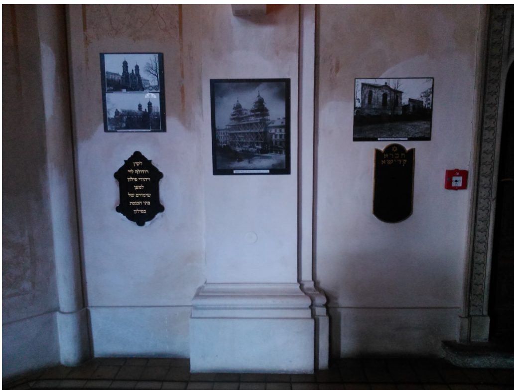
10.10. Kasičky židovských spolků umístěné v předsíni Velké synagogy.