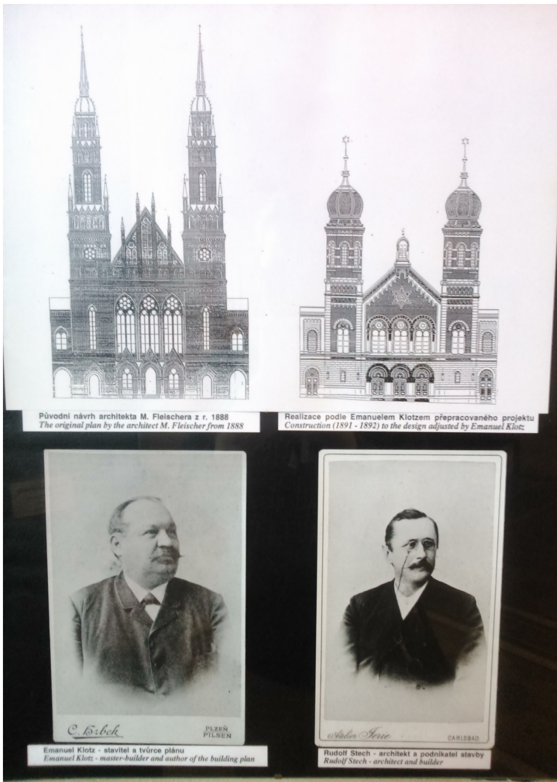
10.11. Původní a realizovaný návrh Velké synagogy umístěné v předsíni synagogy. [2016-4-6].