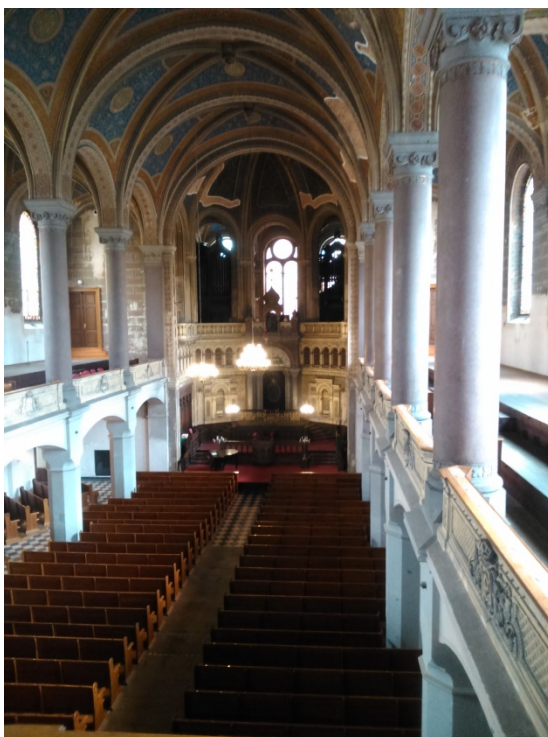
10.8. Vnitřní pohled ve Velké synagoze v Plzni.