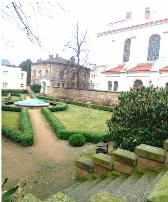
10.13. Rabínský dům za Velkou synagogou. [2016-4-6].