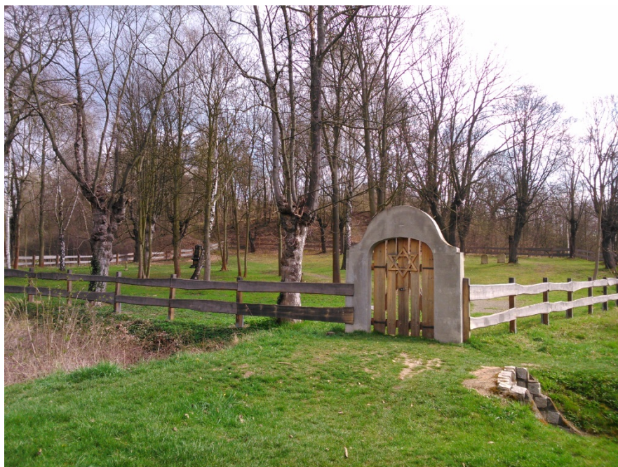
10.1. Pozůstatky židovského hřbitova na Lochotíně. [2016-4-6].