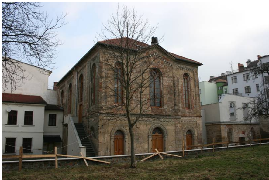
10.13. Stará synagoga v Plzni před rekonstrukcí.