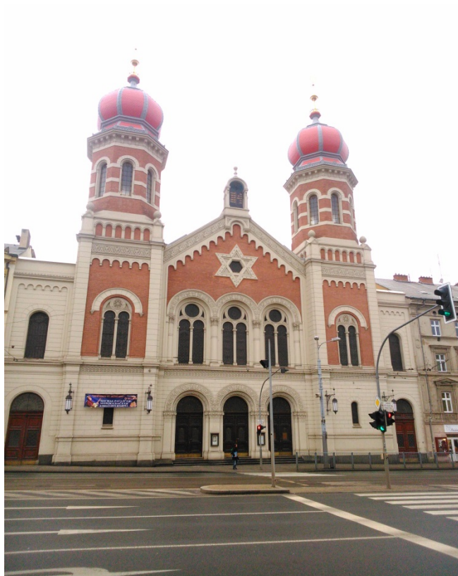
10.5. Velká synagoga v Plzni. [2016-1-30].