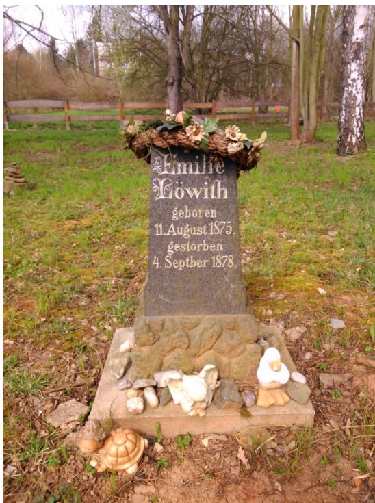
10.3. Zachovalý náhrobek na židovském hřbitově na Lochotíně. [2016-4-6].