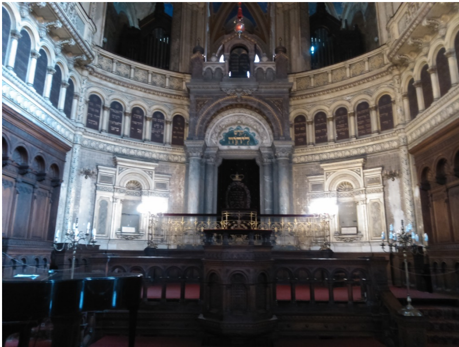
10.7. Svatostánek ve Velké synagoze v Plzni.