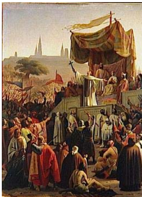
Opat Bernard z Clairvaux vyzývá k zahájení druhé křížové výpravy