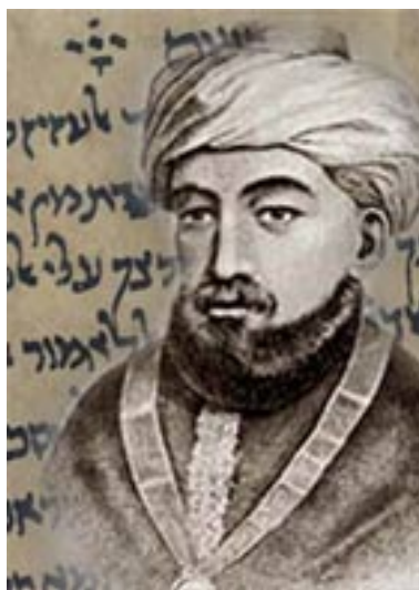
Moše ben Maimona (Maimonides)