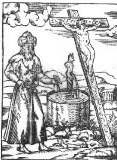
Žid tráví křesťanskou studnu