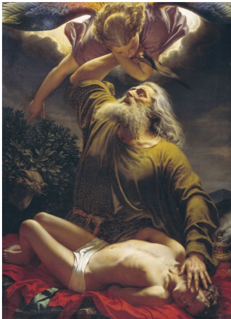
Abrahám obětující Izáka