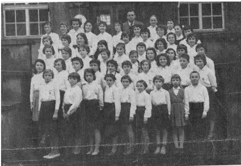
OBRÁZEK Č. 3. DĚTSKÝ SBOR PLZEŇSKÉHO ORCHESTRÁLNÍHO SDRUŽENÍ