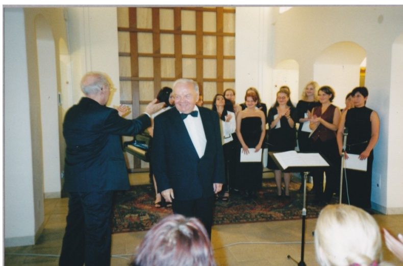
OBRÁZEK Č. 10. KONCERT K 40. VÝROČÍ ZALOŽENÍ PLZEŇSKÉ KONZERVATOŘE ZA ÚČASTI P. EBENA