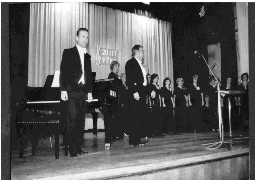
OBRÁZEK Č. 7. KONCERT K 20. VÝROČÍ ZALOŽENÍ PLZEŇSKÉHO ŽENSKÉHO KOMORNÍHO SBORU