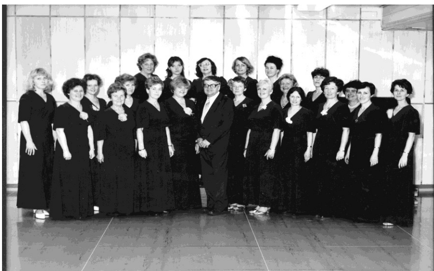
OBRÁZEK Č. 8. PLZEŇSKÝ ŽENSKÝ KOMORNÍ SBOR - 25 LET