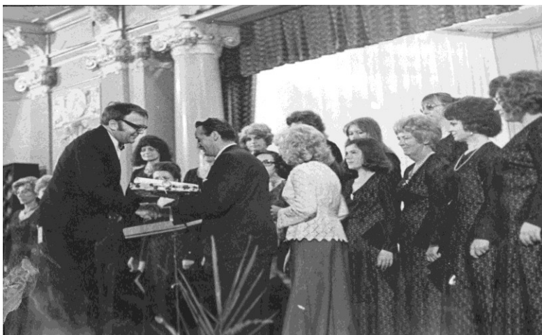
OBRÁZEK Č 5. V. ROČNÍK FESTIVALU PĚVECKÝCH SBORŮ - 1975

Dopis skladatele Iši Krejčího Ona-10.T-65 Milý Kollego, referoval mi Kollega Šum, jak to bylo v Olšavi herské a jak vyborně jste sevcil jak mi madrigaly tak i jeho sborečky. Děkuji Vám za všude a prvními Váš, aby to mi' dělá vám b.h. v'č'ntu'jal'm ve jmeim m'ím vy'ndi'l. Těz mne mile do'ymalo, je jst