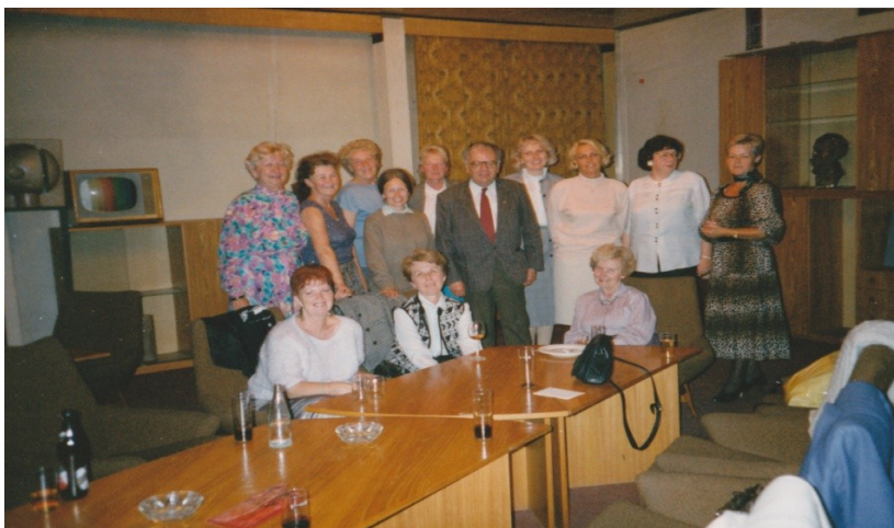
OBRÁZEK Č. 9. ZÁVĚREČNÉ POSEZENÍ - PŽKS -1993