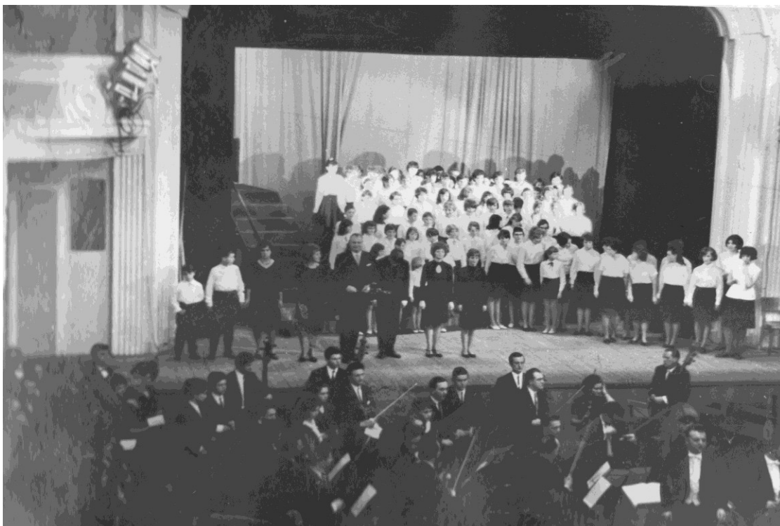
OBRÁZEK Č. 4. PREMIÉRA KANTÁTY „POTOPA“ B. BRITTENA -1966 – KULTURNÍ DŮM PEKLO