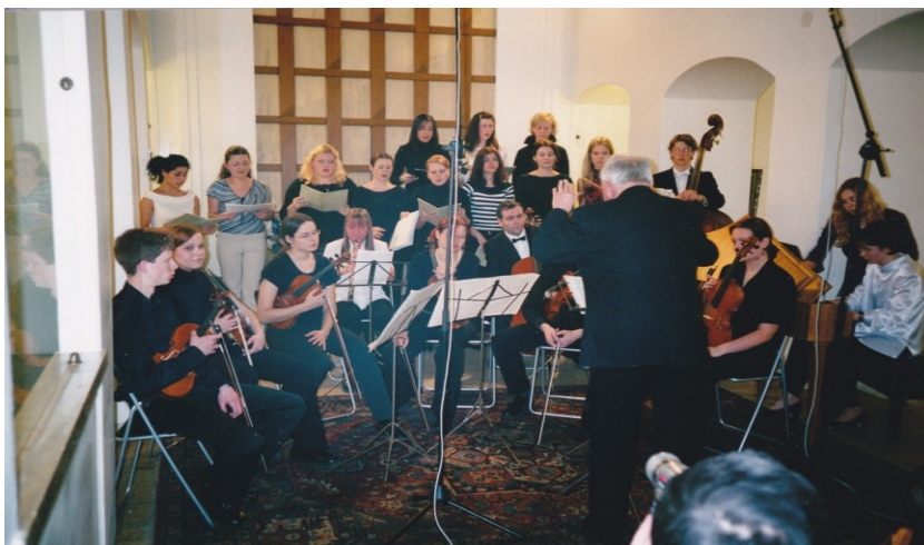
OBRÁZEK Č. 11 – MASNÉ KRÁMY – KONCERT KONZERVATOŘE – ÓDA K NAROZENINÁM KRÁLOVNY MARY 1694