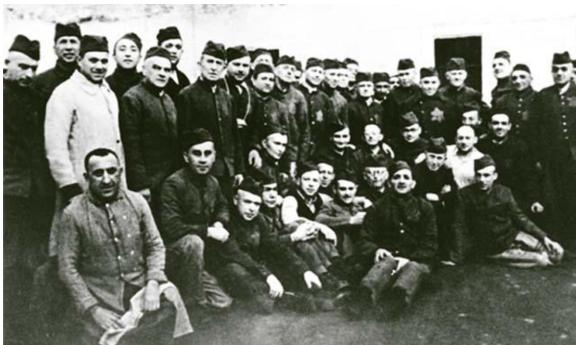
Příloha č. 4: Plzeňští Židé v Malé pevnosti v Terezíně