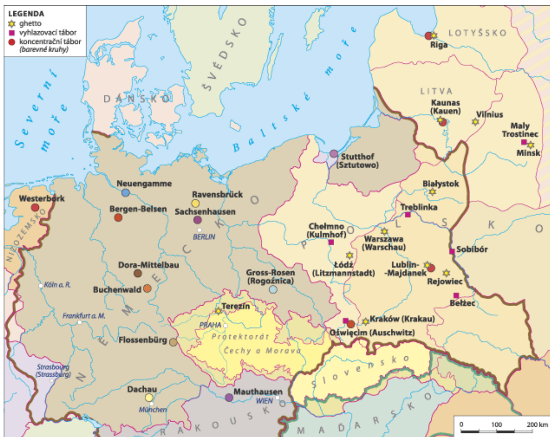
Příloha č. 3: Mapa umístění koncentračních táborů