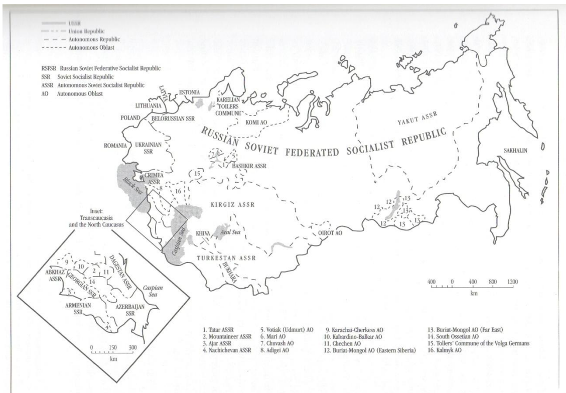
Obrázek č. 3 Mapa federální struktury SSSR, v prosinci roku 1922.