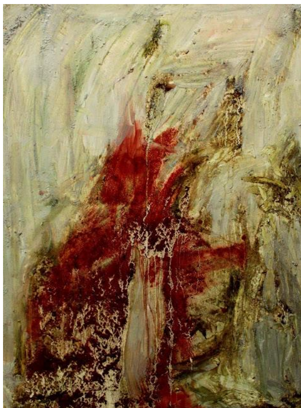
Príloha 9 Vlastná maľba