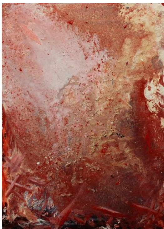
Príloha 11 Vlastná maľba