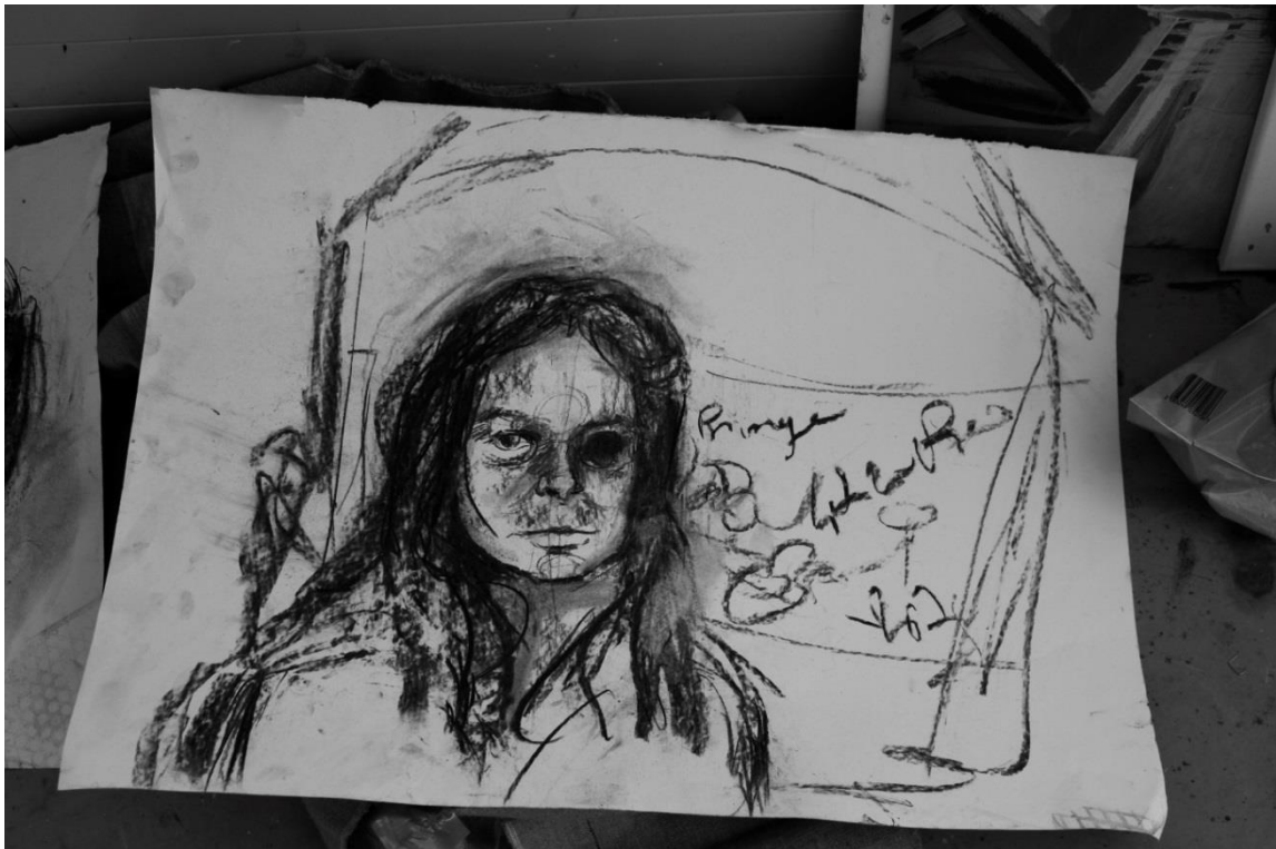
Príloha 15 Vlastná kresba, –skica