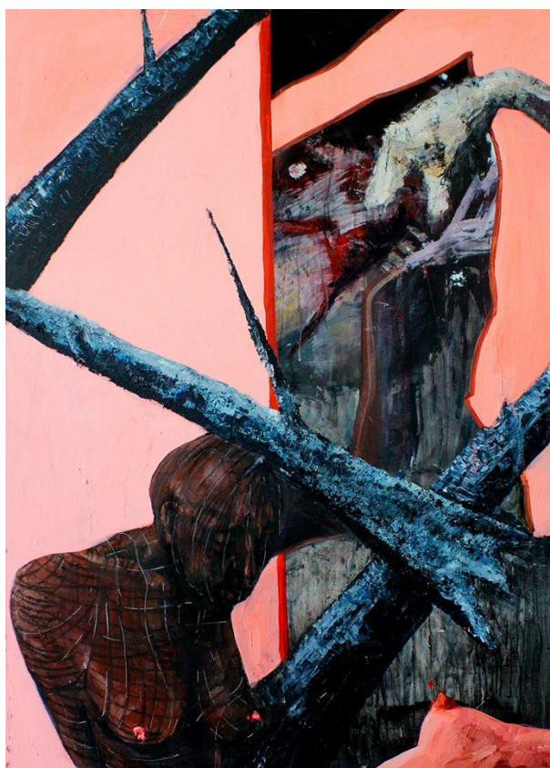
Príloha 2 Vlastná maľba- Osoby oslobodené z okov pohlavia 1