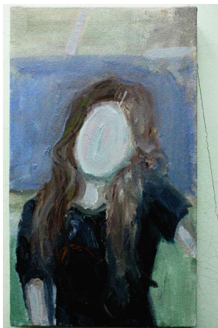
Príloha 12 Vlastná maľba - skica