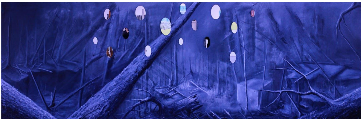
Príloha 1 Vlastná maľba- Infiltrácia