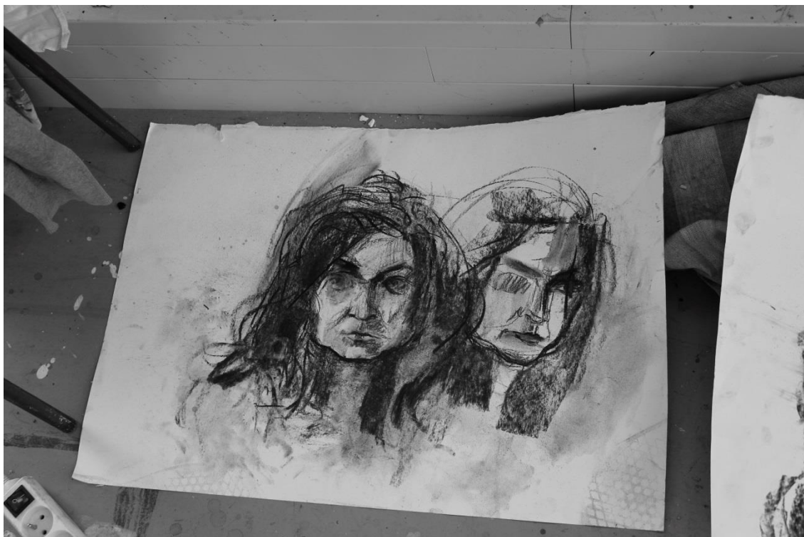
Príloha 16 Vlastná kresba, –skica