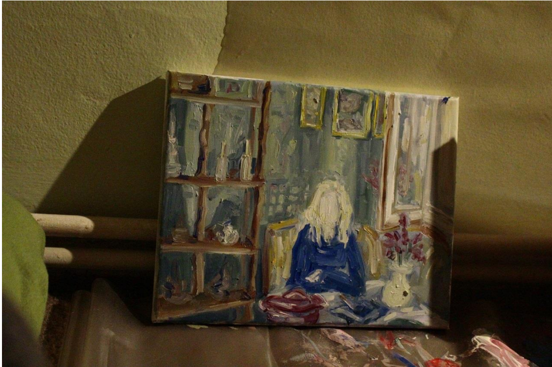
Príloha 13 Vlastná maľba- skica