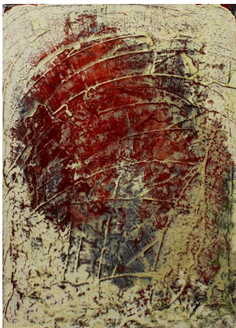
Príloha 10 Vlastná maľba