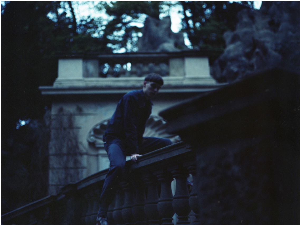
Příloha 2 - Přechod