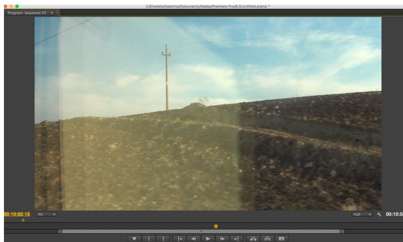
Příloha 5 - Obráz z videozáznamu, Cesta