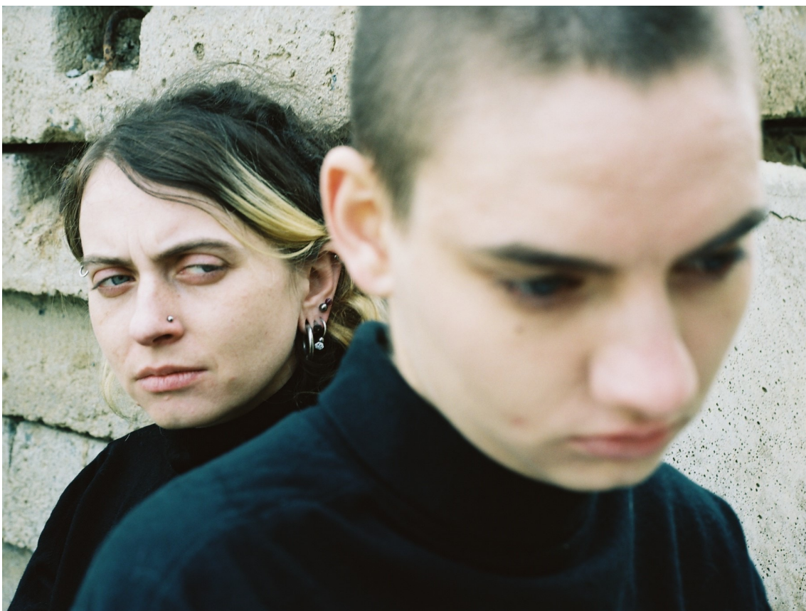
Příloha 4 - Romulus a Remus