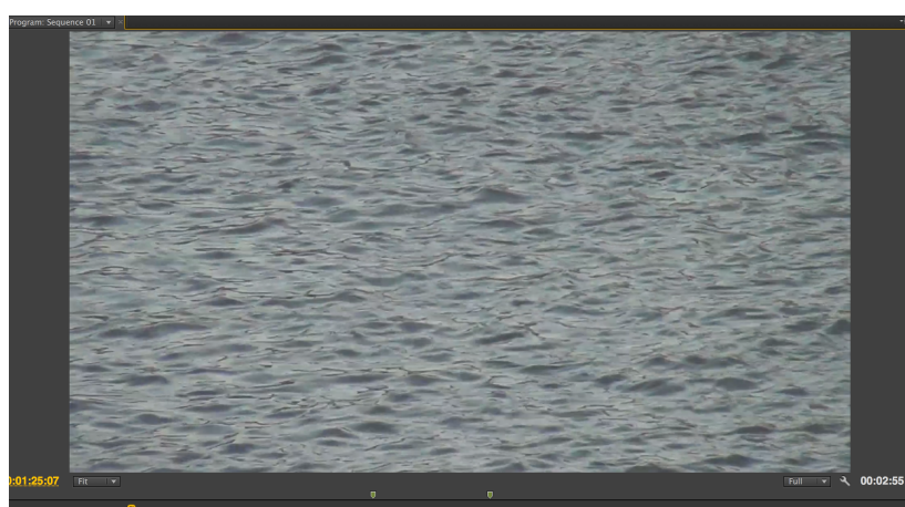
Příloha 6 - Obráz z videozáznamu, Příroda