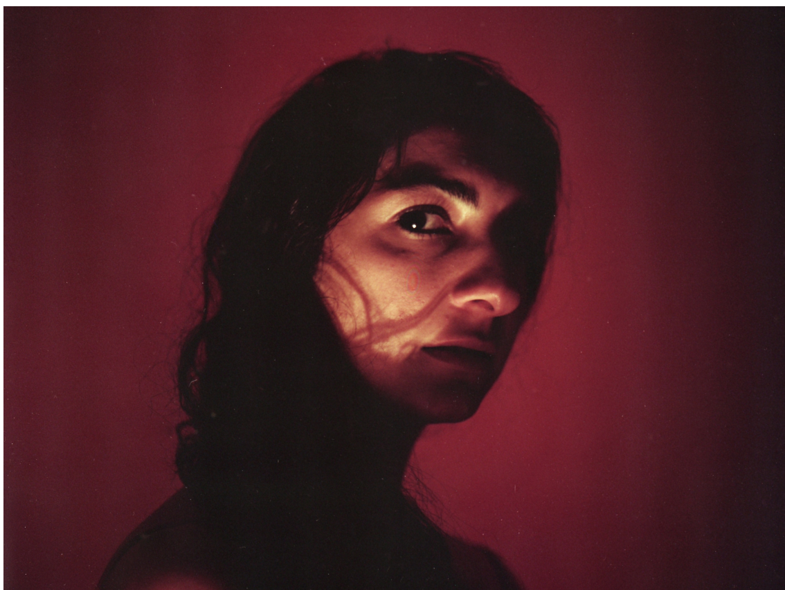
Příloha 1 - Tma