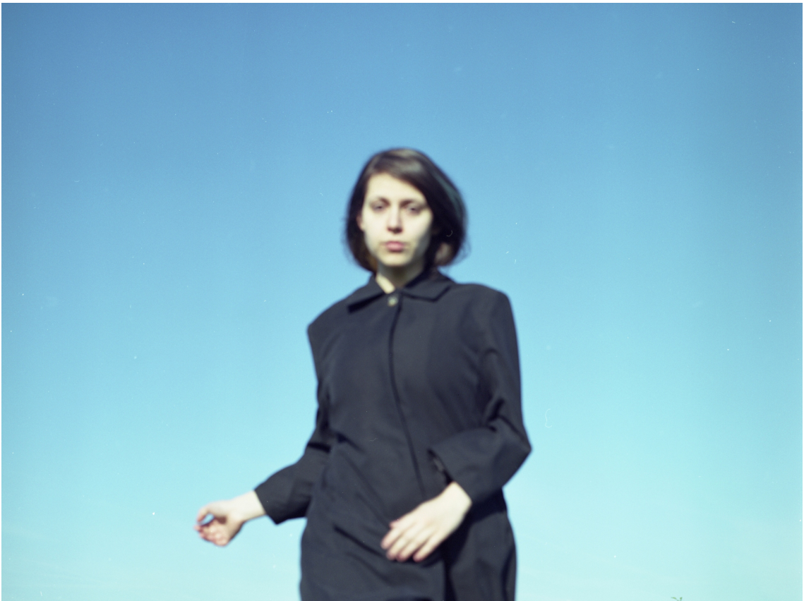
Příloha 3 - Světlo