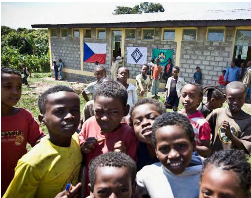
Etiopie 2010

Přístup ke vzdělání je v Etiopii stále vážným problémem. V roce 2010 zde Člověk v tísni dostavěl svou dvanáctou školu.