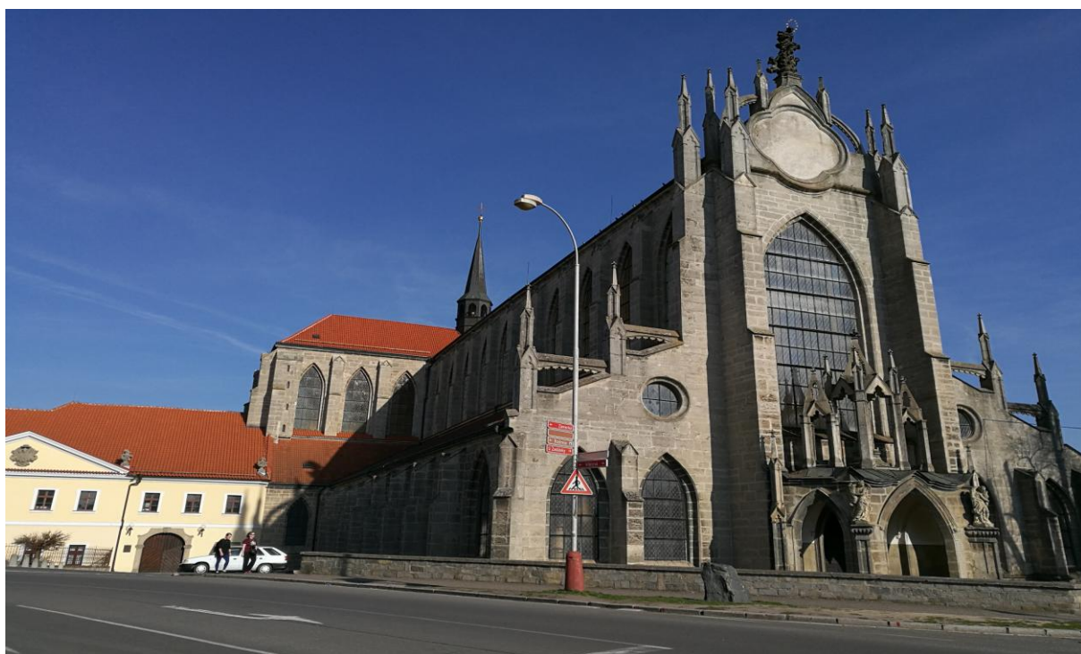
Obr. 5. Sedlecká katedrála.