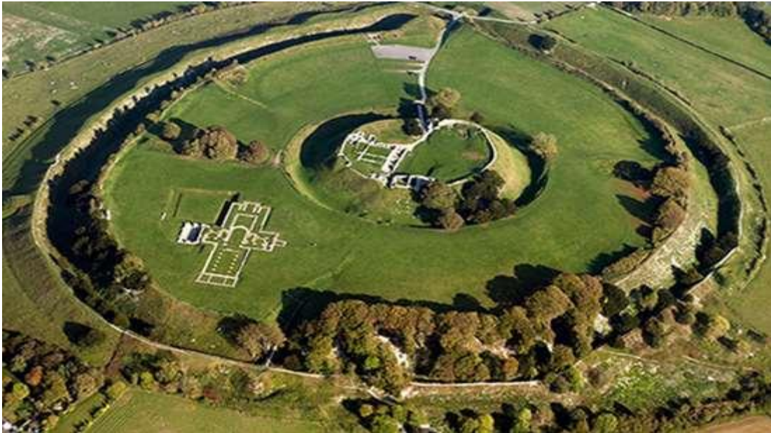
Obr. 1. Old Sarum.