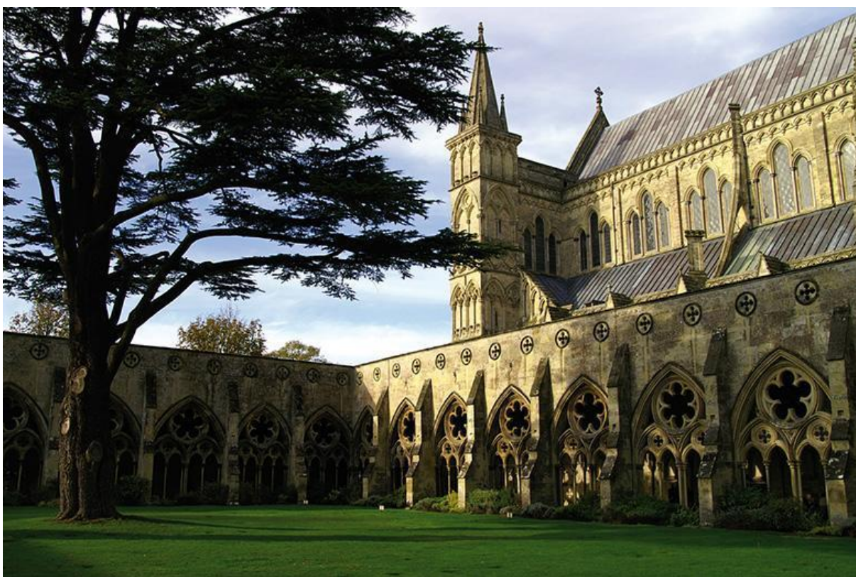
Obr. 3. Křížová chodba.