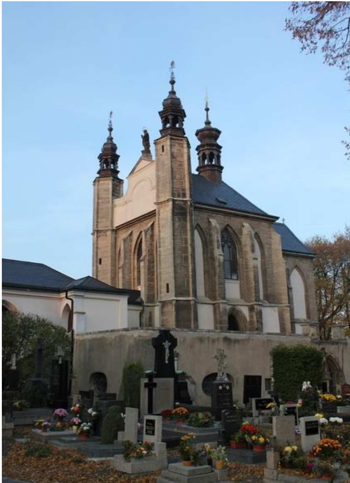
Obr. 8. Kostnice.