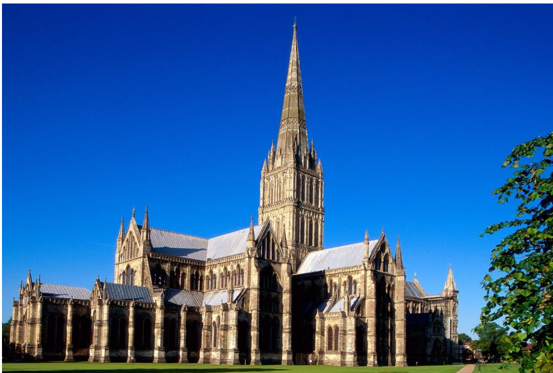
Obr. 2. Katedrála v Salisbury.