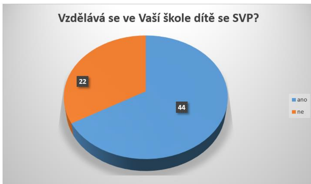
Graf 1: Vzdělávání dětí se SVP v běžných mateřských školách v Plzeňském kraji

Z grafu vyplývá, že celkem 44 mateřských škol vzdělává dítě se speciálními vzdělávacími potřebami. Dalších 22 škol odpovědělo, že dítě se speciálními vzdělávacími potřebami nevzdělává a dotazník pro tyto školy skončil. Následující grafy tedy vychází z odpovědí čtyřiceti čtyř mateřských škol.