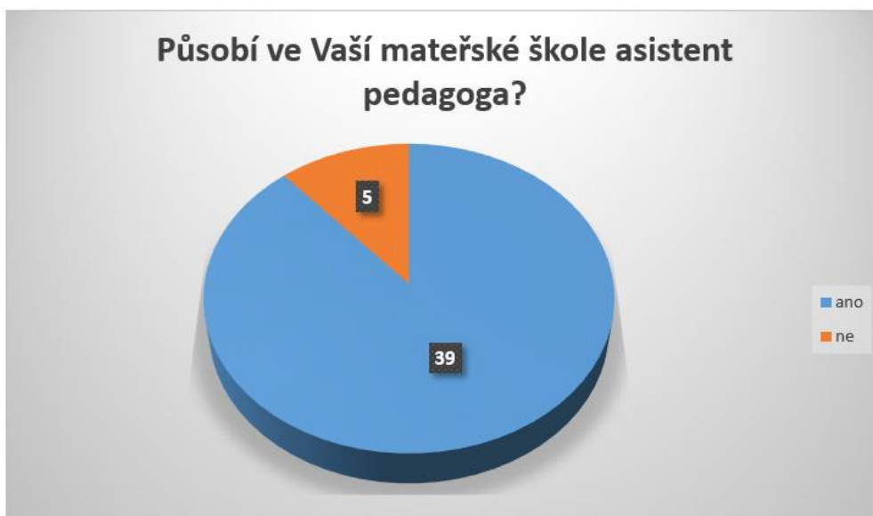
Graf 4: Působnost asistentů pedagoga v mateřských školách v Plzeňském kraji.

Ze statistiky vyplývá, že pět běžných škol v Plzeňském kraji vzdělává děti se SVP bez podpory asistenta pedagoga. Převážná část mateřských škol (39) využívá jako podpůrné opatření dalšího pedagogického pracovníka k dětem se SVP, které se v jejich škole vzdělávají.