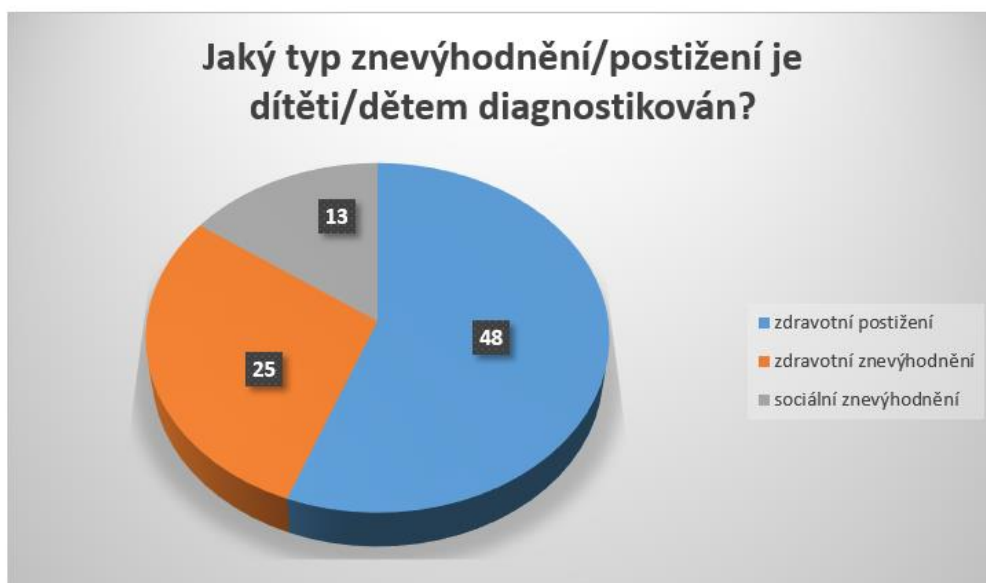
Graf 3: Nejčastější diagnóza dětí se SPV, které se vzdělávají v běžných mateřských školách v Plzeňském kraji.

Nejčastěji se jedná o děti se zdravotním postižením (48), poté se zdravotním znevýhodněním (25) a sociálním znevýhodněním (13).