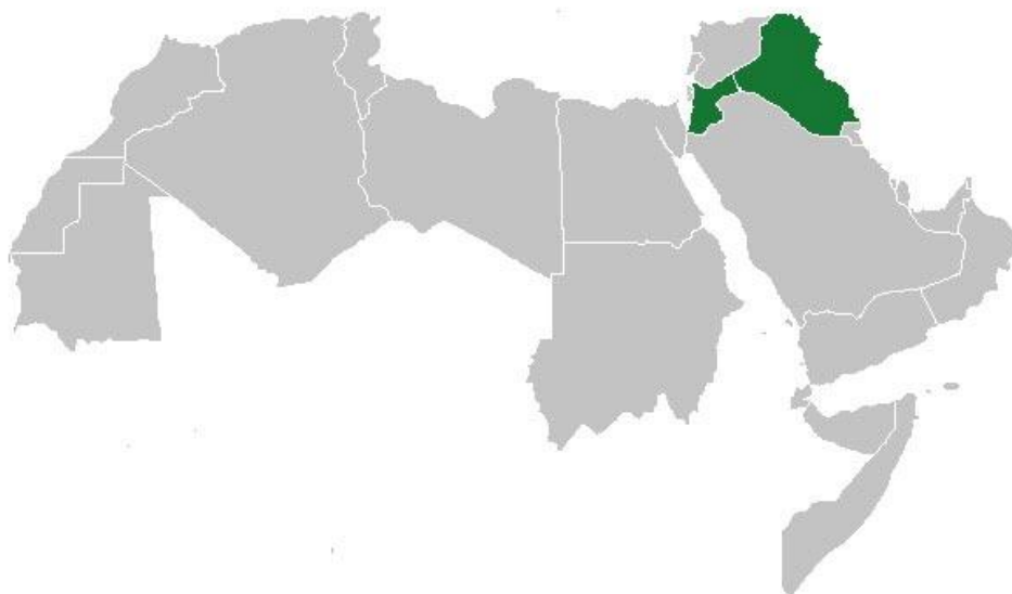
Příloha č. 2: Arabská federace