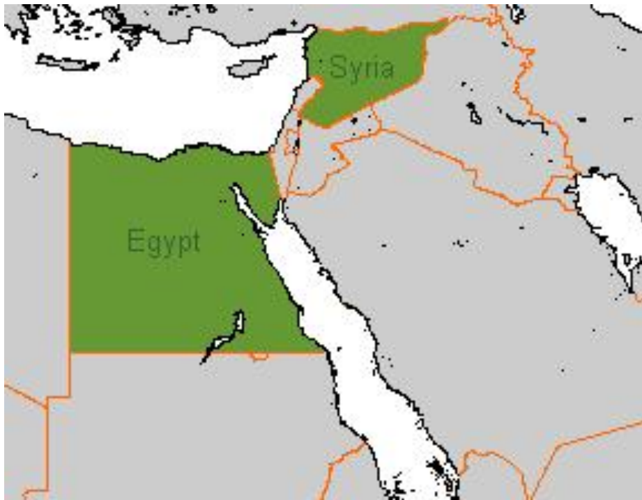
Příloha č. 1: Sjednocená arabská republika