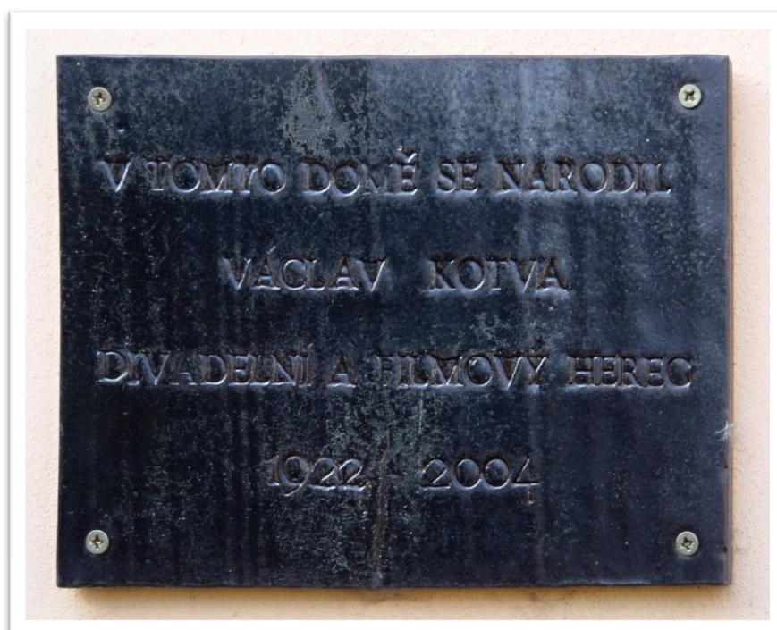
Obrázek 5 - Pamětní deska