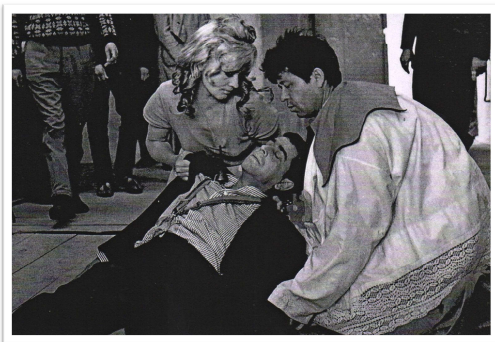
Obrázek 3 - Farářův konec

Hlavní postavu si zahrál také v roli Lájoška Cína, ševcovského tovaryše, ve filmu Svatej z Krejcárku (1969) režiséra Tučka: „To je dodnes nedoceněný film, baladicky laděné nadčasové podobenství o dobru a zlu. Cína je ševcovský tovaryš, který má rád kočky a lidi, ale všichni s ním jednají jako s onucí. „Objeví“ ho čtyři kumpáni – ti mají s jistou pochybnou dámou pět dětí, a tak dobráka Lájoška „udělají“ jejich opatrovatelem. On má onu dámu velmi rád, přestože ho podvádí, a celý příběh dopadne smutně.“ (2)