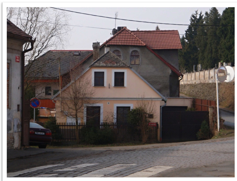
Obrázek 4 - Rodný dům