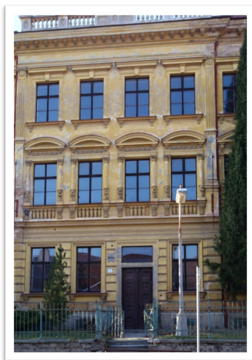
Obrázek 2 - Škola

k silnici, tak to si dáte dva, tři stromy do podpaží. A já jsem doslal zabrat, ale ten les byl pro mě odrazovým můstkem k tomu, abych se mohl vracet každý večer domů a mohl hrát divadlo. Já byl na jevišti vlastně každý večer a vedle toho mi zbyl ještě čas, abych doučoval radnické děti.“ (5) „Když byla pauzička, přišel hajný a do mokrého písku v cestě ryl špičkou své hole postupy sovětských a spojeneckých armád, kde už jsou a kde budou za týden. Poslouchal totiž v hájovně vysílání anglického rozhlasu. Tenkrát jsem si do lesa nosil Nový zákon a Breviář moderního člověka, což byly citáty moudrých lidí, a v tom jsem si mudroval. Jestli na mně bylo něco dobrého, tak jsem to pochytil právě v tom lese, v samotě nad knihami.“ (2)