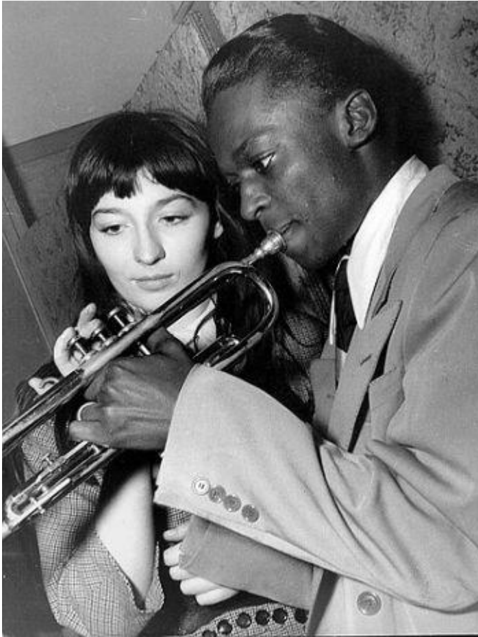
63 Miles Davis et Juliette Gréco