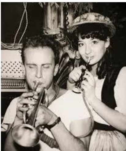
64 Boris Vian et Juliette Gréco