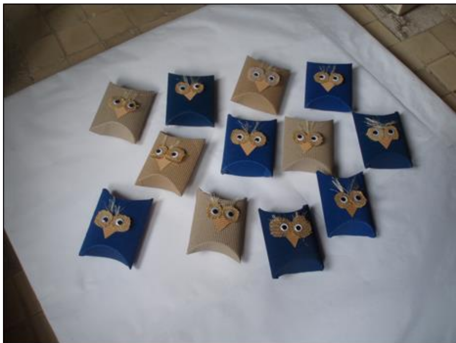
Dárkové krabičky s podobou sovy