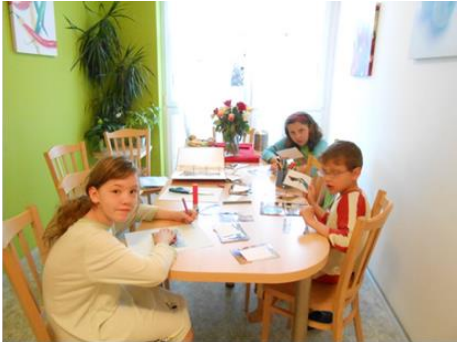
Rodinka (viz foto č. 1)