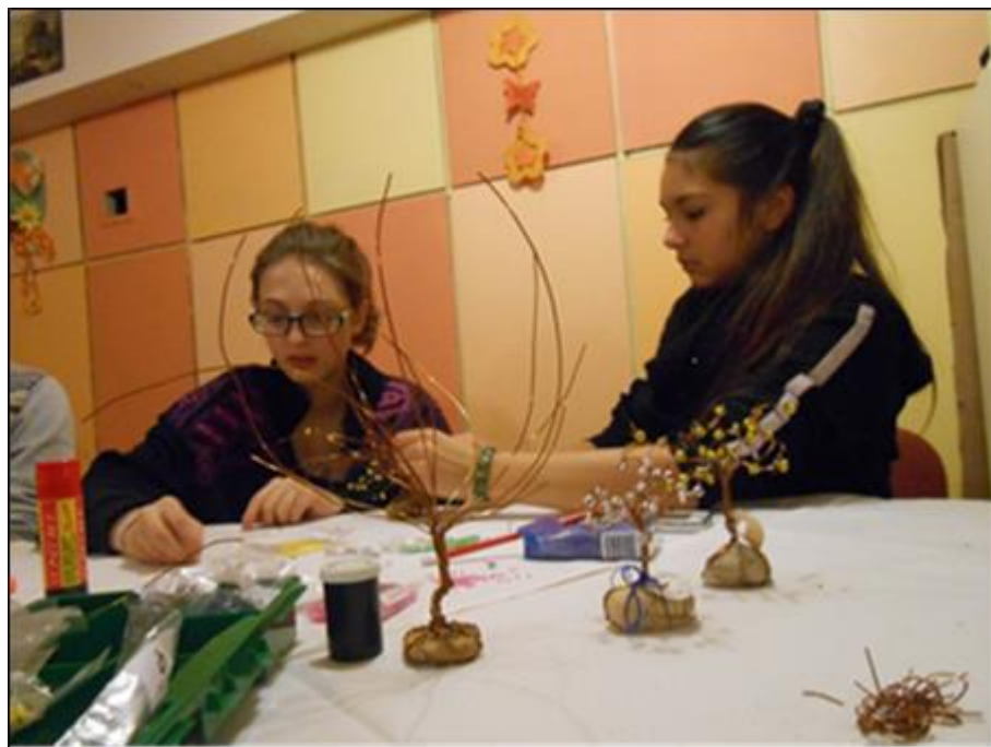
Strom z drátů (viz příloha č. 6)