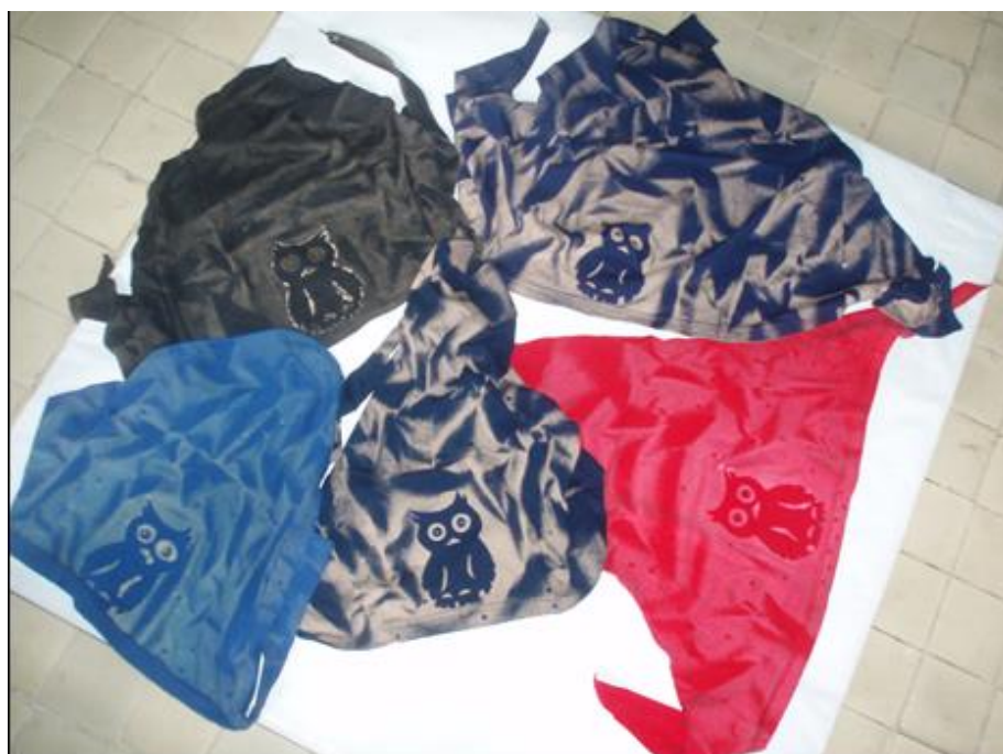
Šátek s motivem sovy (viz příloha č. 3)