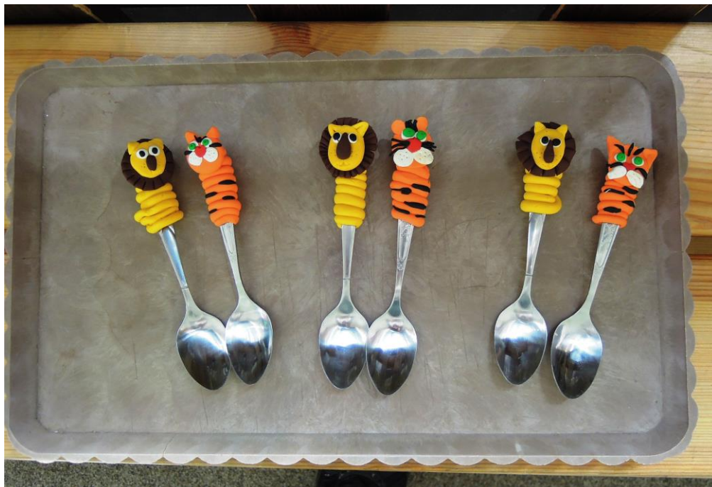
Fimo – lžička (viz příloha č. 4)