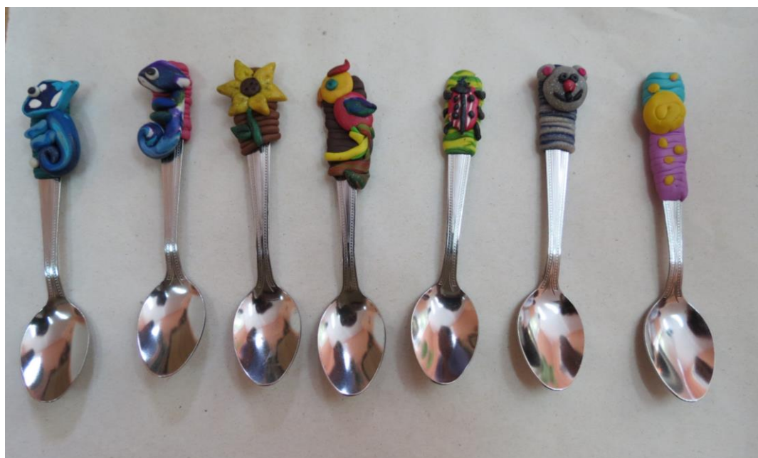
Fimo – lžička (viz příloha č. 5)