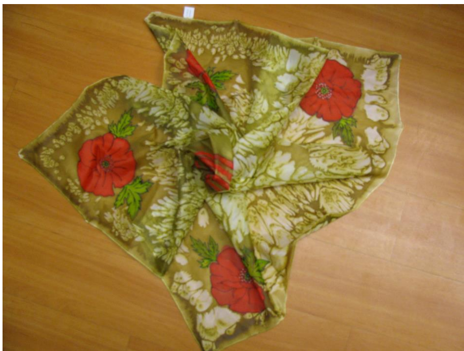
Malování na hedvábí (viz příloha č. 7)