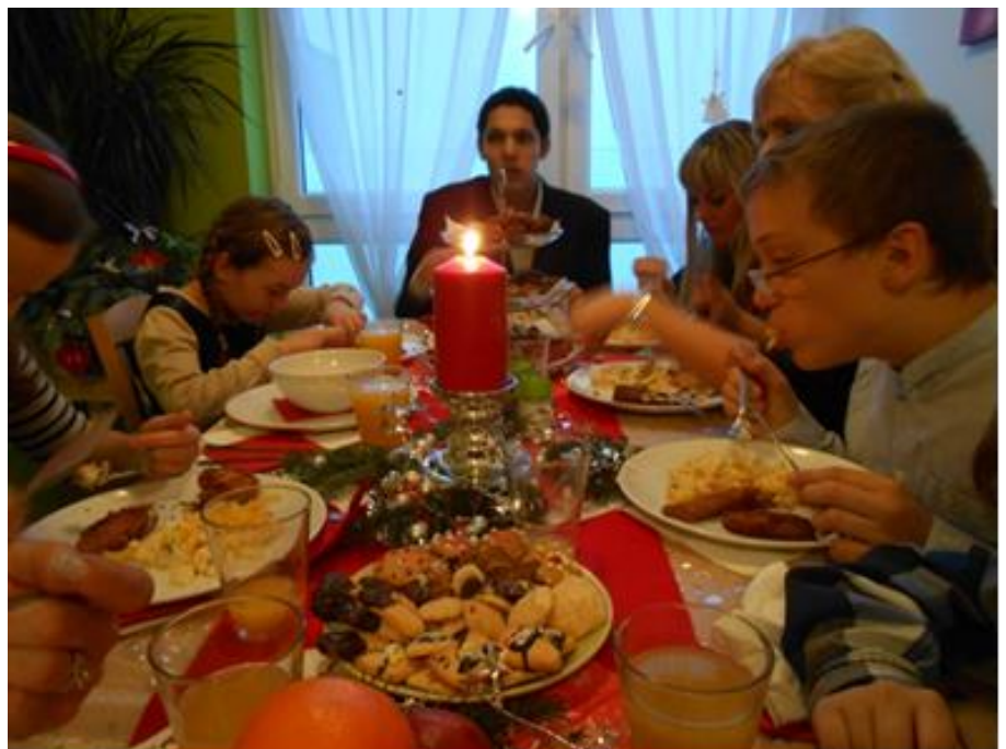
Vánoce (viz foto č. 2)