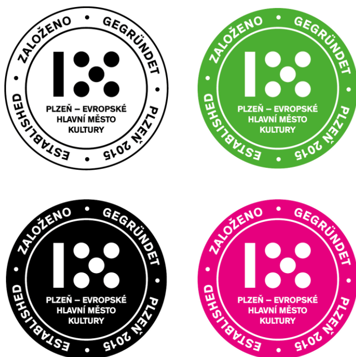
Příloha č. 2: Meeting Point Plzně 2015 - EHMK. [cit. 2017-04-05] Zdroj: http://www.plzen2015.cz/cs/meetingpoint