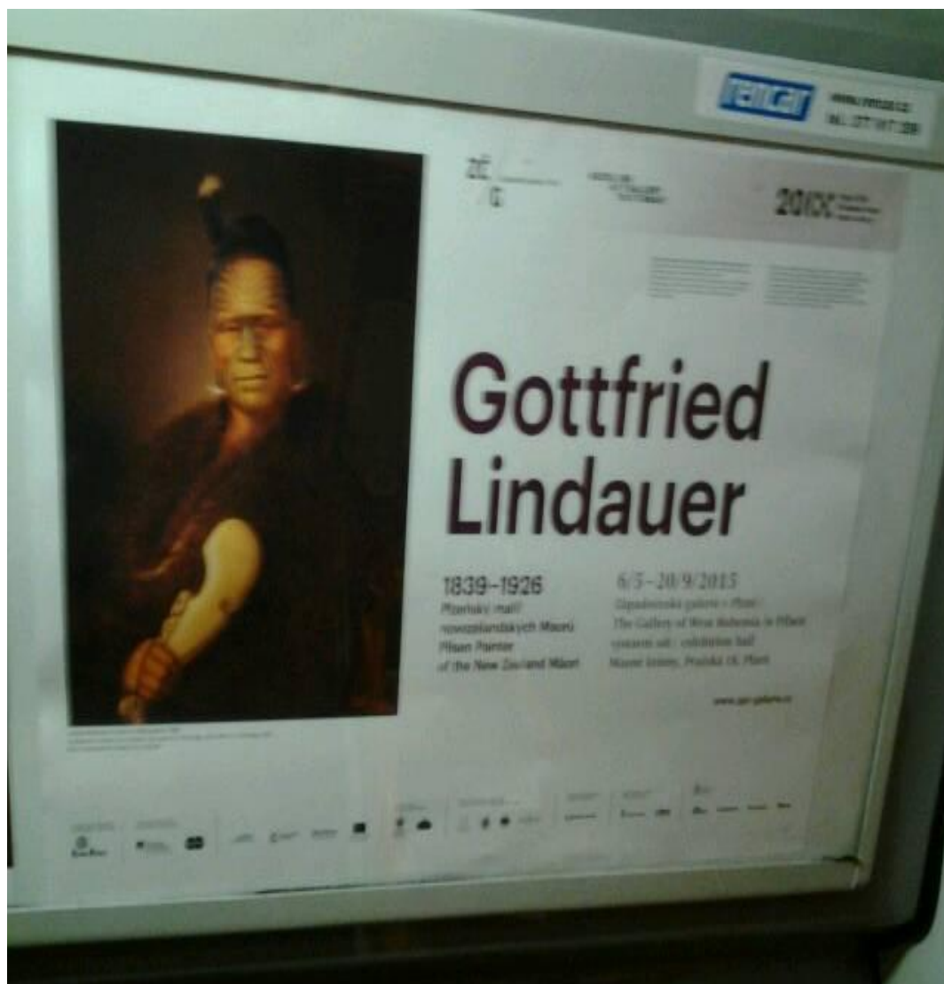
Příloha č. 7: Plakát v tramvaji k výstavě Gottfried Lindauer - Maorské portréty. [cit. 2017-04-05]