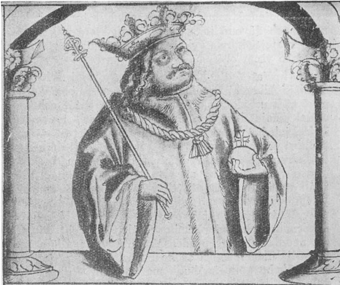
Král Jiří z Poděbrad ( Codex Hasenburgiens ). 613