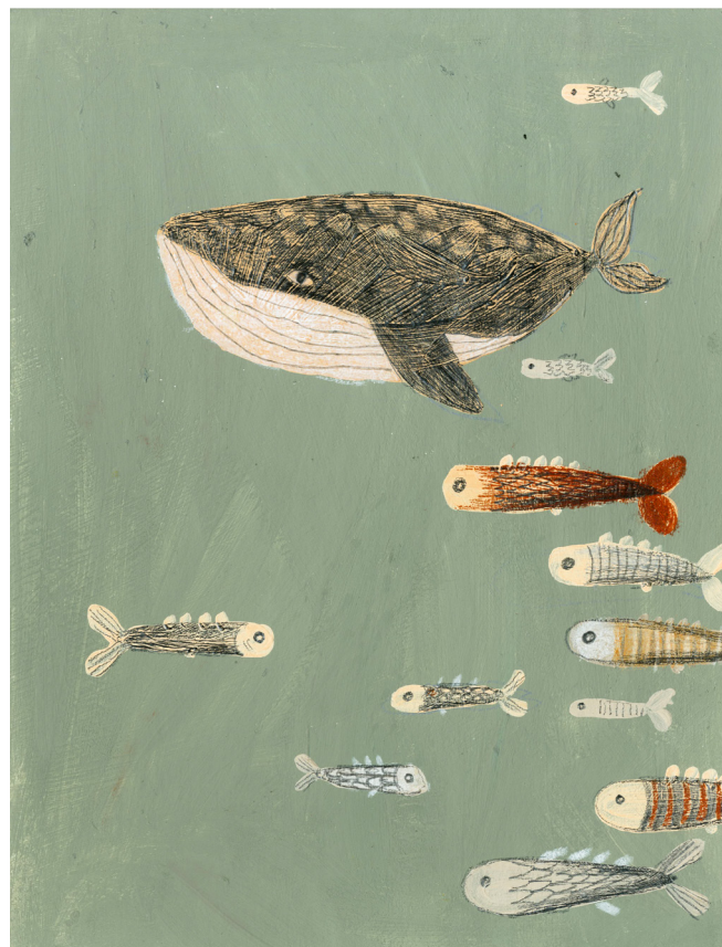
Príloha č. 6 Ilustrácia nedotknutej prírody