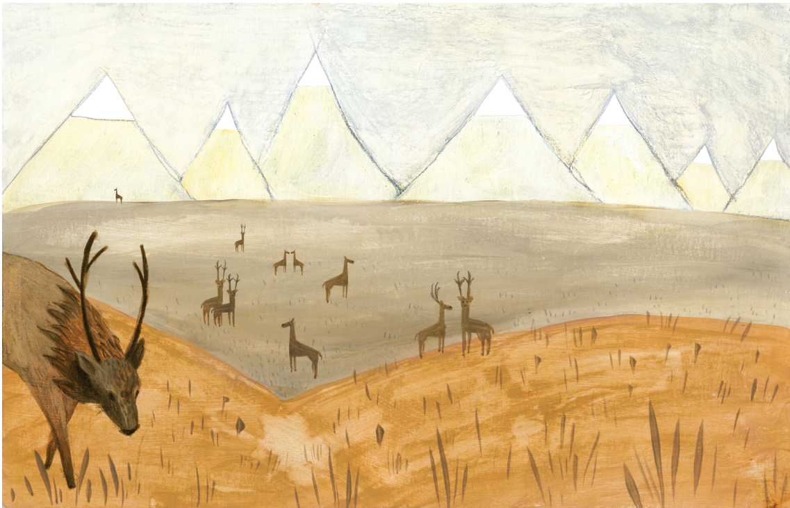
Príloha č. 5 Dvojstránka, ilustrácia nedotknutej prírody