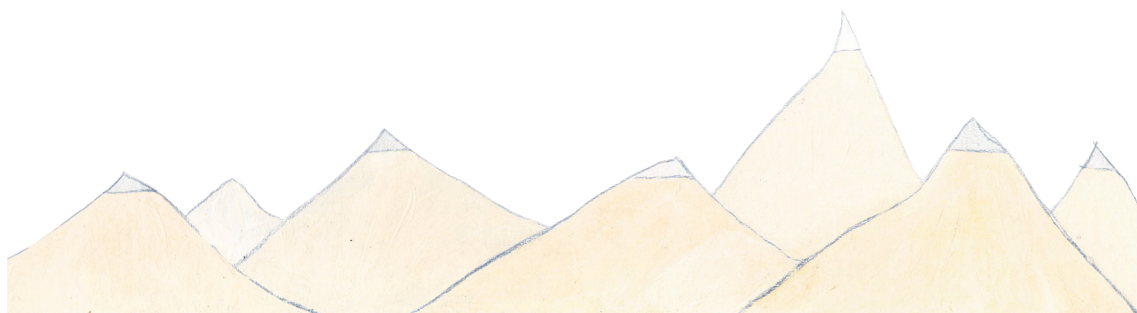
Príloha č. 7 Ilustrácie hôr, ktoré sprevádzajú celú knihu