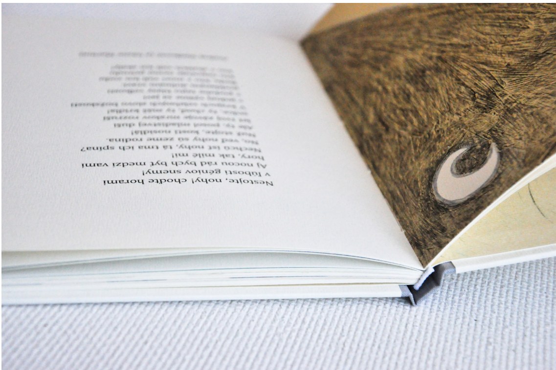
Príloha č. 16 Kniha vo finále