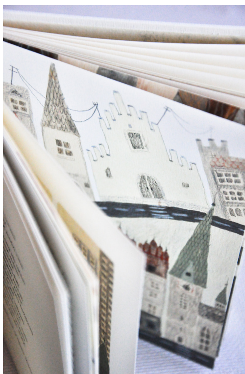
Príloha č. 18 Kniha vo finále