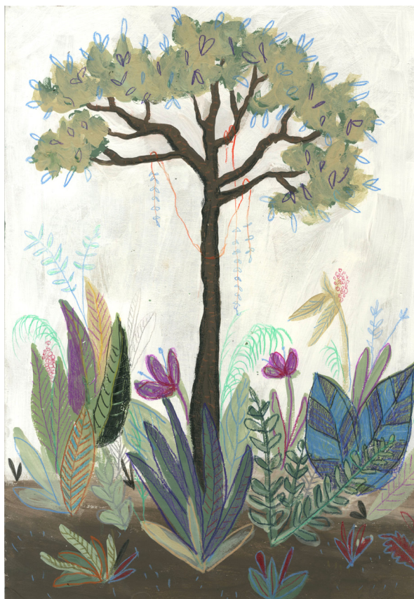
Príloha č. 1 Prvé pokusy ilustrácií