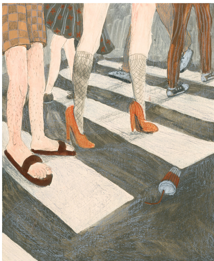
Príloha č. 12 Chaos v meste