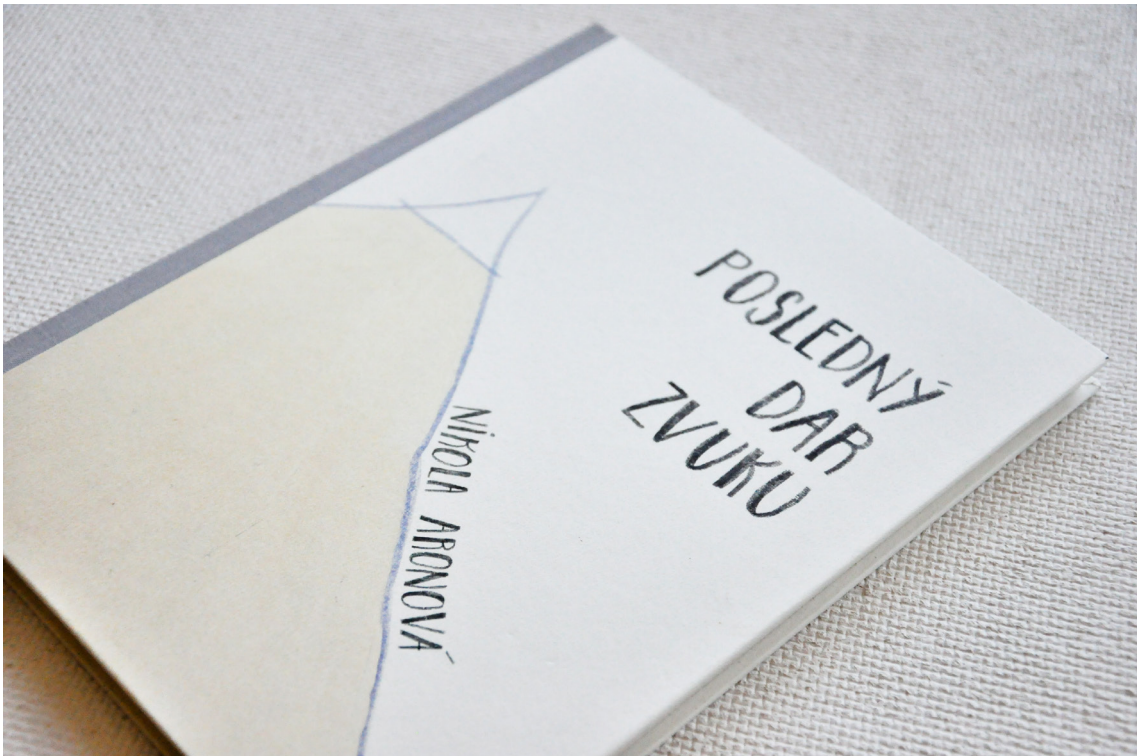
Príloha č. 15 Kniha vo finále