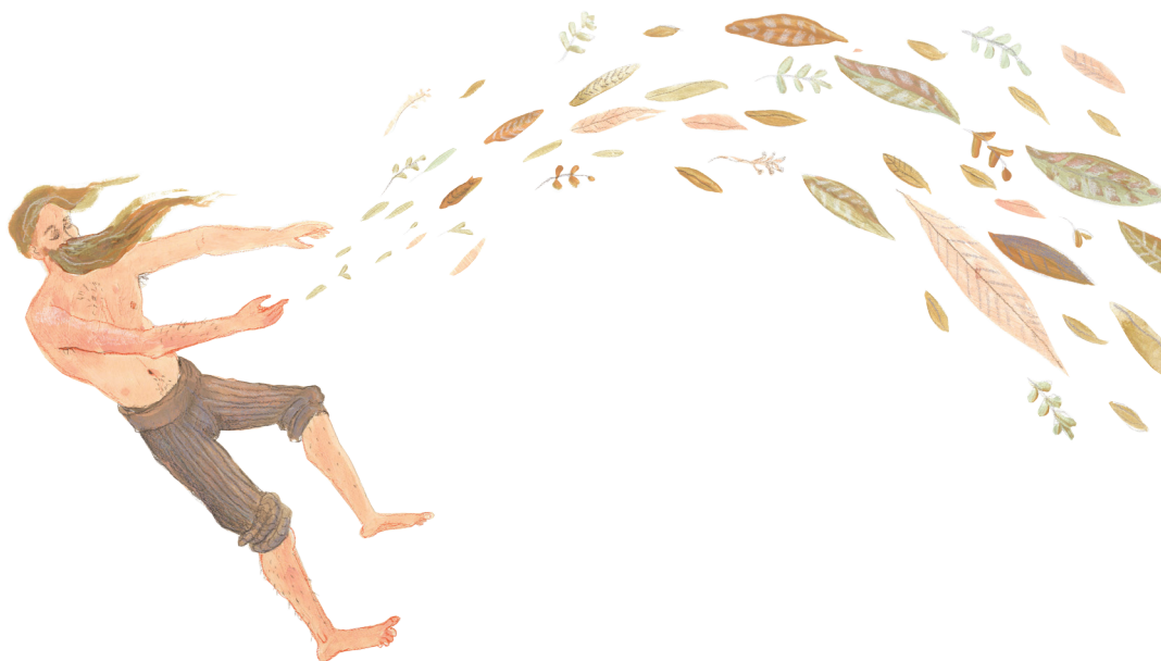
Príloha č. 9 Nástup ľudí na Zem