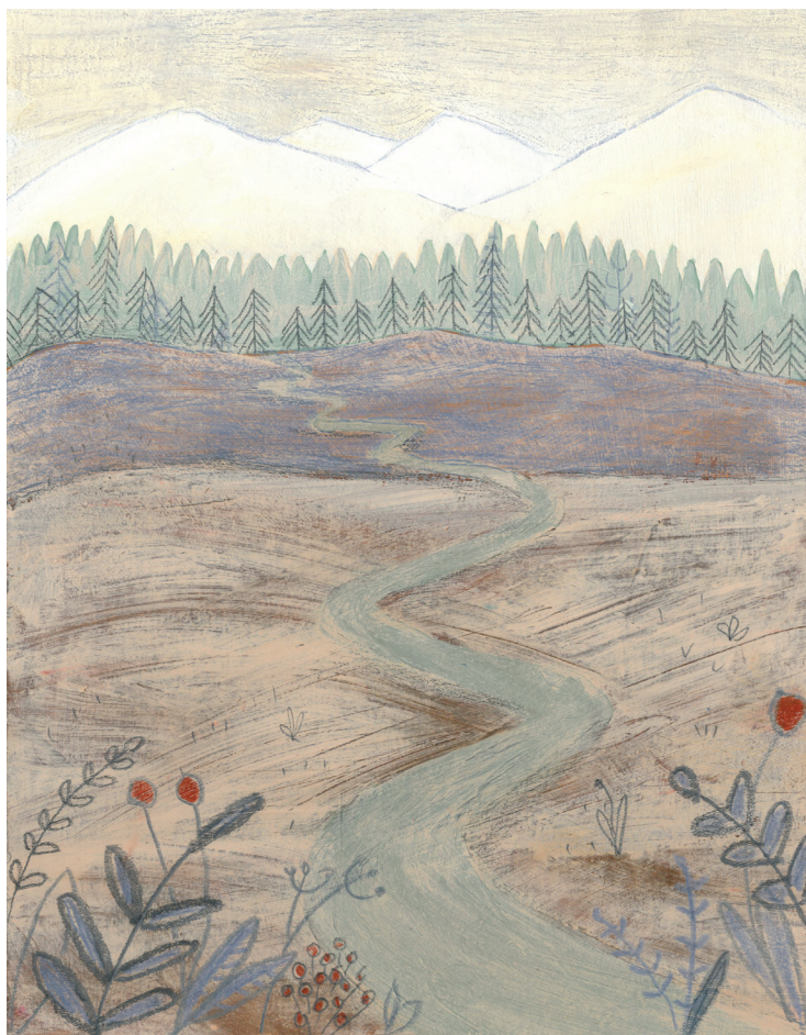
Príloha č. 13 Cesta Zvuku