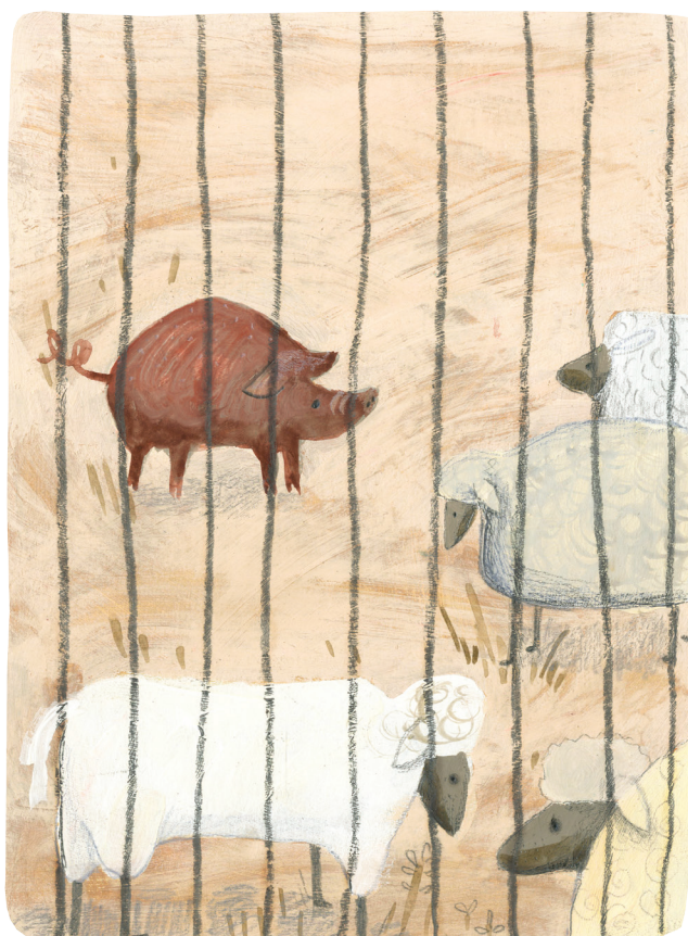
Príloha č. 10 Nástup ľudí na Zem