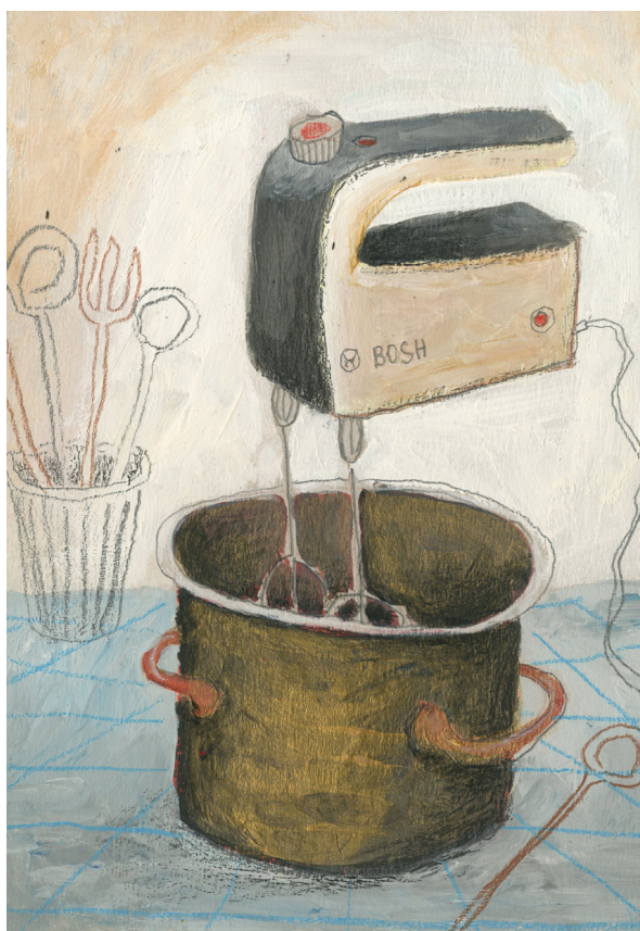
Príloha č. 2 Prvé pokusy ilustrácií