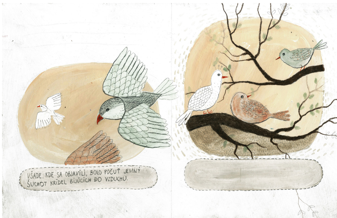
Príloha č. 3 Prvé pokusy ilustrácií