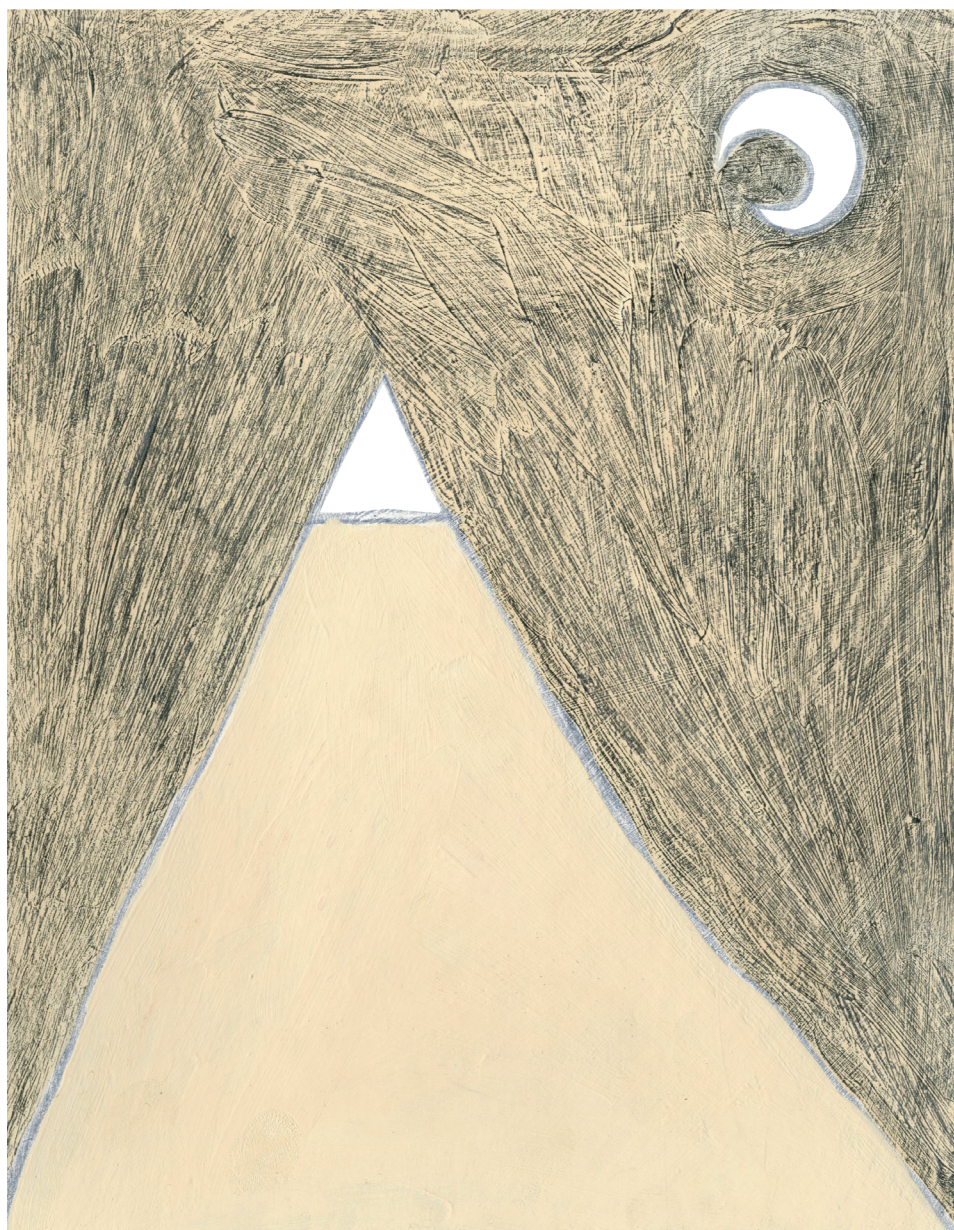
Príloha č. 8 Ilustrácie hôr, ktoré sprevádzajú celú knihu