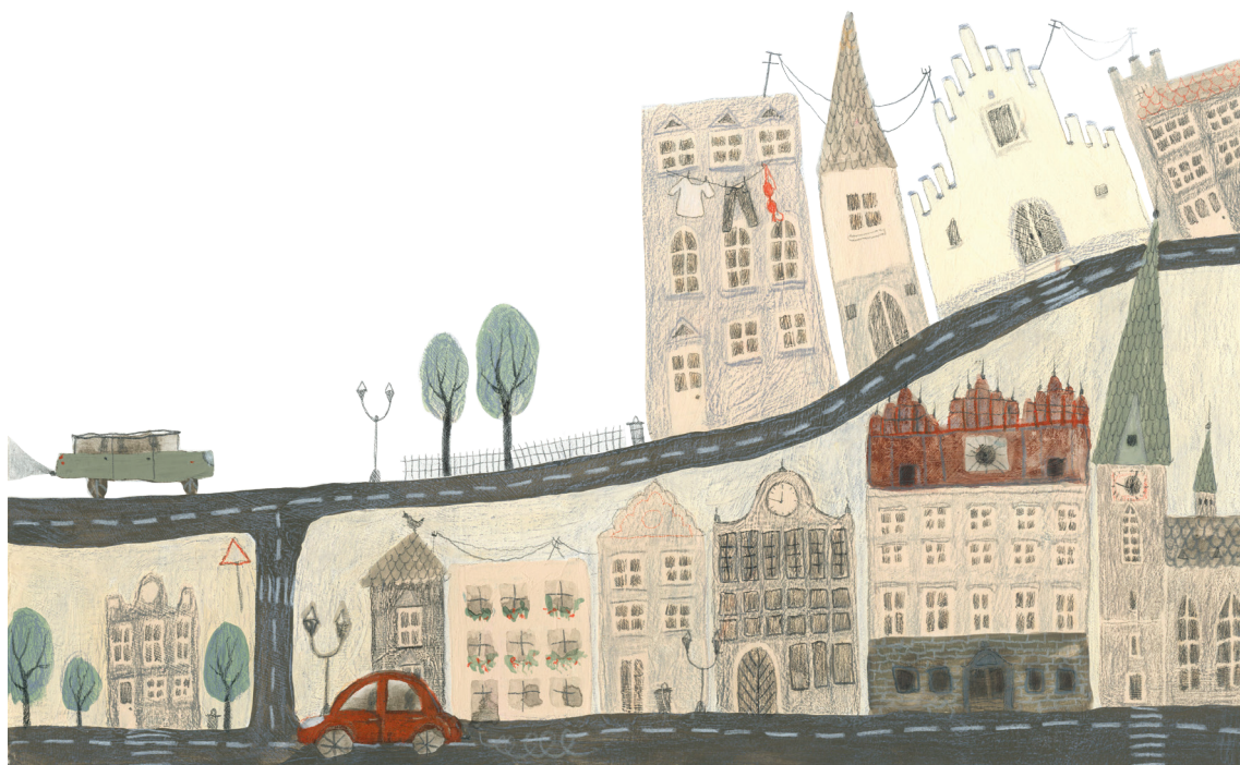
Príloha č. 11 Chaos v meste