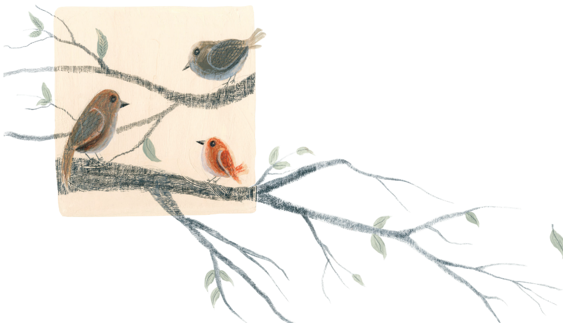
Príloha č. 4 Konečná verzia ilustrácie vyššie