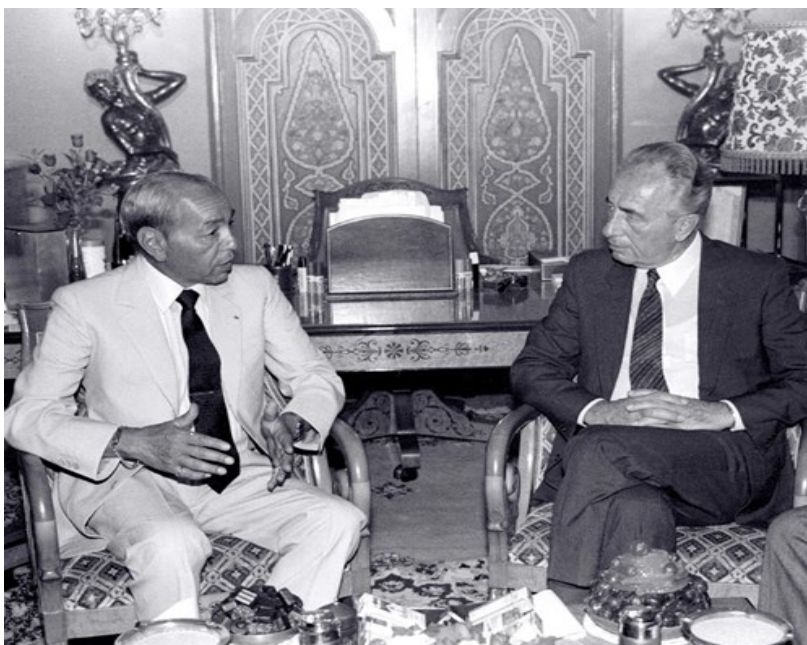
Obr. 9 Hassan II. během setkání se Šimonem Peresem v roce 1986