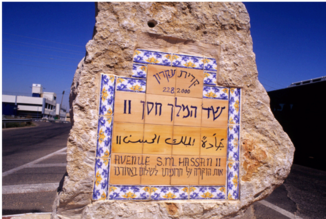
Obr. 10 Náměstí v izraelském městě Kiryat Ekron pojmenováno podle marockého krále