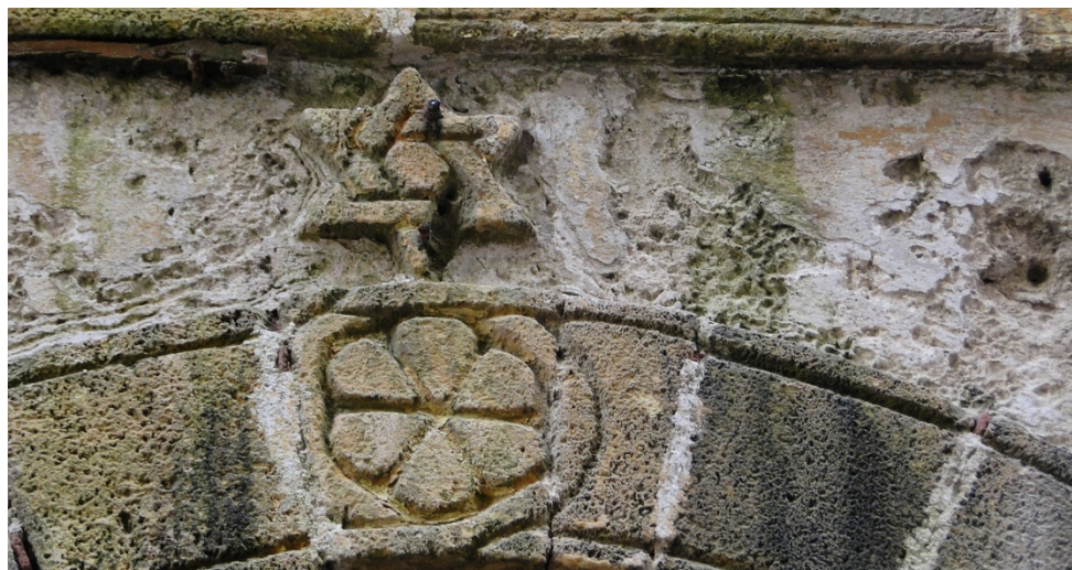
Obr. 3 Průčelí domu se židovskou hvězdou, As- Savíra

(Foto: Katarína Maruškinová, duben 2014)