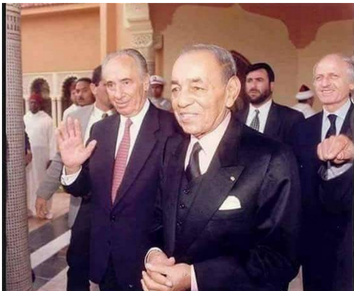
Obr. 7 nalevo Šimon Peres v paruce během návštěvy Maroka