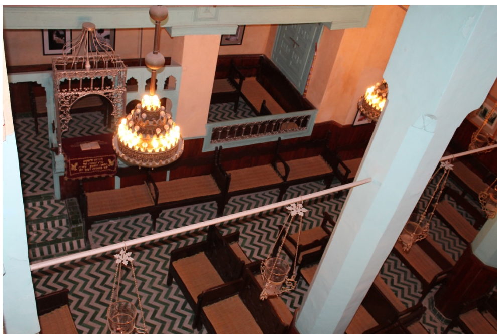
Obr. 6 Interiér synagogy Ben Danan ve Fezu