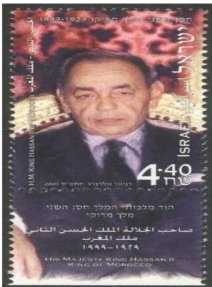
Obr. 11 Izraelská poštovní známka vydaná po smrti marockého krále Hassana II.