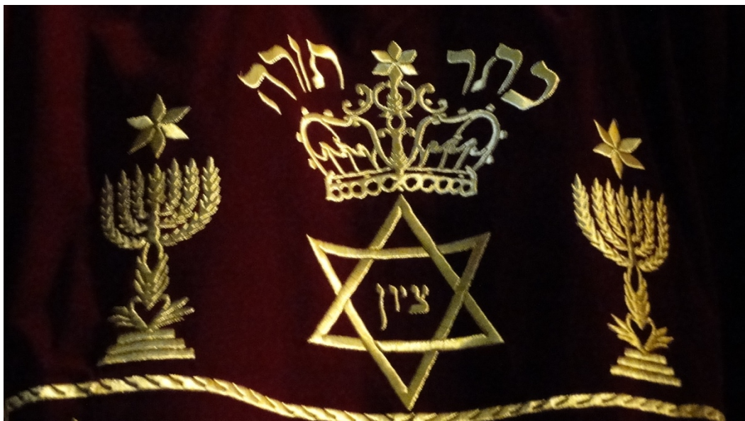
Obr. 4 Parochet v synagoze Ben Danan ve Fezu