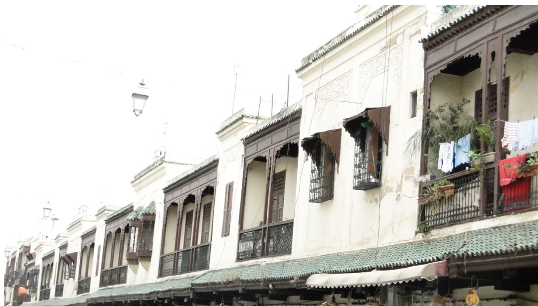
Obr. 5 Domy v milláhu ve Fezu