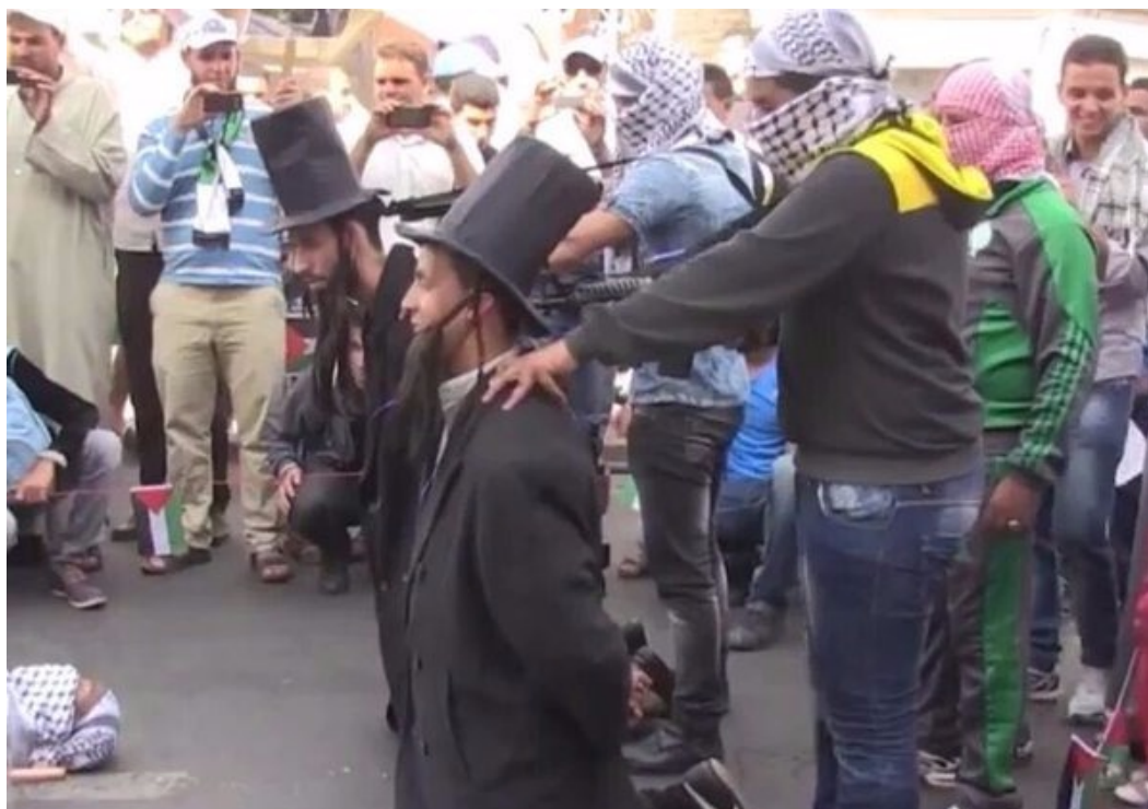
Obr. 12 „Poprava Židů“. Představení během demonstrace na podporu Gazy v roce 2015 v Rabatu