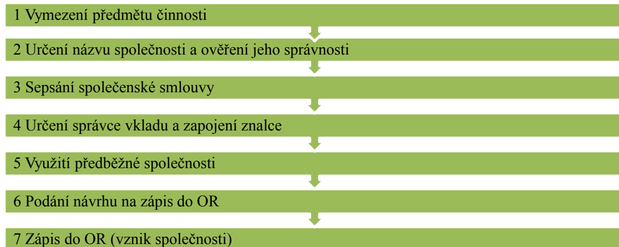
Obrázek 2 - Procesní náležitosti založení a vzniku společnosti s ručením omezeným v České republice