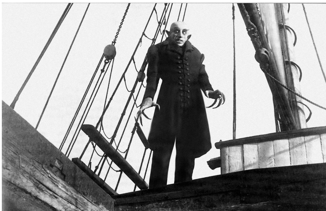
Příloha 10. Vyobrazení Drákuly z filmu Dracula (Dracula 1979).