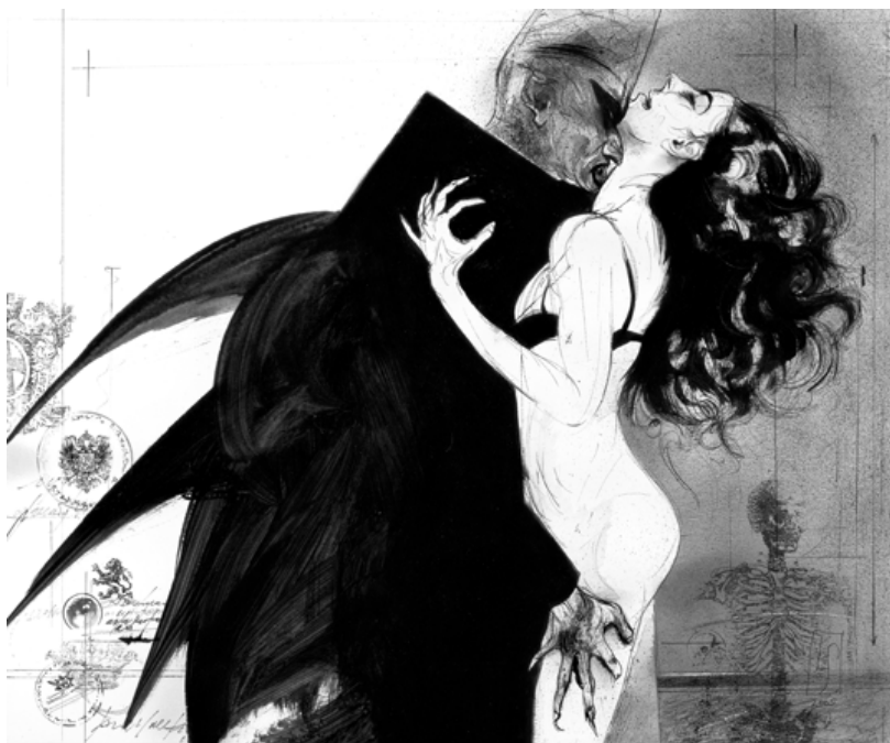
Příloha 8. Obrázek Drákuly podle Storkera (Storker 2009).