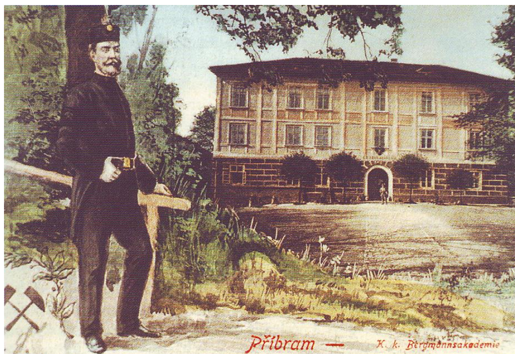
Příloha č. 1. Zámeček, první sídlo Vysoké školy báňské v Příbrami