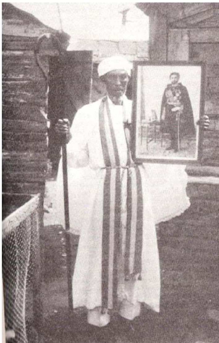
Obrázek 1 - Horský rastafarián s holí a obrazem Haile Selassieho (Barett 1997: 107).