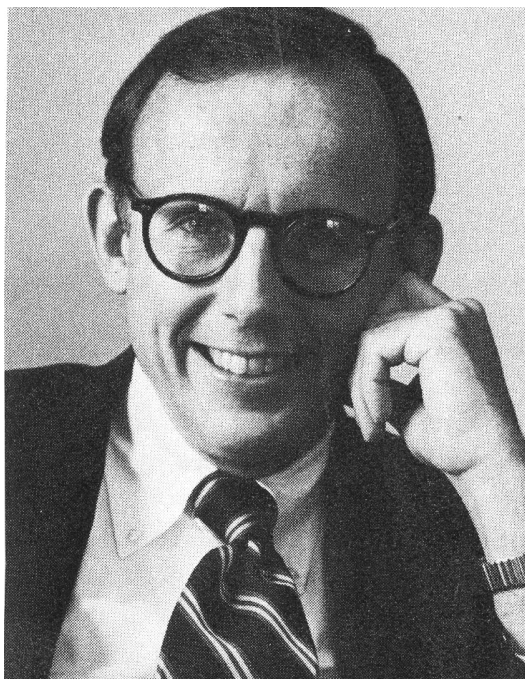
Obr. 1 Samuel Phillips Huntington v roce 1985.