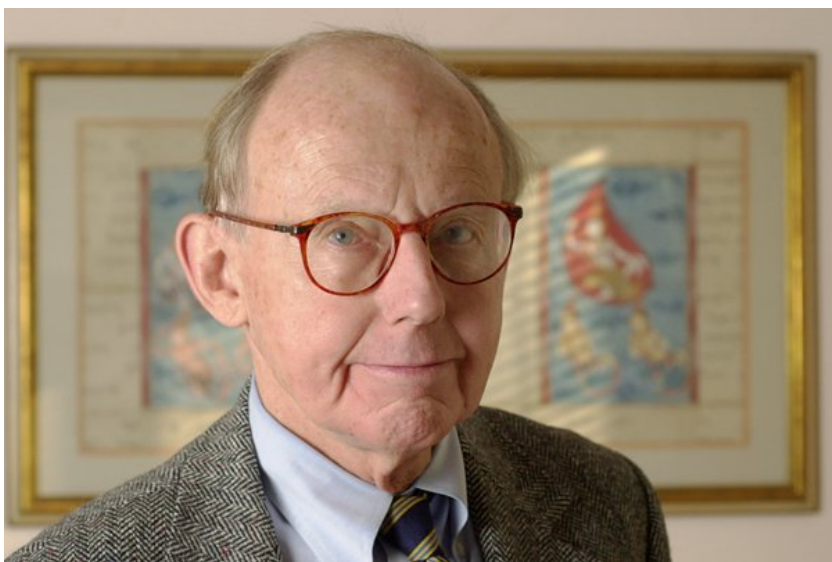
Obr. 2 Samuel P. Huntington.