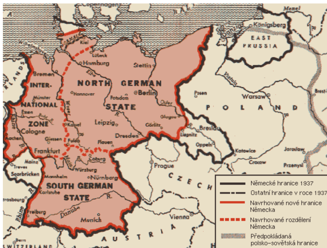
Morgenthauův plán na rozdělení Německa

Zdroj: zkrácené memorandum v Morgenthau, Henry: Germany Is Our Problem, New York 1945, s. V-VIII zveřejněné na http://www.fronta.cz/dokument/morgenthauuv-plan#b citováno dne 23. 3. 2012