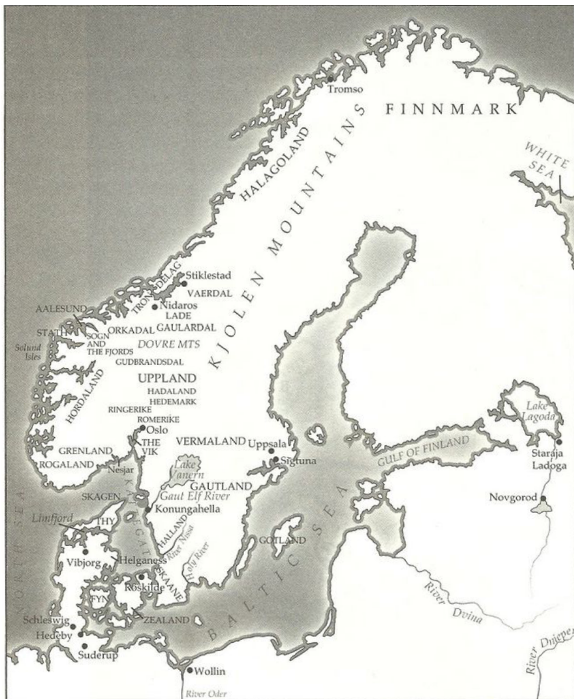
Obrazová příloha č. 1 - Mapa Skandinávského poloostrova. 120