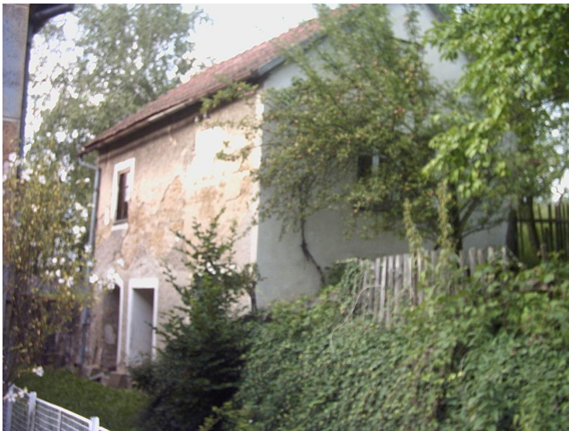
Příloha č. 1, Nejzachovalejší část Špíškova mlýna