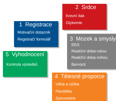
Obrázek 1: Členění stanovišť na Dnech vědy a techniky 2017.

Měření probíhá v prostoru vybaveném potřebnými přístroji, které jsou přiřazeny na jednotlivá stanoviště. Místem k měření může být laboratoř, větší místnost nebo jiný prostor, který splňuje požadavky na provedení měření (teplota, ticho, dostatek prostoru, ...). Každé stanoviště je obsazeno osobou pověřenou k měření, experimentátorem. Měřené subjekty postupně prochází přes jednotlivá stanoviště. Na začátku je každá nově příchozí osoba podrobena registraci, která zahrnuje seznámení s měřením, podepsání informovaného souhlasu a vyplnění krátkého dotazníku obsahujícího otázky týkající se životního stylu. Osoby dále absolvují sérii experimentů na připravených stanovištích pod dohledem pověřené osoby. Posledním stanovištěm je vyhodnocení, na kterém probíhá kontrola naměřených údajů.