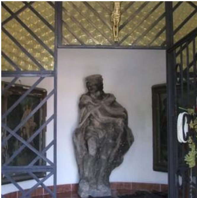
Obr. č. 6: Socha ecce homo