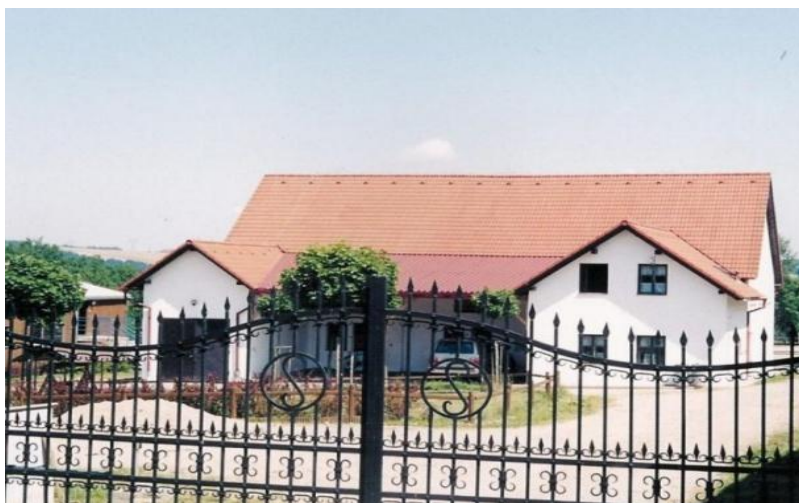
Obr. č. 3: Vchod do areálu stáje Straka - Němčovice

Předsedou tohoto sdružení je Ing. Vladislav Straka. Zařízení je velice snadno dostupné, protože se nachází na okraji obce Němčovice.