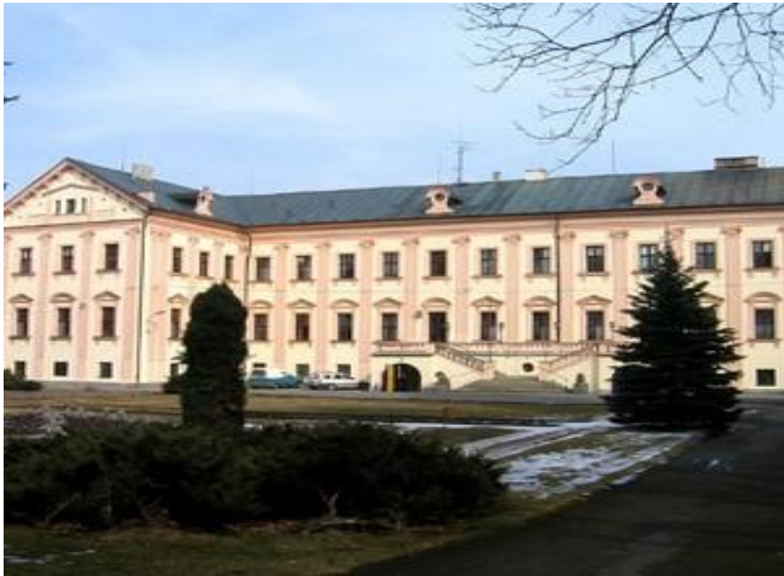
Obr. č. 2: Zámek Liblín