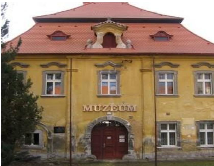
Obr. č. 4: Městské muzeum Radnice