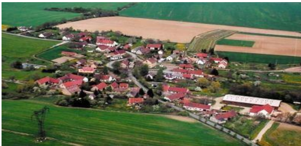
Obr. č. 1: Letecký snímek Němčovic

Obec Němčovice je součástí okresu Rokycany a patří pod Plzeňský kraj. Příslušnou obcí s rozšířenou působností je rovněž okresní město Rokycany. „Obec je základním územním samosprávným společenstvím občanů; tvoří územní celek, který je vymezen hranicí území obce.“ [29] Obec Němčovice leží přibližně šestnáct kilometrů od Rokycan. „Obce s rozšířenou působností, v jejichž kompetenci je výkon státní správy v přenesené působnosti ve svém správním obvodu, a to v oblasti evidence obyvatel, vydávání dokladů a živnostenských oprávnění, výplaty sociálních dávek, péče o nemocné a seniory, sociálně právní ochrany dětí, vodosprávního a odpadového hospodářství, péče o životní prostředí, správy lesů, myslivosti a rybářství a v oblasti dopravy a silničního hospodářství“ [11]. Obec tvoří dvě části, kterými jsou Němčovice a Olešná. V této obci žije 120 stálých obyvatel. Celková katastrální plocha obce je 1101 ha, z toho orná půda zabírá 46%. Asi jedna třetina katastru obce je porostlá lesem. Vzhledem k geografické poloze, bychom našli v obci velmi málo ploch s travním porostem. [17]