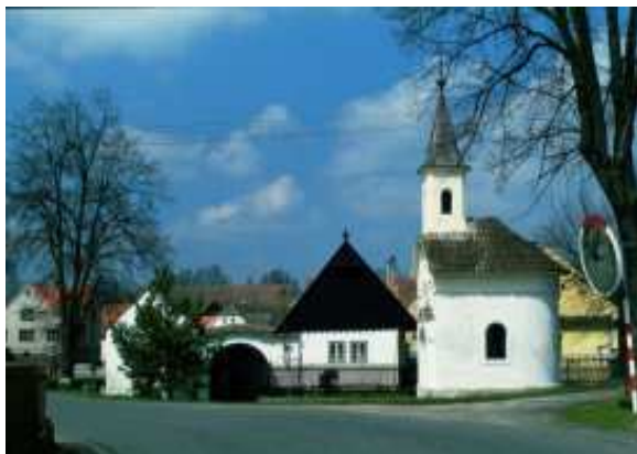
Obrázek č. 5: Osada Bechyňská Smoleč

Bechyňskou Smoleč můžeme navštívit na trase z Tábora do Týna, její vzdálenost od Sudoměřic činí asi 2 km. Tato osada je vyhlášena vesnickou památkovou zónou, jelikož je nejseverněji položenou vesnicí s dochovanými stavbami Jihočeského selského baroka.