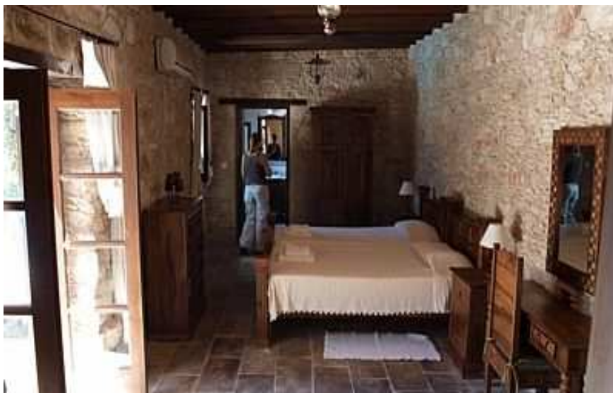
Obrázek č. 2: Ubytování v agrocentru v Řecku