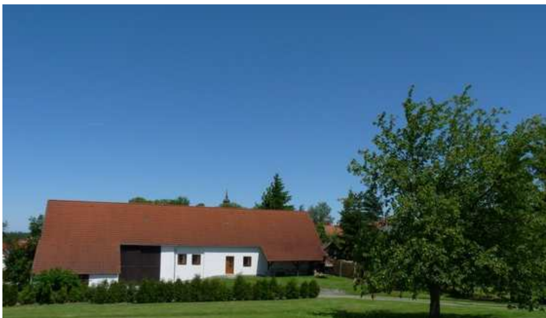
Obrázek č. 7: Statek

Celý objekt má charakter uzavřeného dvora, což můžeme vidět na leteckém snímku farmy (obr. č. 4). Statek je současně rozdělen na dvě části a to ubytování pro majitele a penzion pro hosty. Je částečně zrekonstruovaný, přičemž disponuje pouze dvěma apartmány s kapacitou celkem pro dvacet lidí. Myslím, že toto není příliš vhodné uzpůsobení, bylo by lepší vybudovat více apartmánů s menší kapacitou, jelikož na takovéto dovolené jezdí především rodiny s dětmi, které mají rámcově čtyři členy. Umožnilo by to zajistit větší obsazenost farmy. Zákazníci mají zpřístupněnou společenskou místnost, venkovní posezení, mohou si zapůjčit velký gril, aby jejich dovolená byla co nejpestřejší a čas zde strávený ideálně využit.