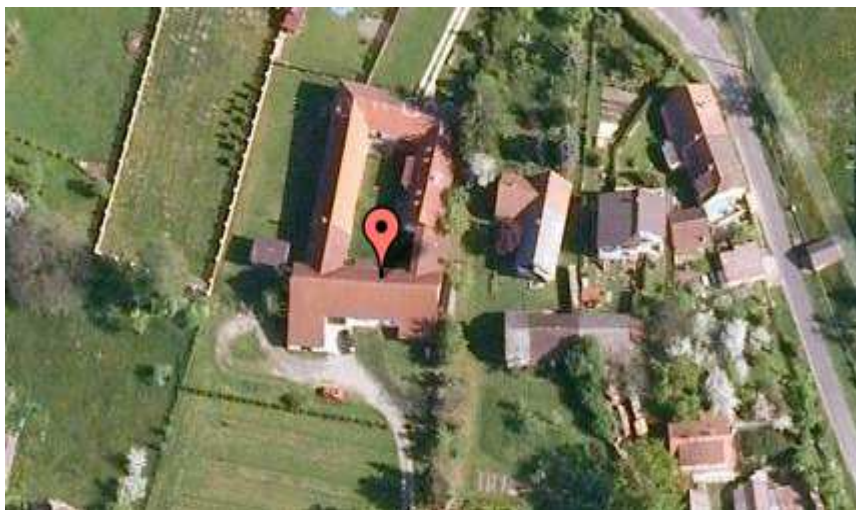
Obrázek č. 4: Letecký snímek farmy

Na leteckém snímku máte možnost si prohlédnout rozsáhlou stavbu Farmy u lesa.