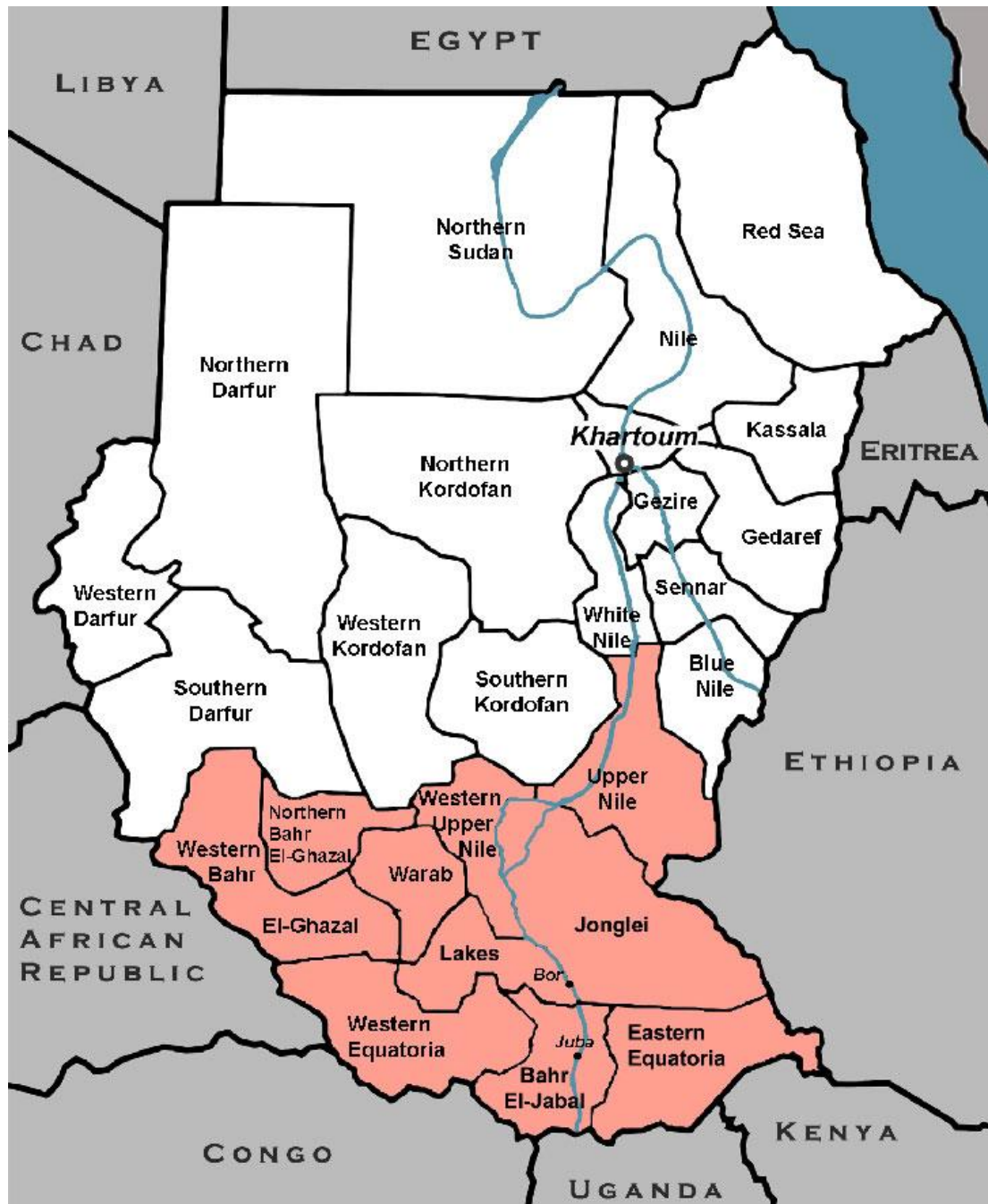
Příloha č.1: Mapa Súdánu