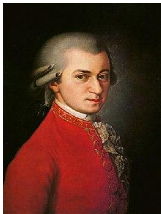
Wolfgang Amadeus Mozart