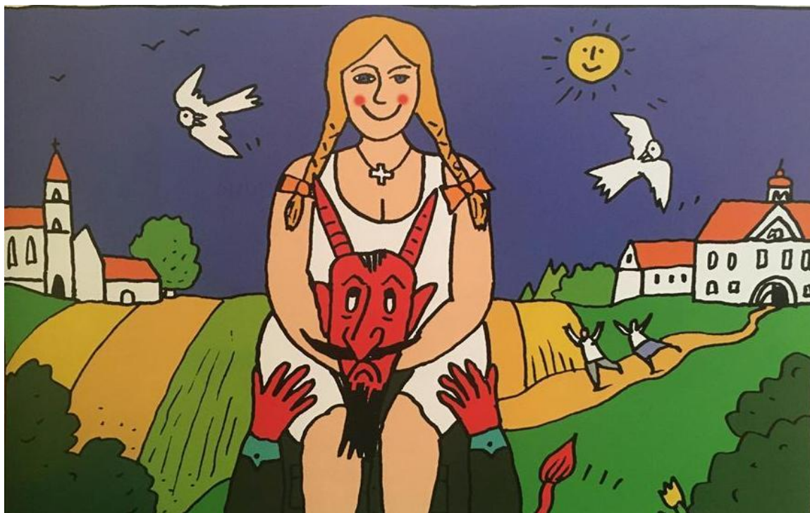
Obrázek č. 1 - Použitý jako motivace v úvodu hodiny