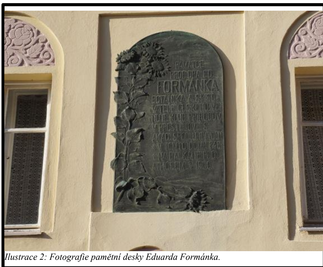
Ilustrace 2: Fotografie pamětní desky Eduarda Formánka.