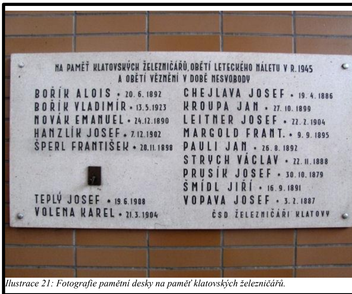
Ilustrace 21: Fotografie pamětní desky na paměť klatovských železničářů.