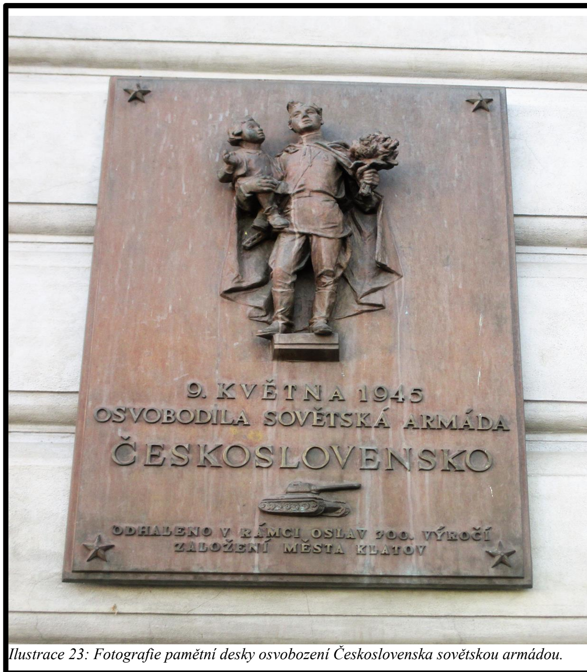
Ilustrace 23: Fotografie pamětní desky osvobození Československa sovětskou armádou.