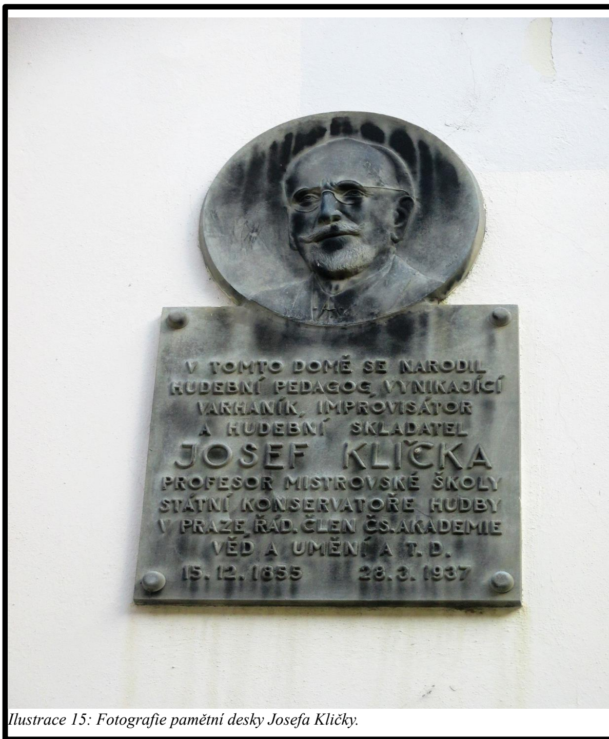
Ilustrace 15: Fotografie pamětní desky Josefa Klíčky.