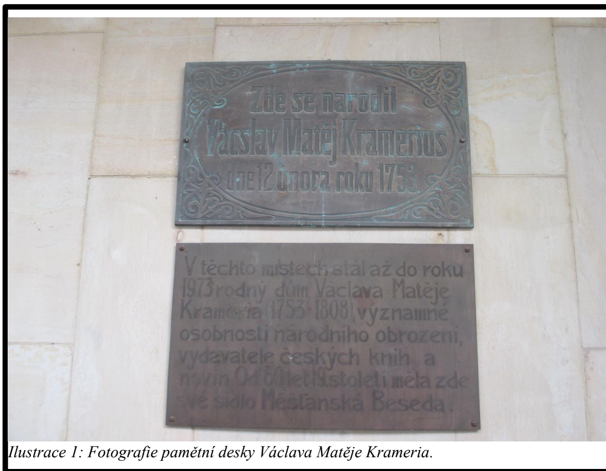
Ilustrace 1: Fotografie pamětní desky Václava Matěje Krameria.