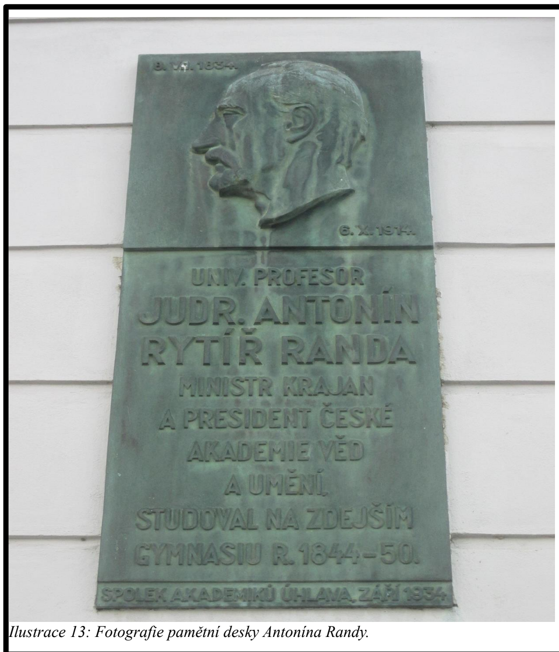
Ilustrace 13: Fotografie pamětní desky Antonína Randy.