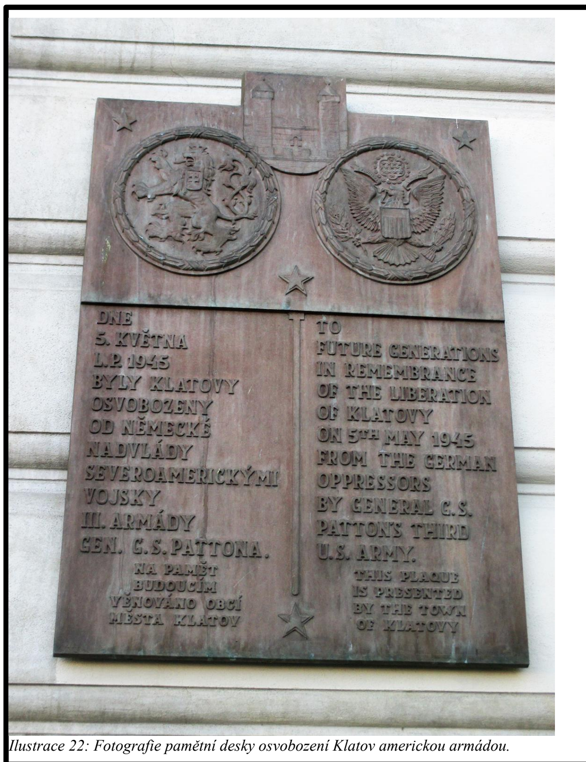
Ilustrace 22: Fotografie pamětní desky osvobození Klatov americkou armádou.