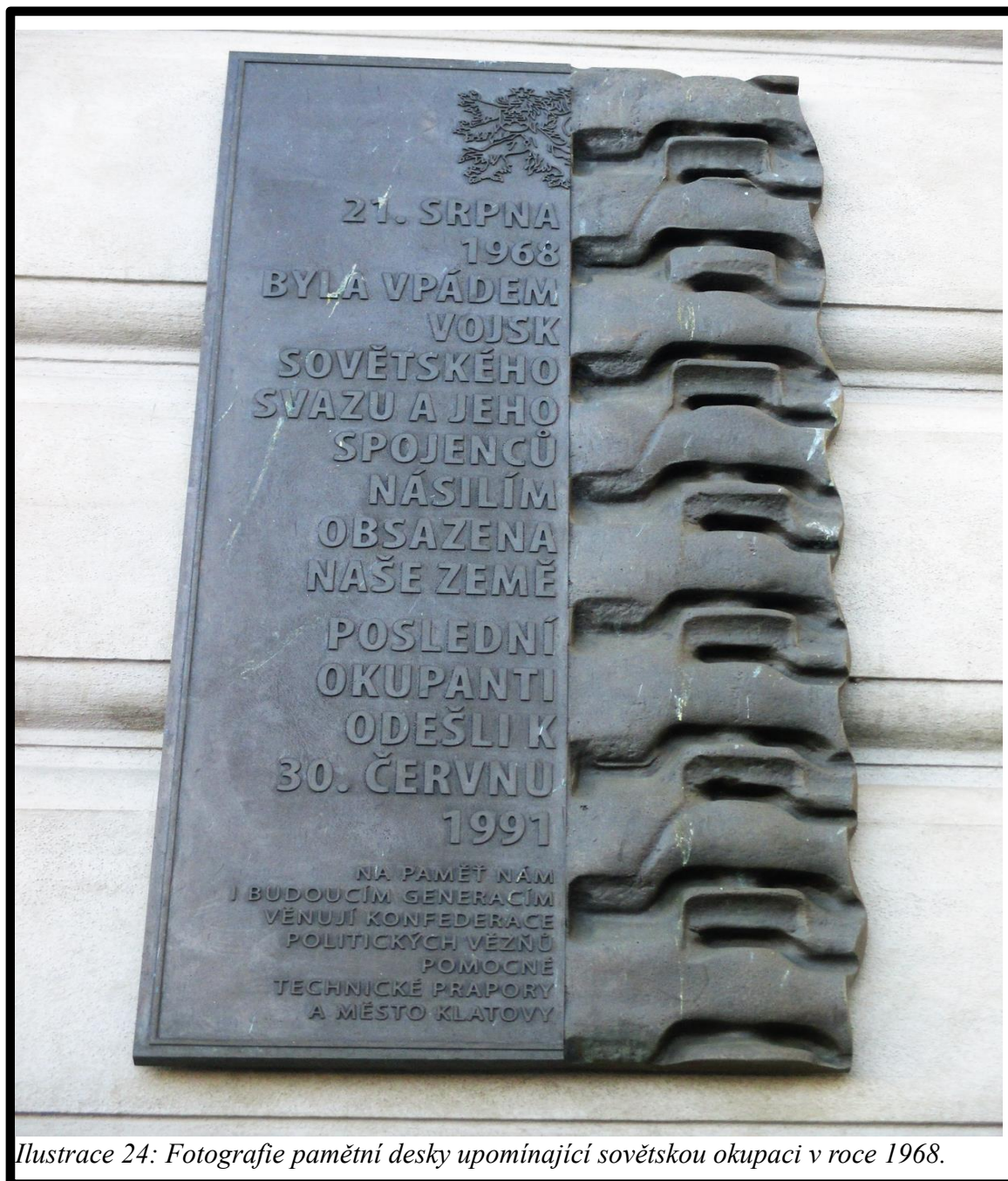
Ilustrace 24: Fotografie pamětní desky upomínající sovětskou okupaci v roce 1968.