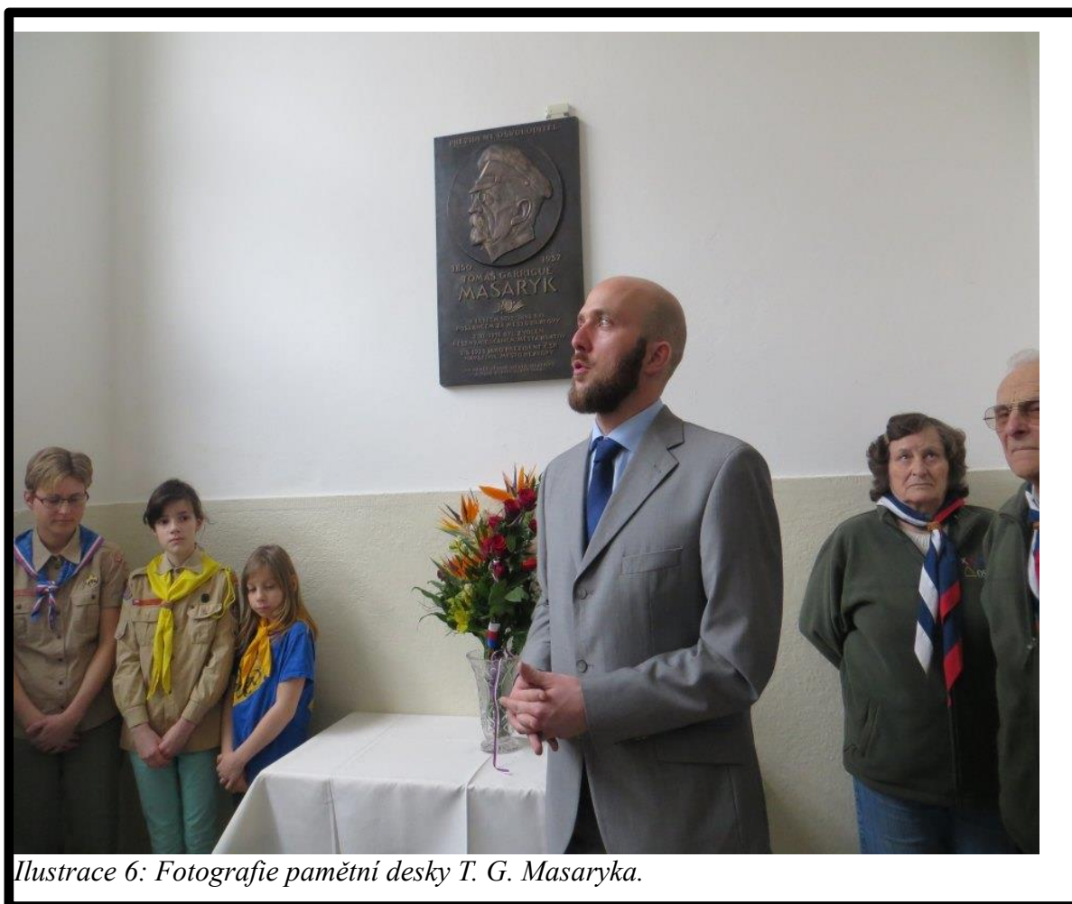
Ilustrace 6: Fotografie pamětní desky T. G. Masaryka.