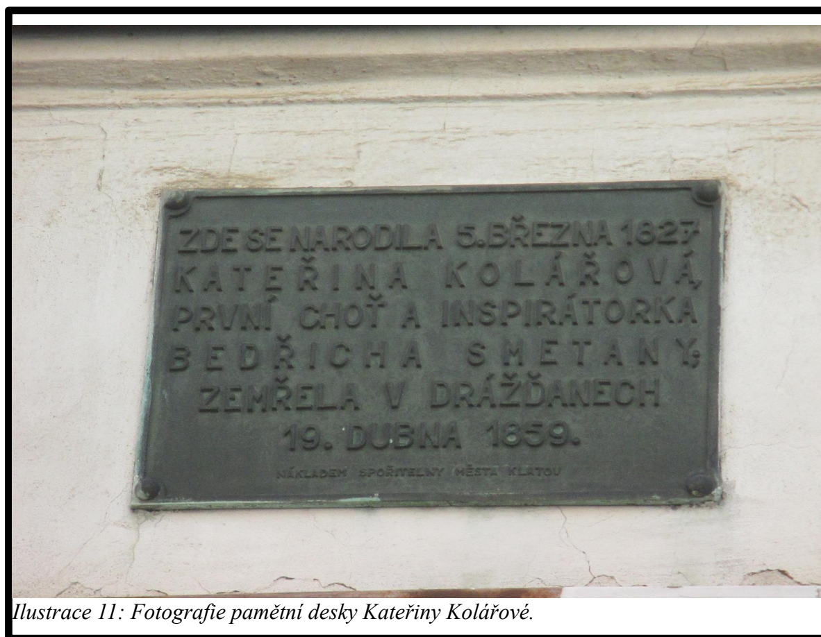
Ilustrace 11: Fotografie pamětní desky Kateřiny Kolářové.