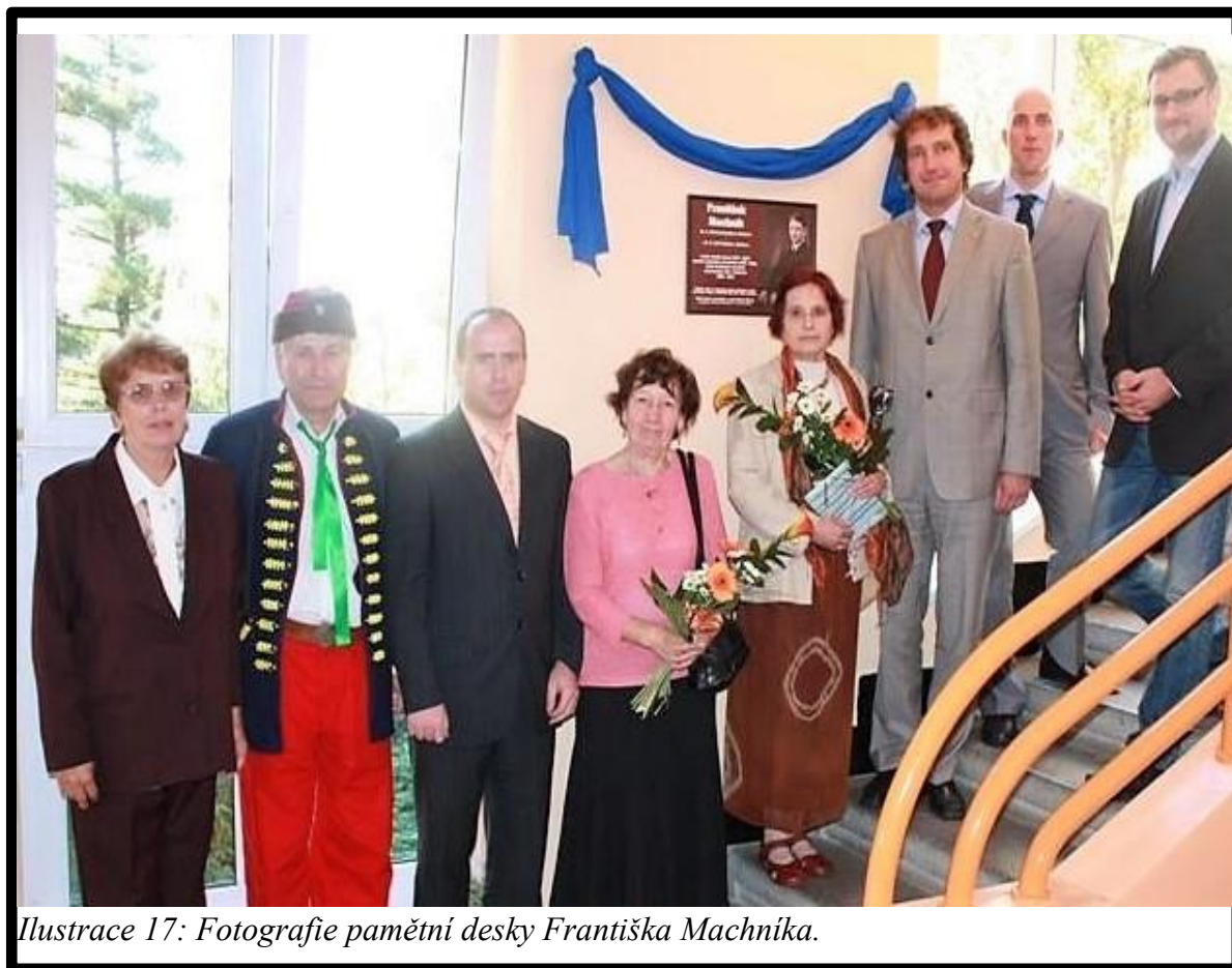
Ilustrace 17: Fotografie pamětní desky Františka Machníka.