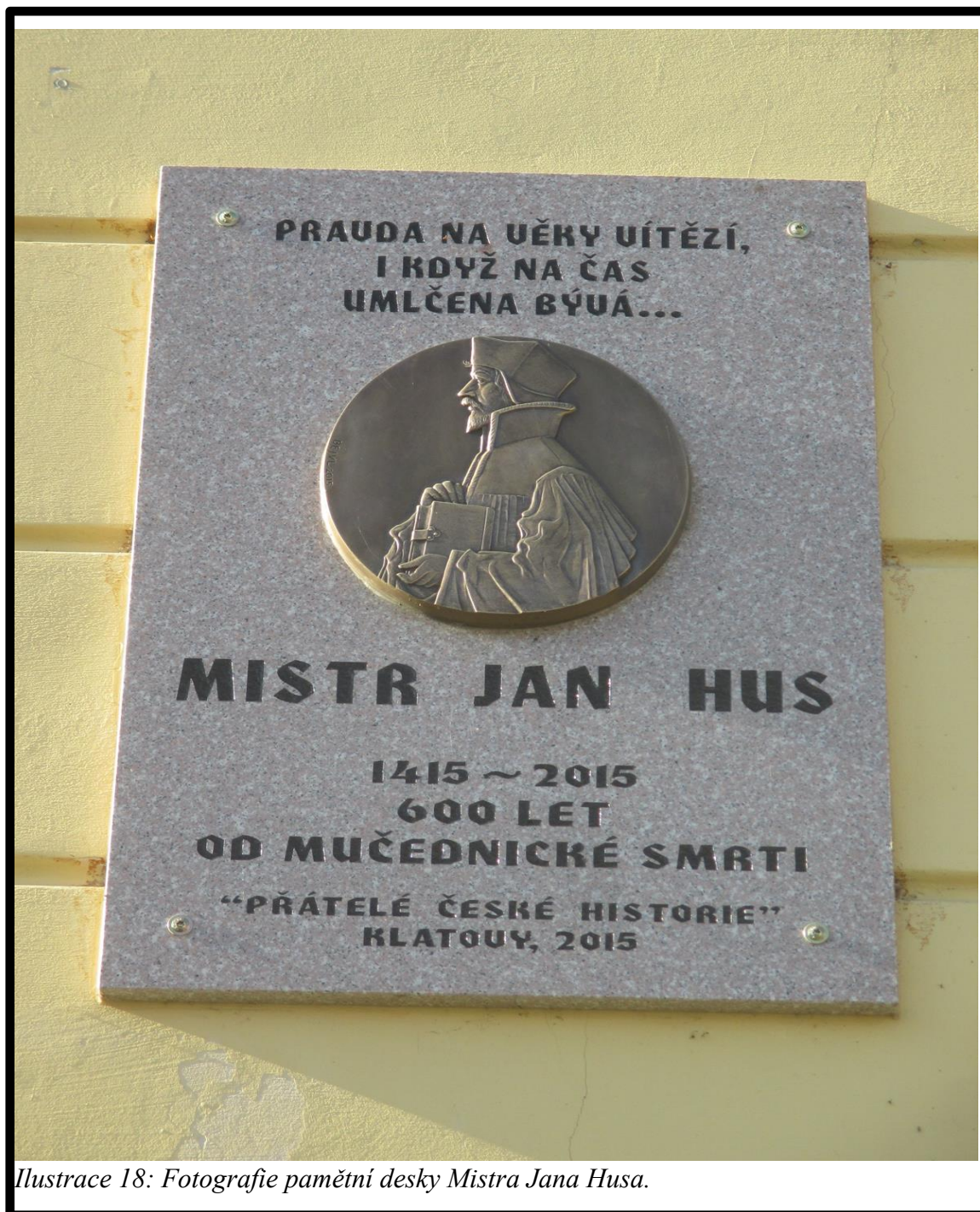
Ilustrace 18: Fotografie pamětní desky Mistra Jana Husa.