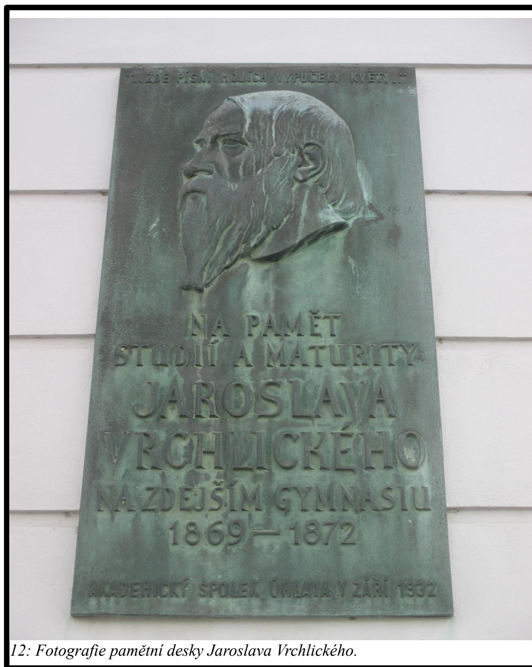
12: Fotografie pamětní desky Jaroslava Vrchlického.