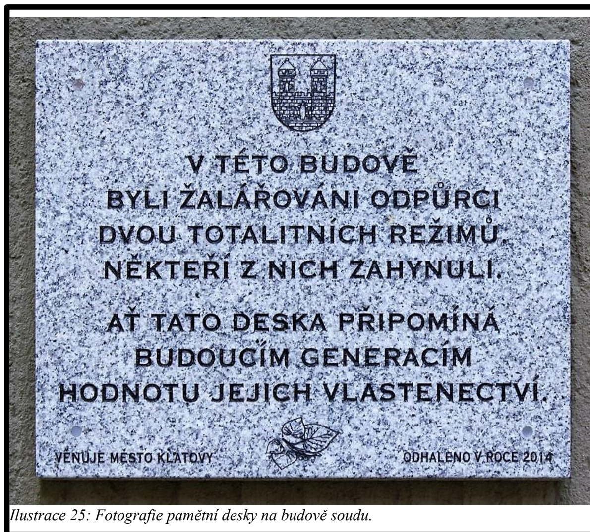
Ilustrace 25: Fotografie pamětní desky na budově soudu.