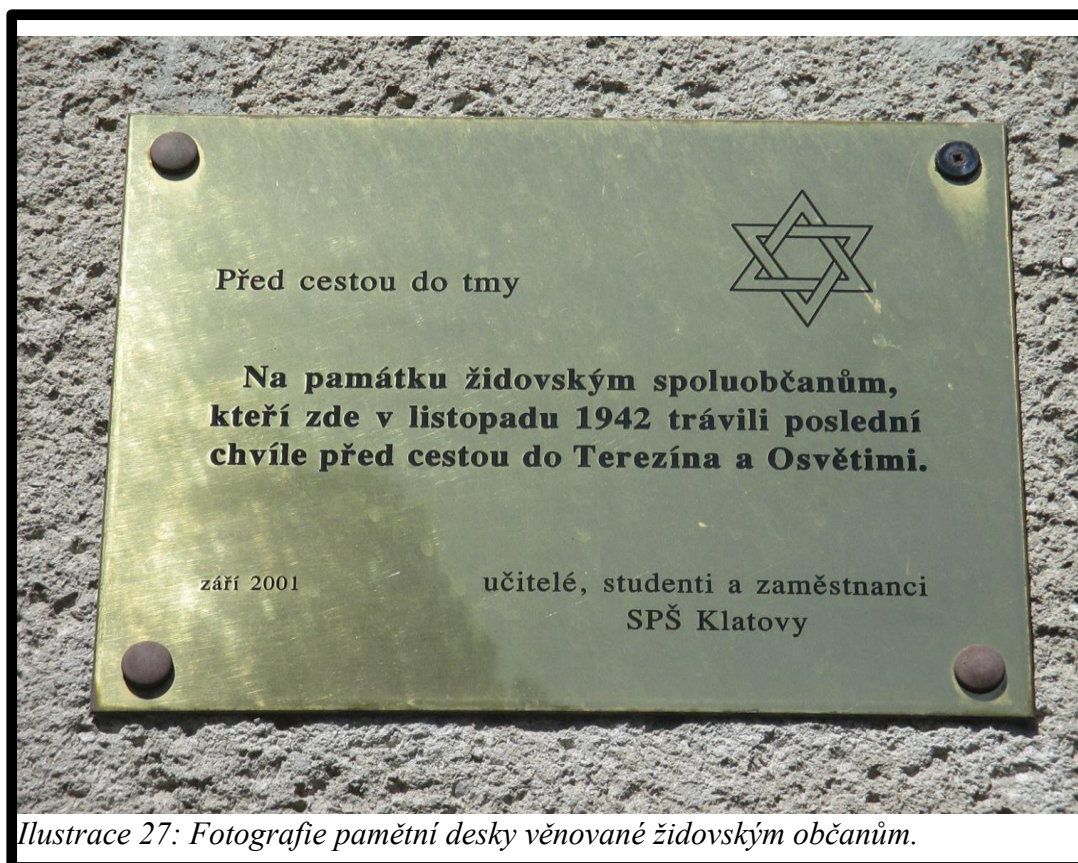
Ilustrace 27: Fotografie pamětní desky věnované židovským občanům.