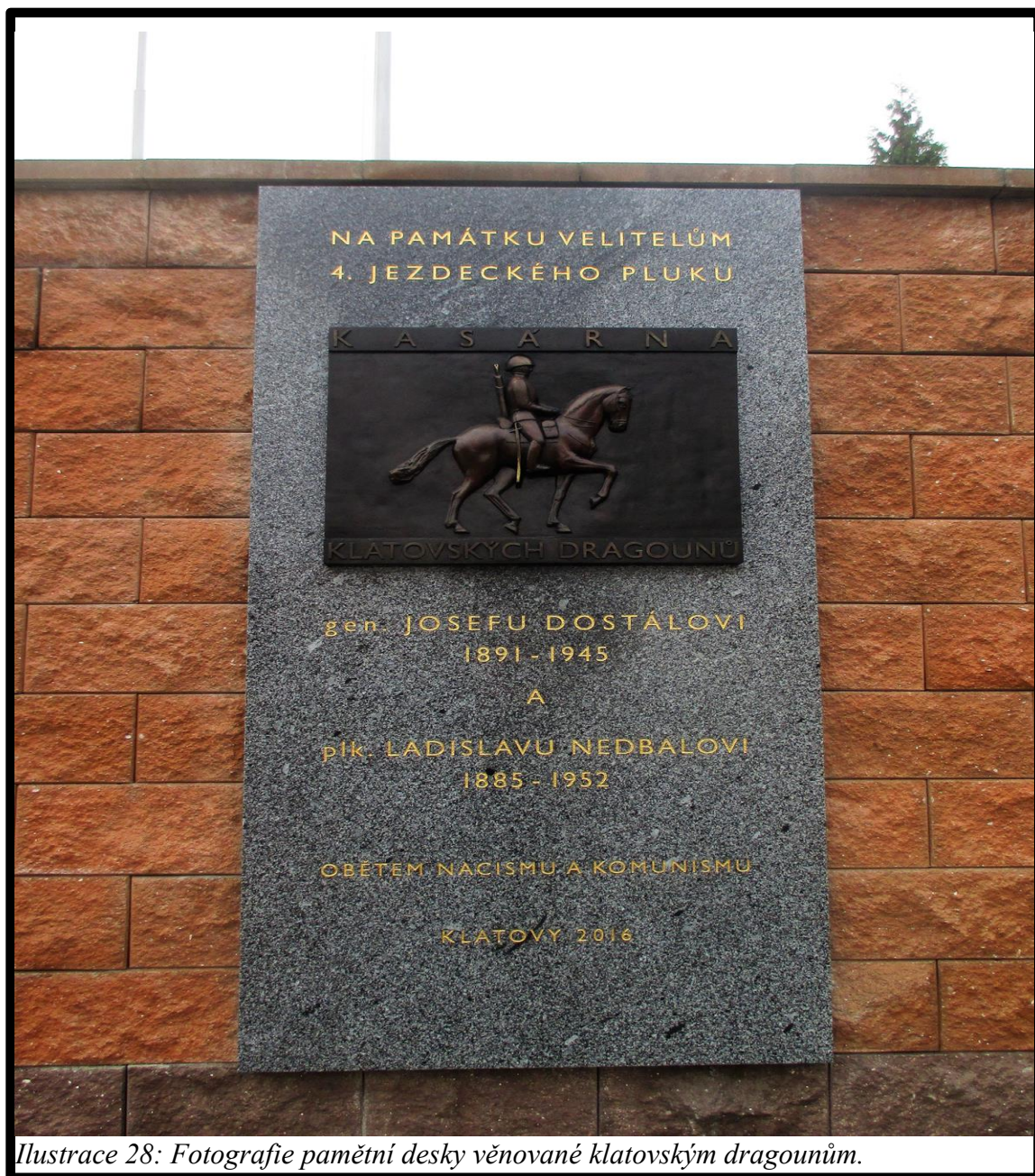
Ilustrace 28: Fotografie pamětní desky věnované klatovským dragounům.