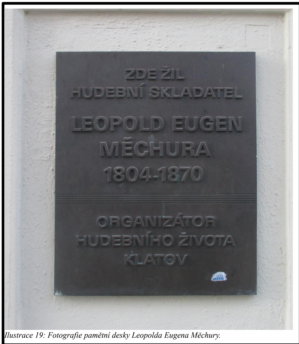
Ilustrace 19: Fotografie pamětní desky Leopolda Eugena Měchury.