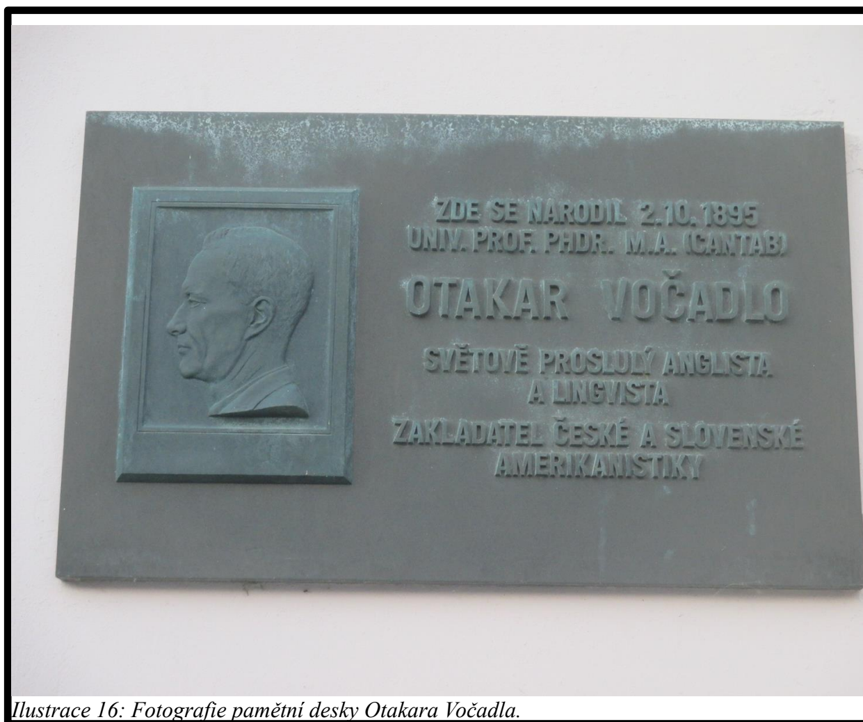
Ilustrace 16: Fotografie pamětní desky Otakara Vočadla.