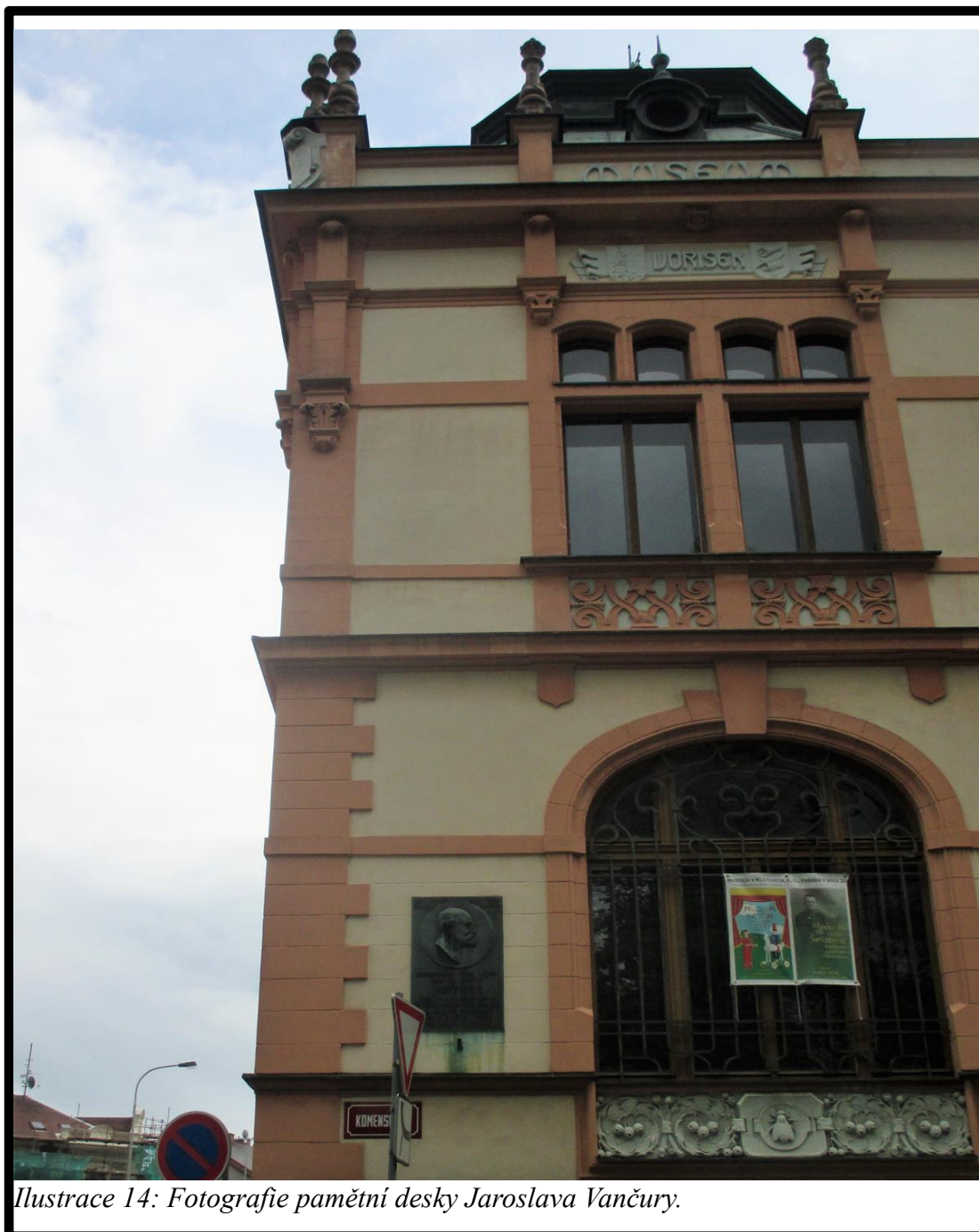
Ilustrace 14: Fotografie pamětní desky Jaroslava Vančury.