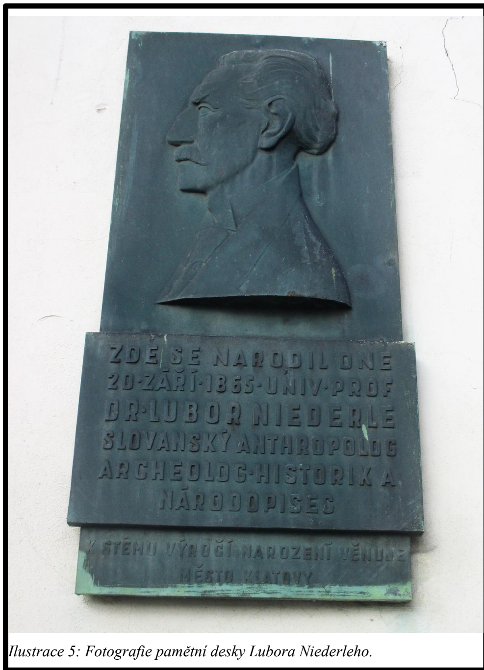
Ilustrace 5: Fotografie pamětní desky Lubora Niederleho.