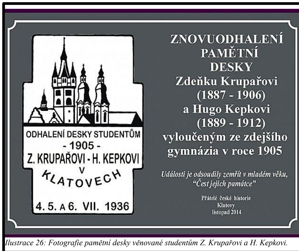
Ilustrace 26: Fotografie pamětní desky věnované studentům Z. Krupařovi a H. Kepkovi.