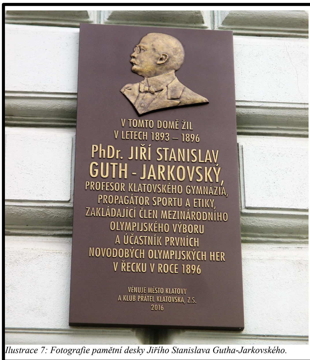
Ilustrace 7: Fotografie pamětní desky Jiřího Stanislava Gutha-Jarkovského.