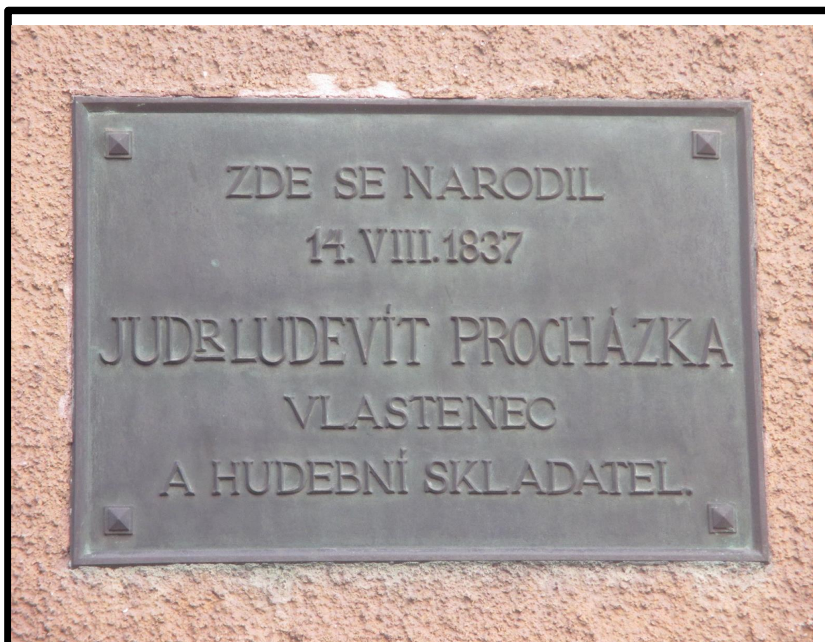
Ilustrace 10: Fotografie pamětní desky Ludevíta Procházky.