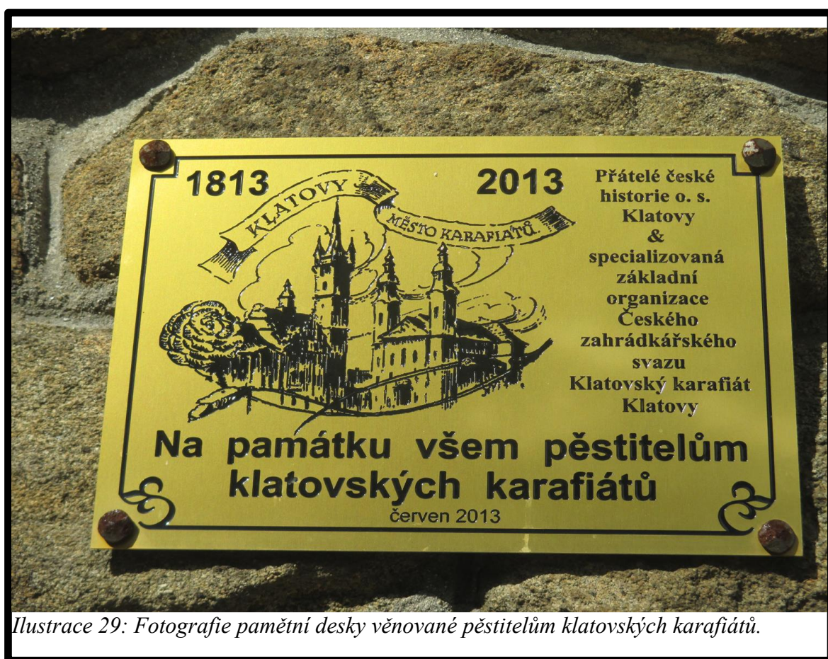
Ilustrace 29: Fotografie pamětní desky věnované pěstitelům klatovských karafiátů.