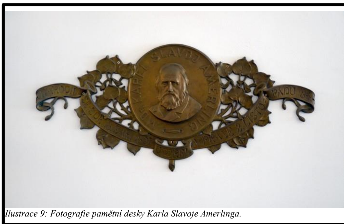
Ilustrace 9: Fotografie pamětní desky Karla Slavoje Amerlinga.