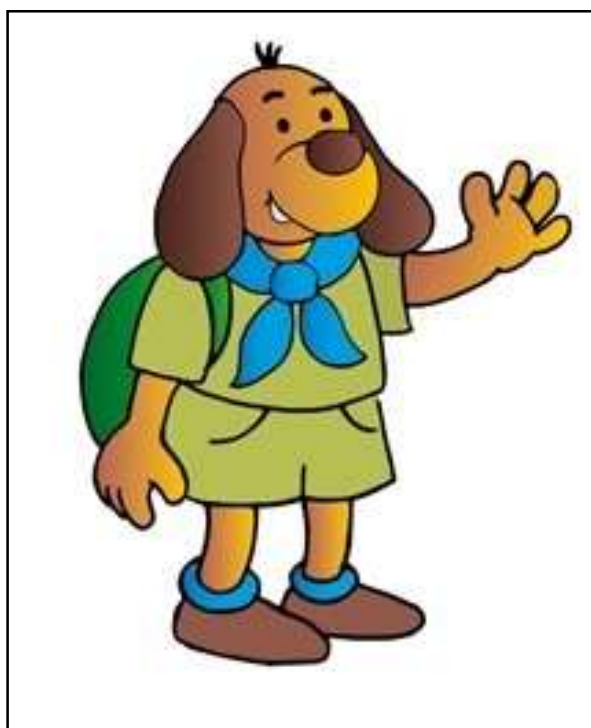
Příloha č. 26 - Současný pionýrský maskot 190