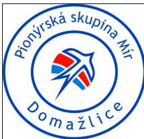
Příloha č. 12 - Znak Pionýrské skupiny Mír Domažlice 176