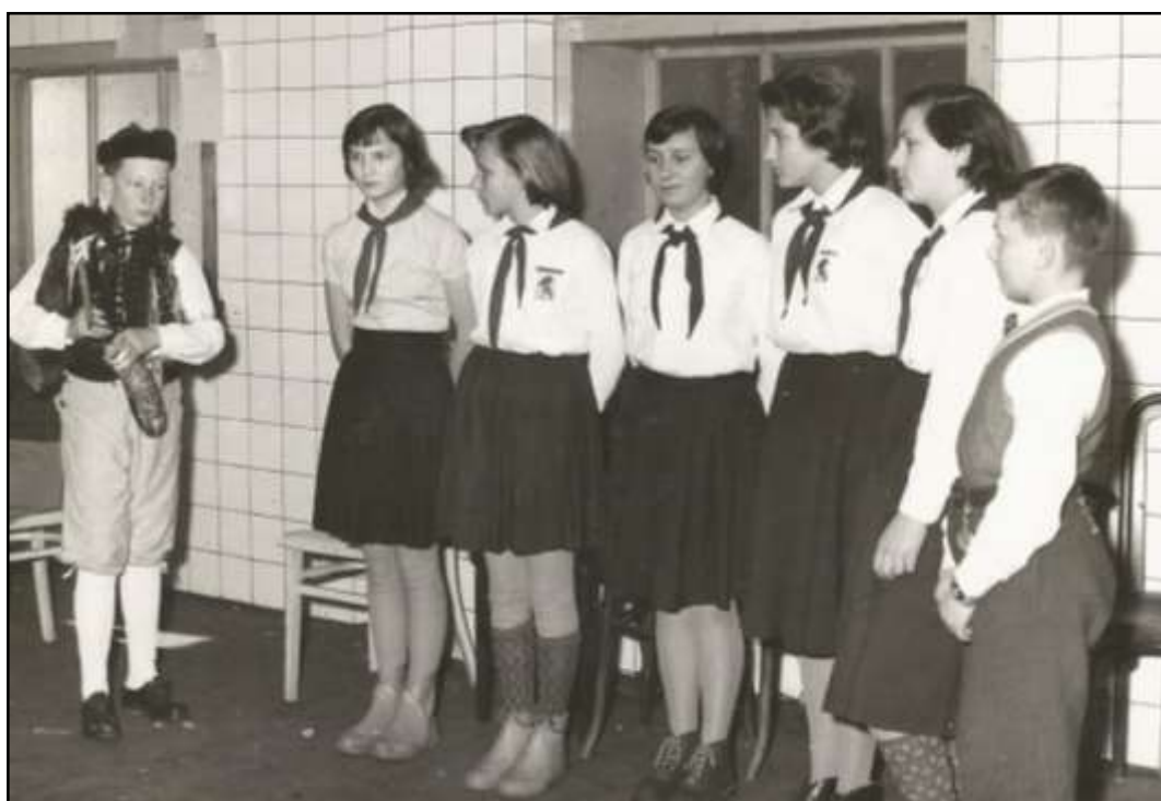
Příloha č. 4 - Propojení chodské tradice a pionýrství 168