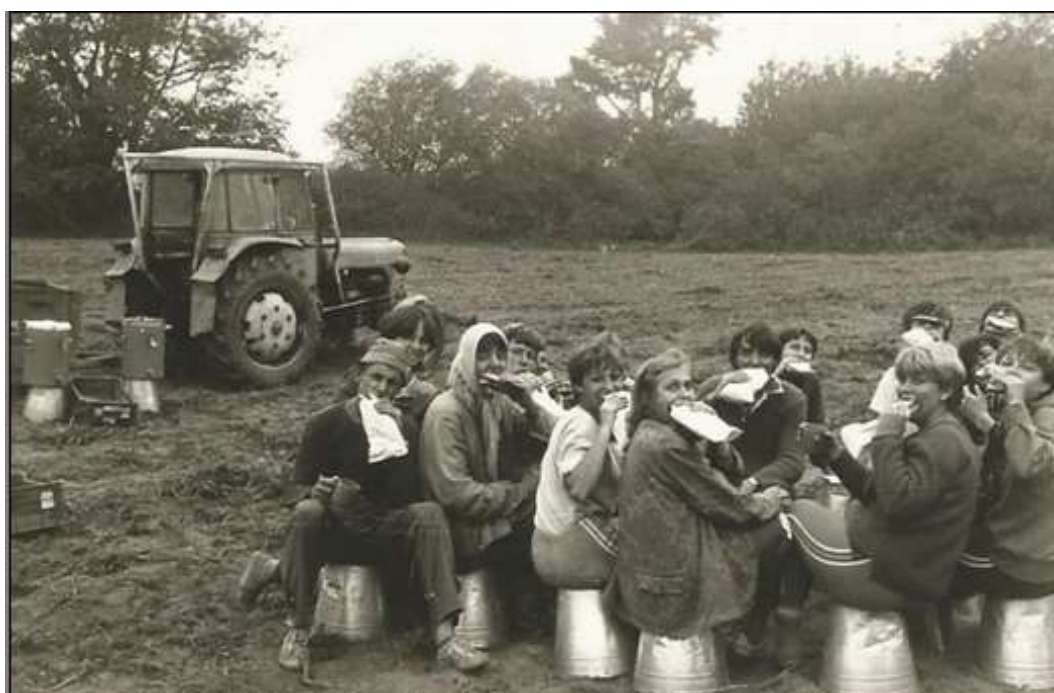
Příloha č. 14 - Bramborová brigáda 178