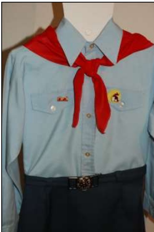
Příloha č. 23 - Pionýrský kroj před rokem 1989 187