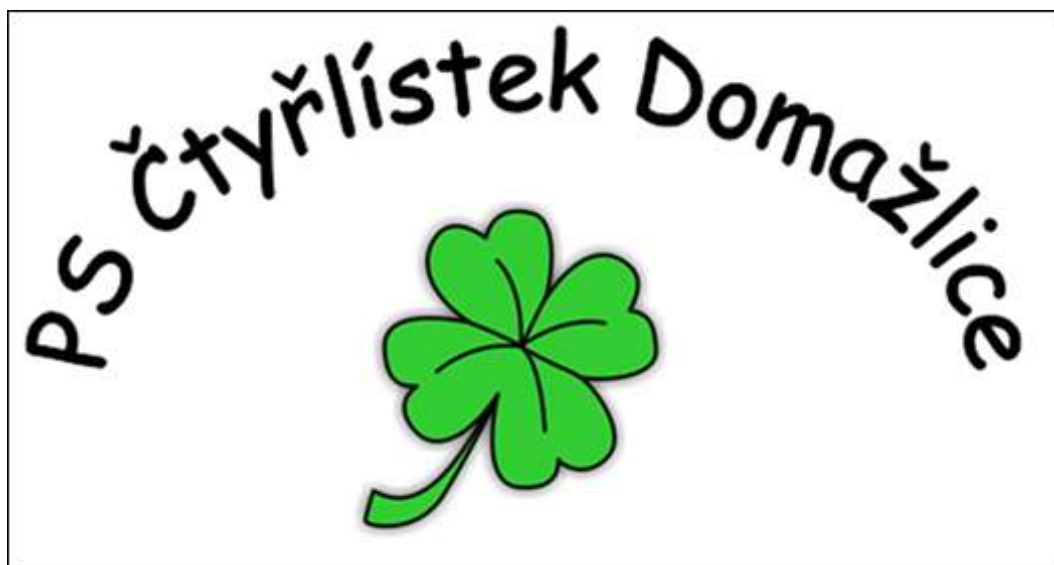
Příloha č. 13 - Znak Pionýrské skupiny Čtyřlístek 177