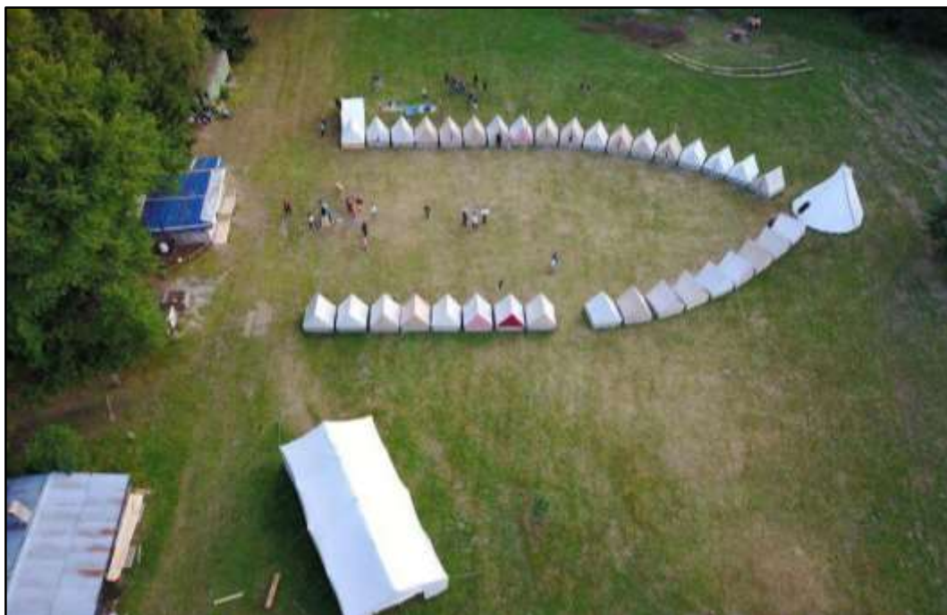
Příloha č. 9 - Táborová základna PS Ptáčata Domažlice nedaleko Přimdy 173