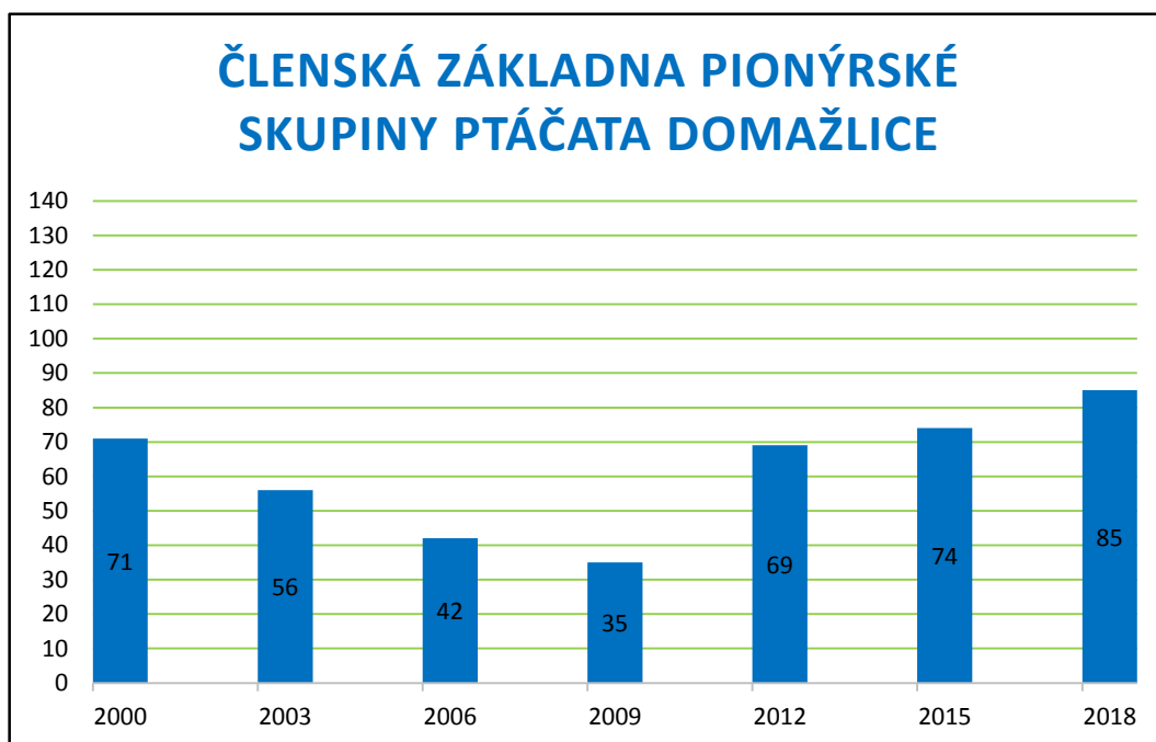
Příloha č. 27 - Členská základna PS Ptáčata Domažlice 191