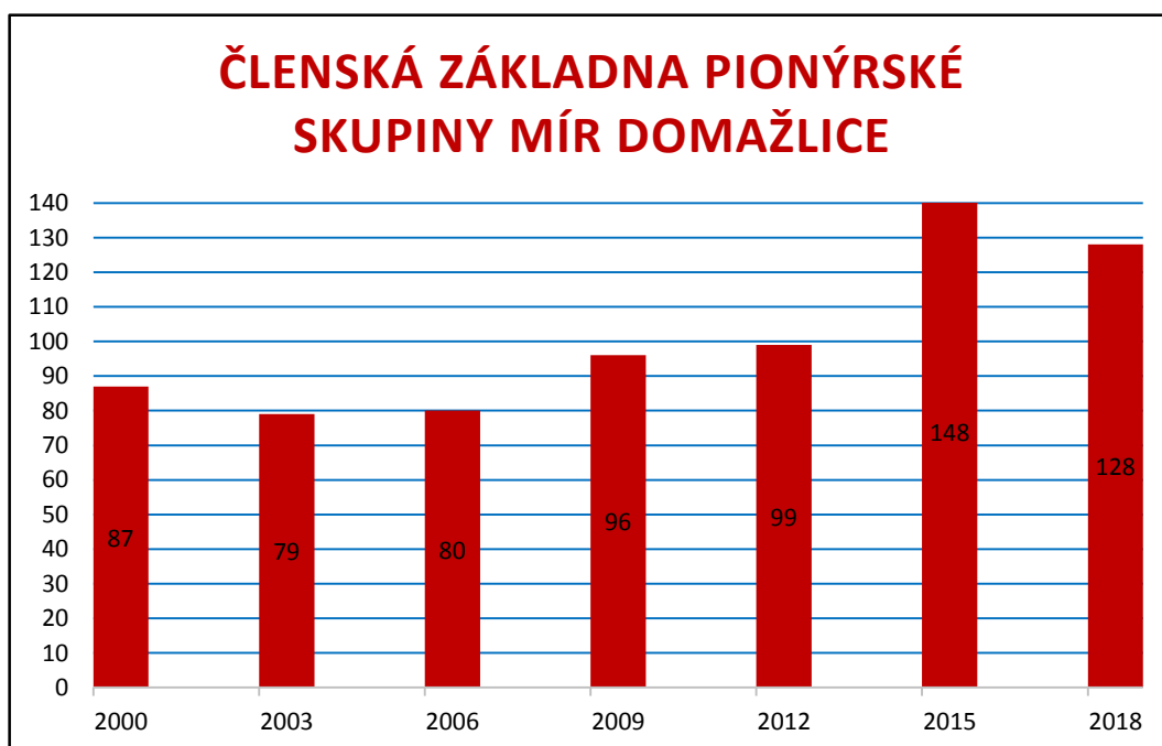
Příloha č. 28 - Členská základna PS Mír Domažlice 192