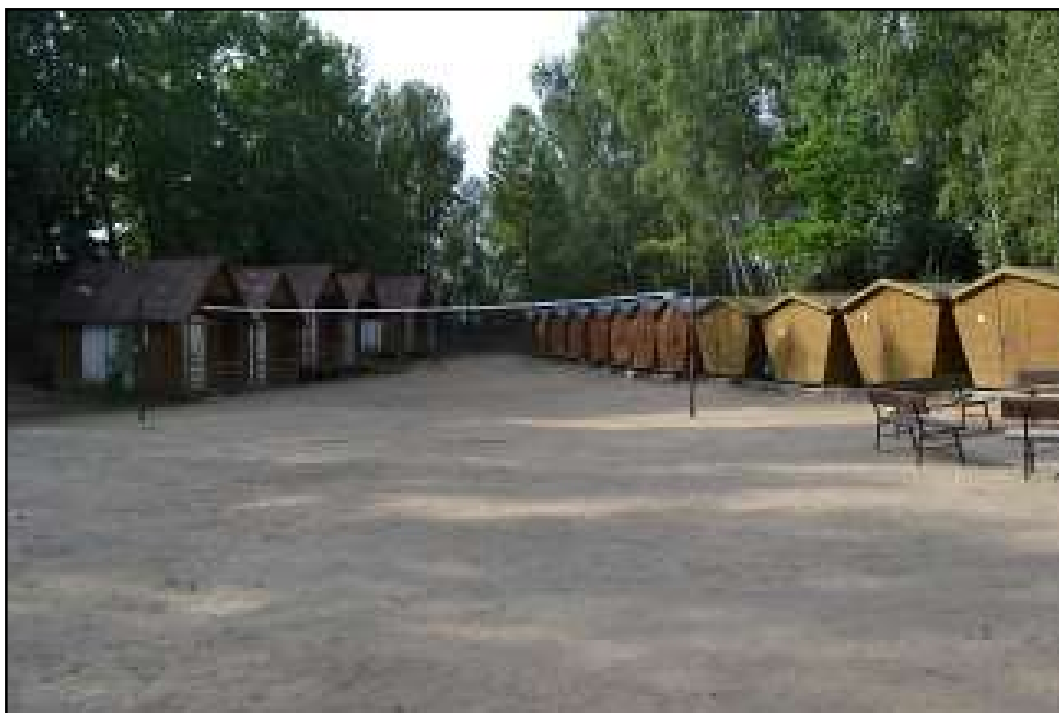
Příloha č. 10 - Táborová základna PS Čtyřlístek a PS Mír Domažlice v Újezdě 174