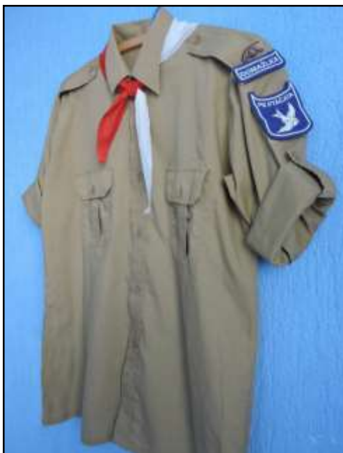
Příloha č. 24 - Současný kroj PS Ptáčata Domažlice 188