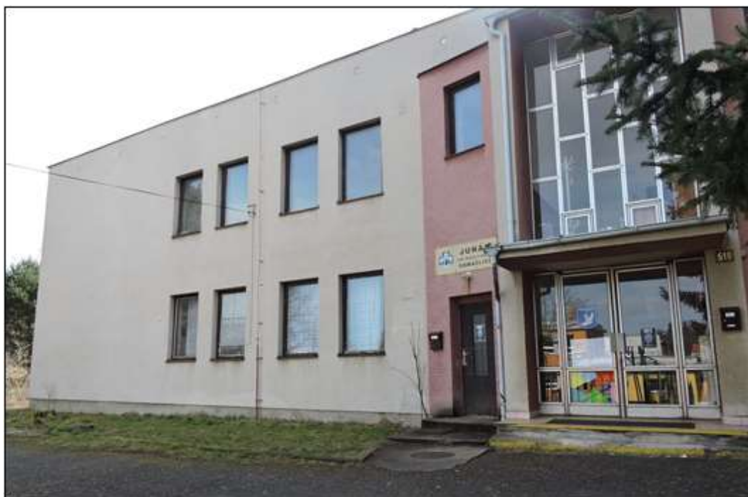
Příloha č. 18 - Současná klubovna PS Ptáčata Domažlice 182