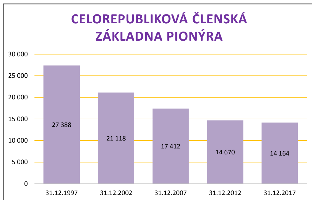
Příloha č. 31 - Celorepubliková členská základna Pionýra 195