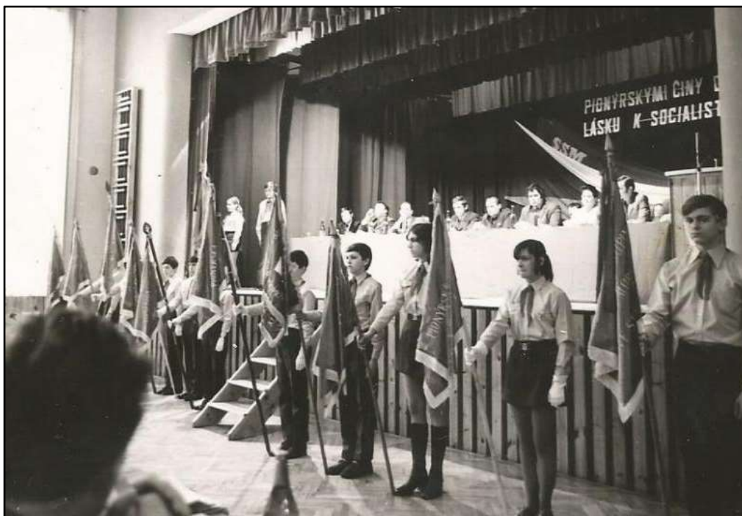
Příloha č. 5 - Okresní konference pionýrských pracovníků, Mrákov 2. 2. 1974 169