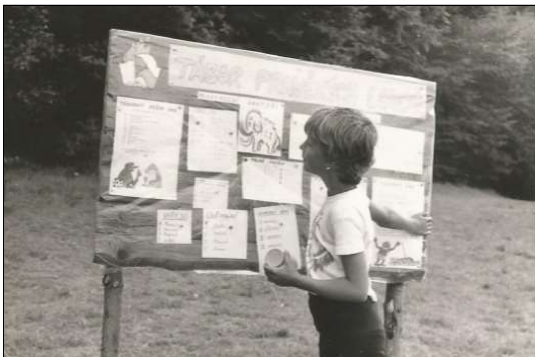
Příloha č. 6 - Táborová nástěnka s celotáborovou motivací pravěku 170