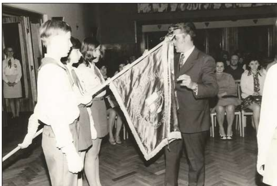
Příloha č. 16 – Praporečník na skupinovém shromáždění PS Ptáčata, Domažlice 23. 4. 1974 180