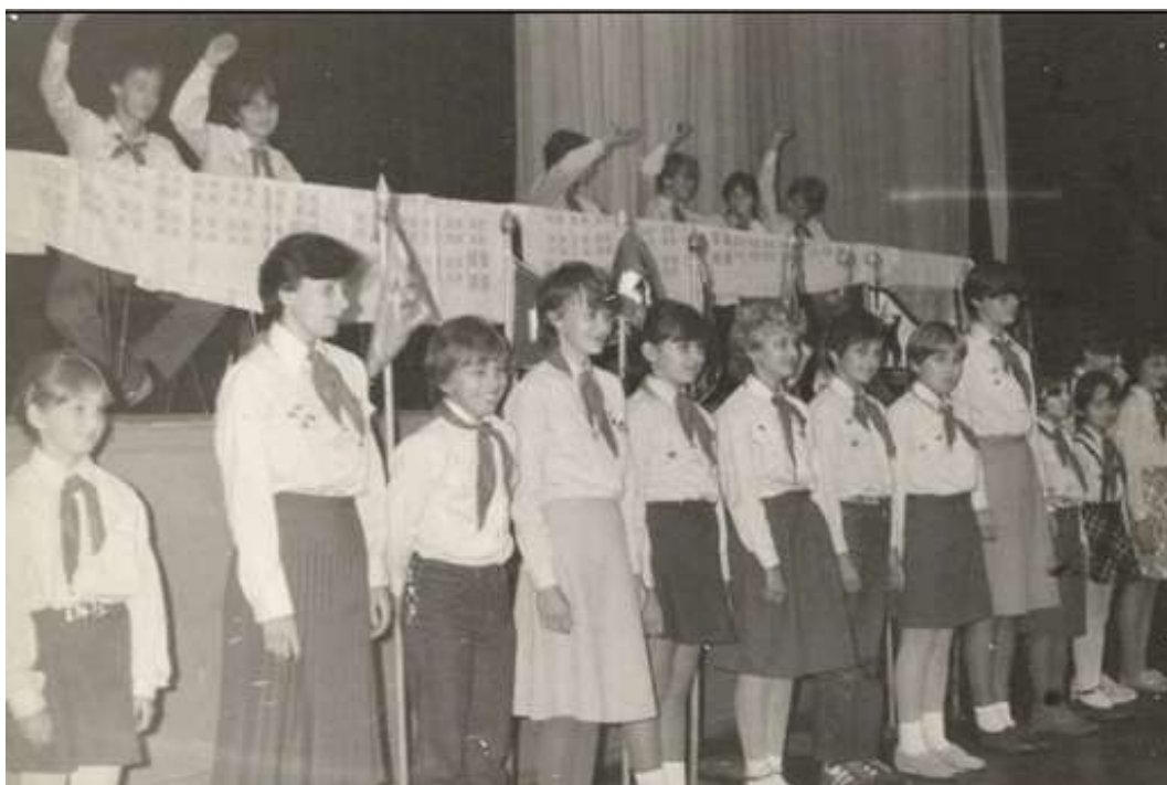
Příloha č. 15 - Skupinové shromáždění PS Ptáčata, Domažlice 23. 4. 1974 179