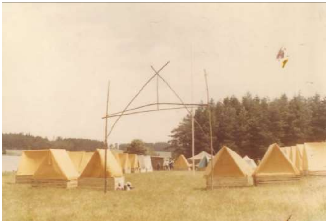
Příloha č. 7 - Tábořiště u zaniklé obce Skláře, 1973 171