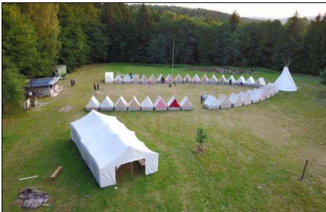
Příloha č. 8 - Táborová základna PS Ptáčata Domažlice nedaleko Přimdy 172