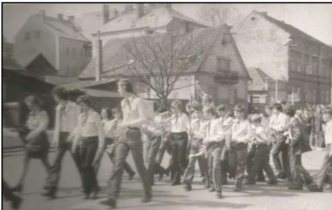
Příloha č. 3 - Prvomájový průvod 167