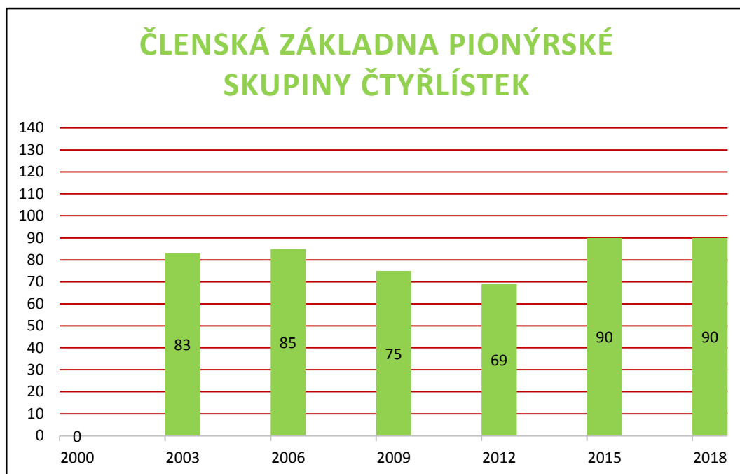
Příloha č. 29 - Členská základna PS Čtyřlístek 193