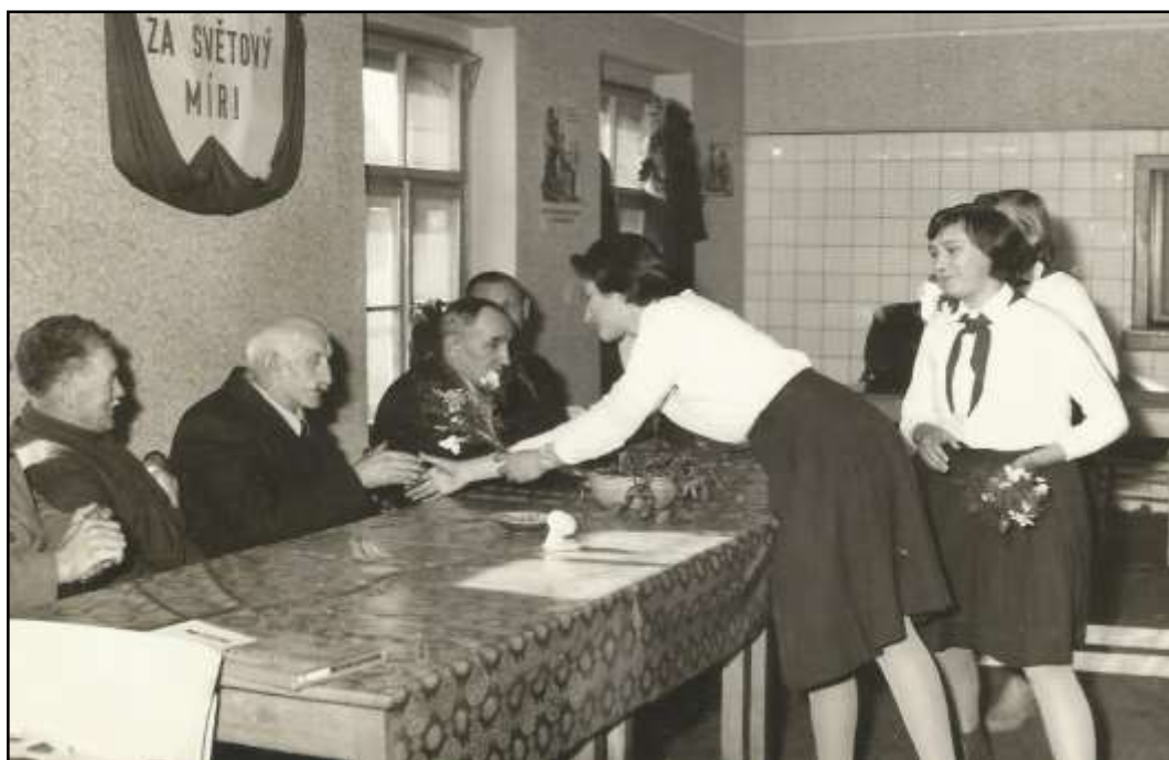
Příloha č. 2 - Kulturní činnost 166