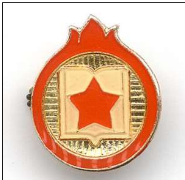
Příloha č. 21 - Znak jisker před rokem 1989 185