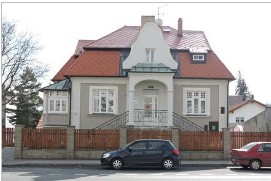
Příloha č. 17 - Vila Mařenka, klubovna PS Ptáčata v průběhu 80. a 90. let 181