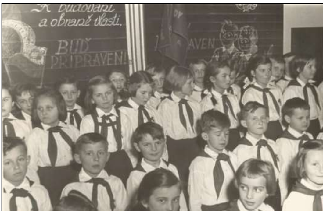
Příloha č. 1 - Slavnostní slib 165