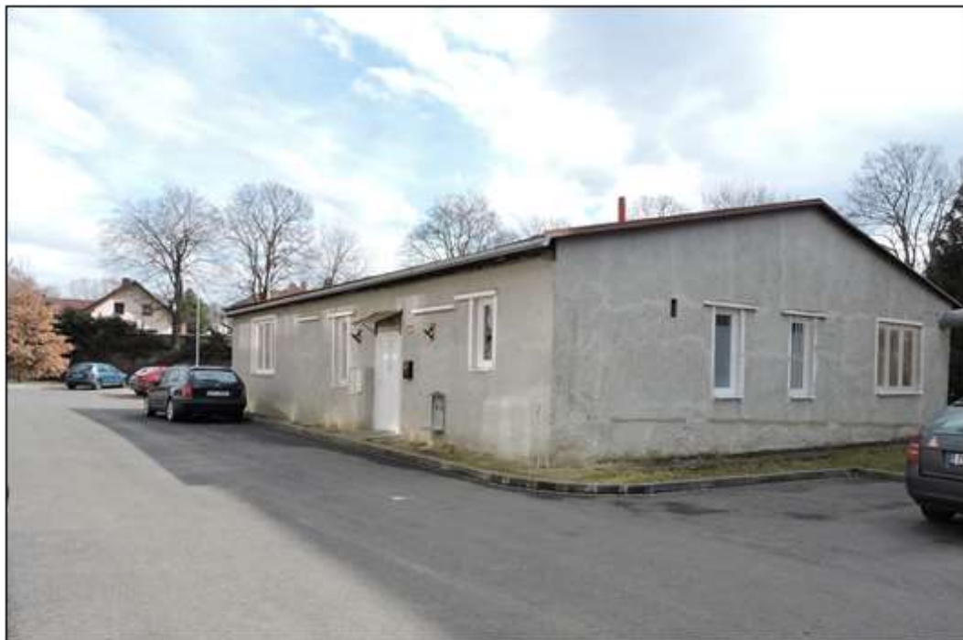
Příloha č. 19 - „Dřevák“, klubovna PS Mír Domažlice a PS Čtyřlístek 183