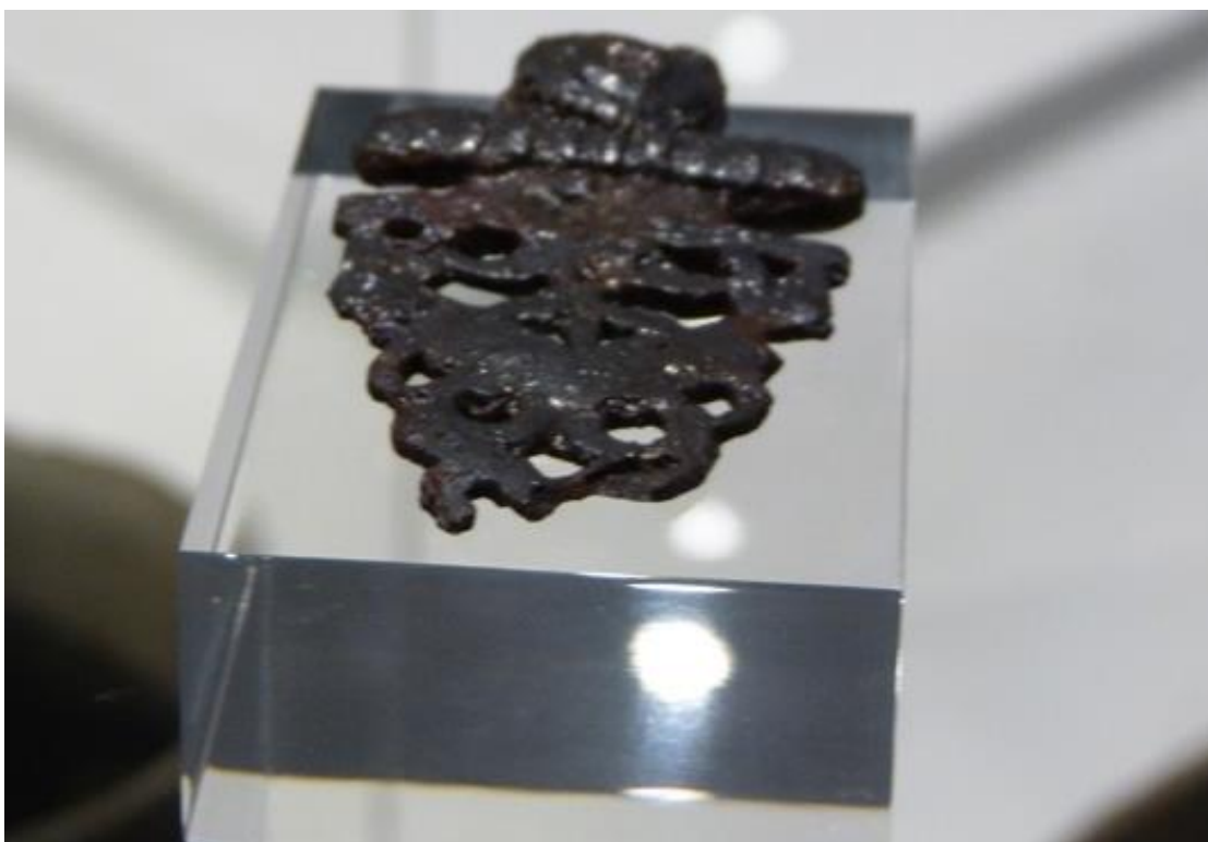
Obr. č. 19 - Prolamovaná železná zápona, ZČM Plzeň (2017)