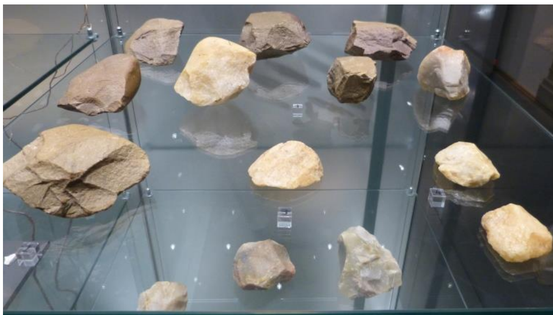
Obr. č. 18 - Valounová industrie, ZČM Plzeň