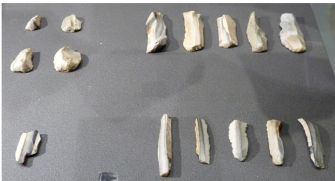
Obr. č. 4 - Štípaná kamenná industrie, ZČM Plzeň (2017)