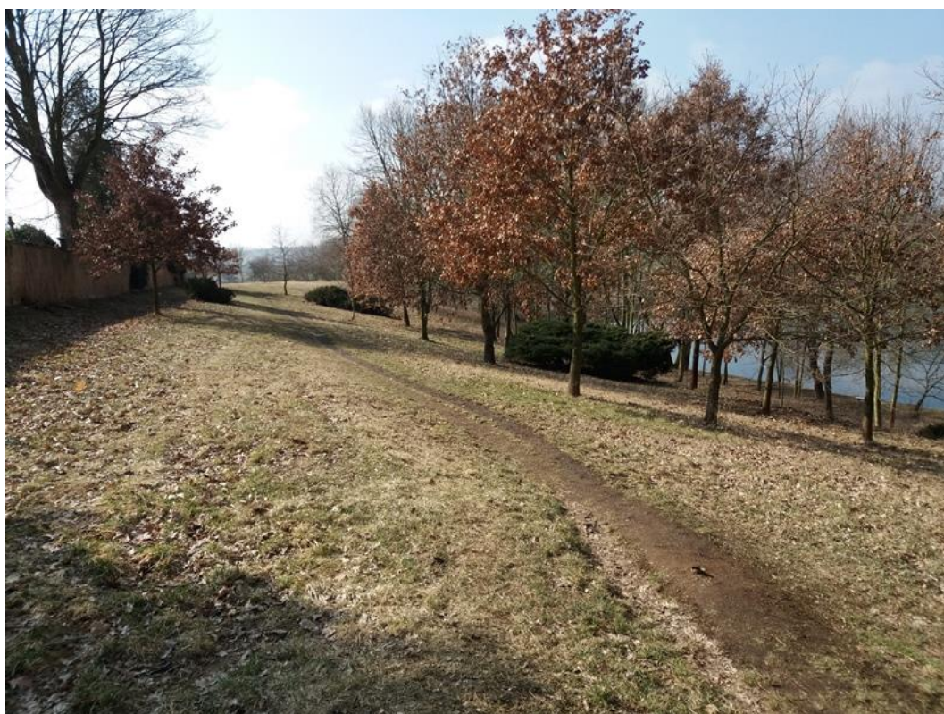
Obr. č. 21 - Město Touškov, lokalita „U Židovského hřbitova“ (2018)