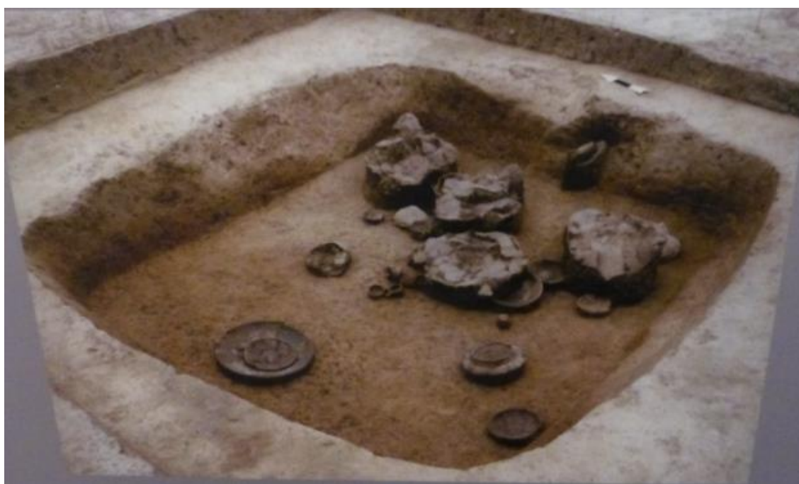
Obr. č. 14 - Nálezy uvnitř halštatského hrobu, informační panel ZČM Plzeň, foto autor (2017)