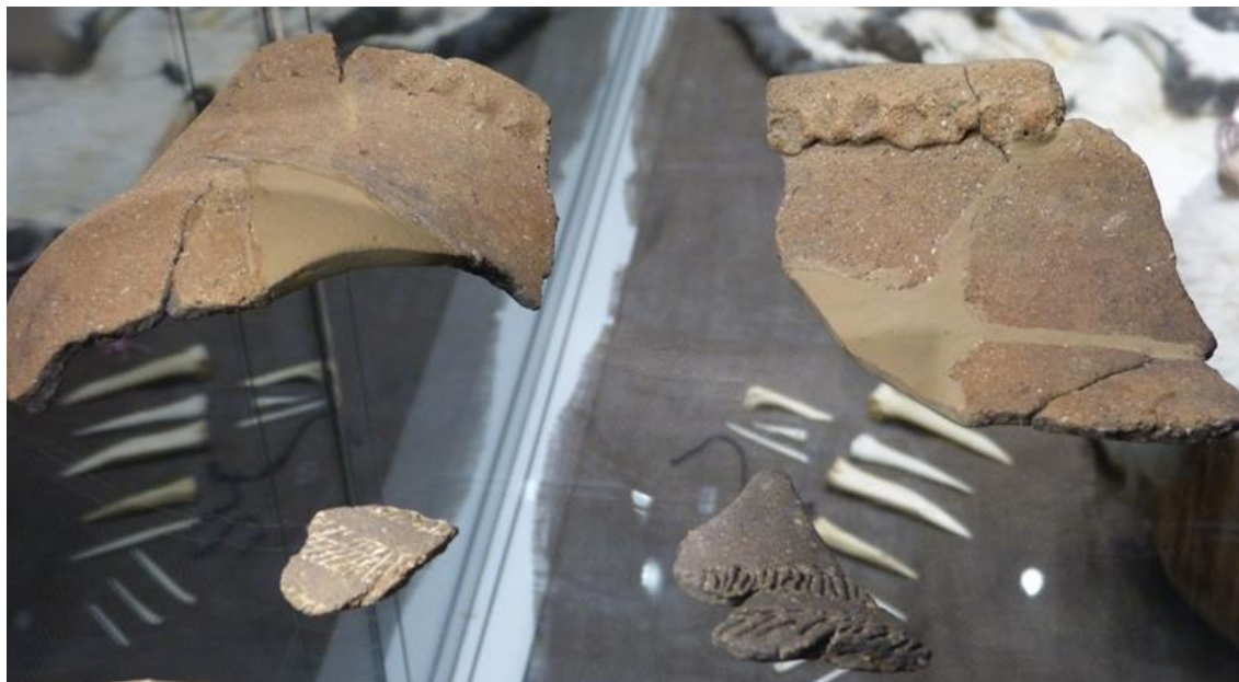
Obr. č. 11 - Zlomky nádob s románskou lisénou, ZČM Plzeň, foto autor (2017)