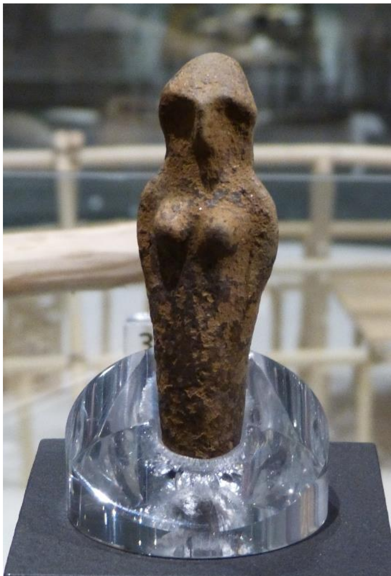
Obr. č. 2 - Vochovská venuše, ZČM Plzeň (2017)