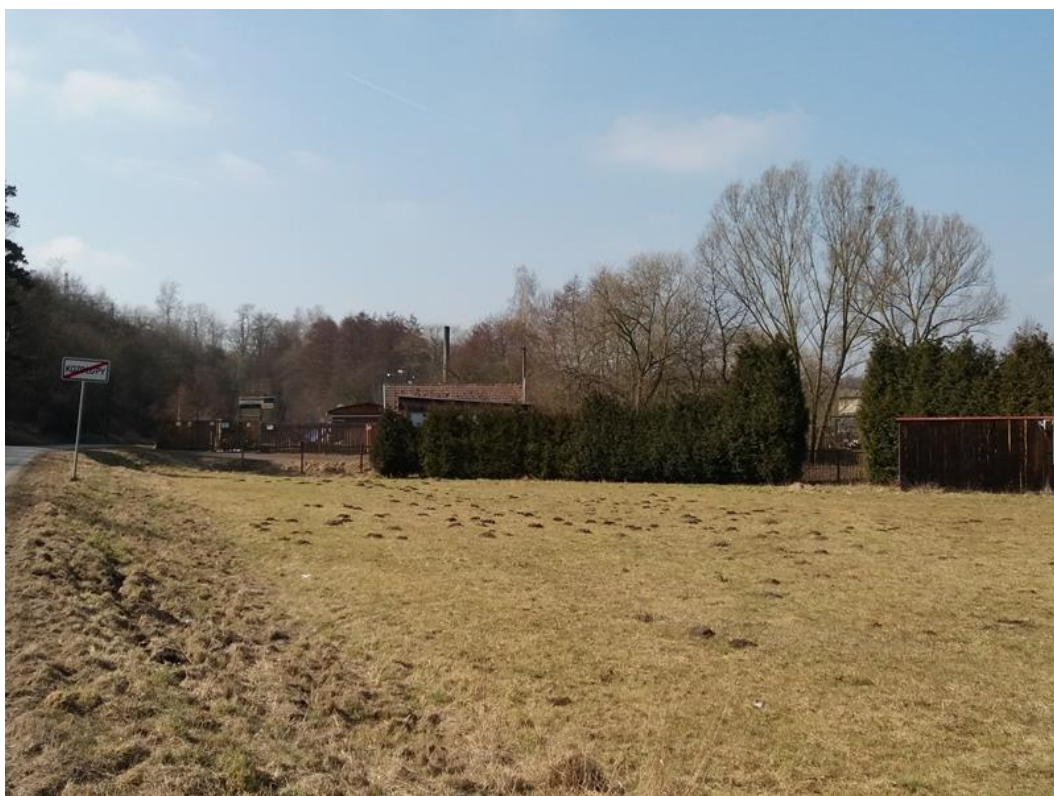
Obr. č. 15 - Kozolupy - „kozolupská pila“ (2018)