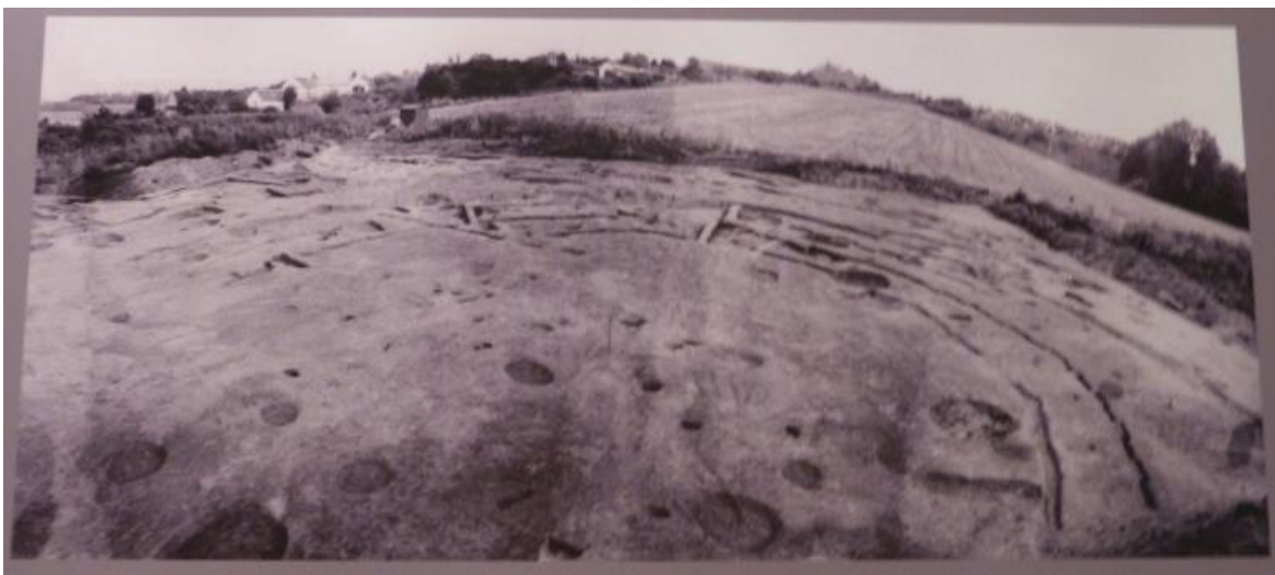
Obr. č. 7 - Pohled na rondel, informační panel ZČM Plzeň (2017)