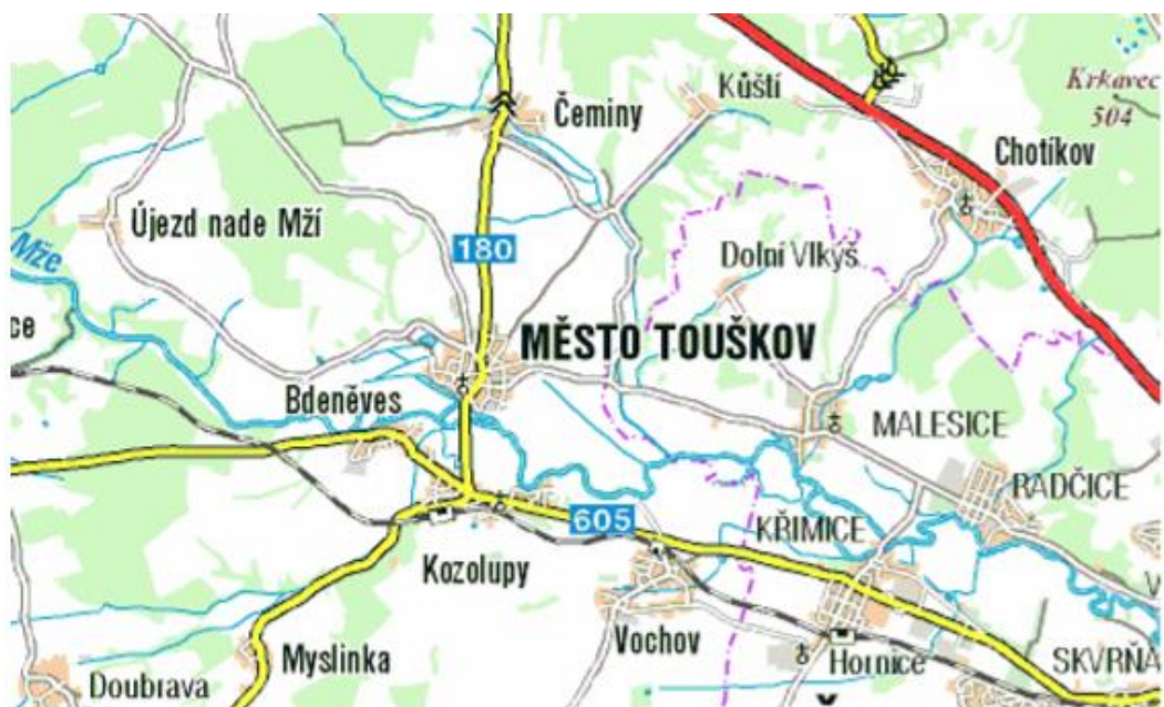
Obr. č. 1 - Mikroregion Touškovsko. Dostupné z URL: < http://docplayer.cz/1146504-Mikroregion-touskovsko.html > [cit. 2018-02-24].