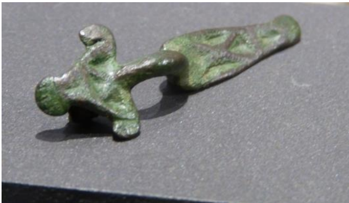
Obr. č. 9 - Bronzová spona z počátku doby stěhování národů, ZČM Plzeň, foto autor (2017)