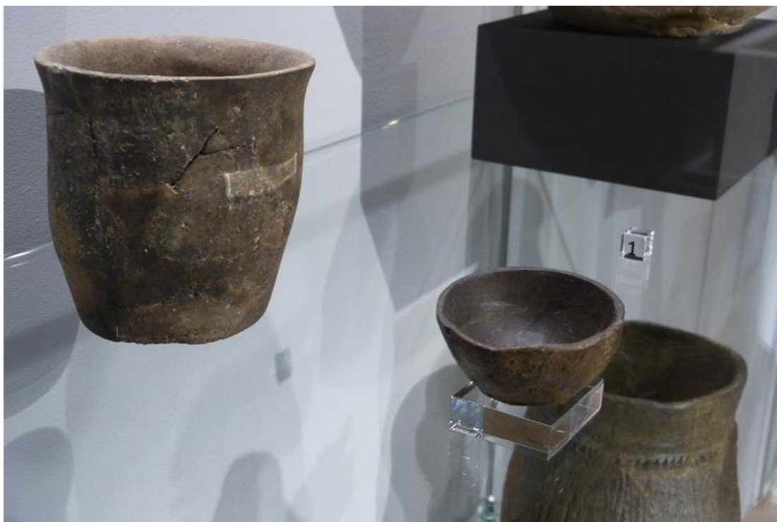
Obr. č. 20 - Nádoby chamské kultury, ZČM Plzeň, foto autor (2017)