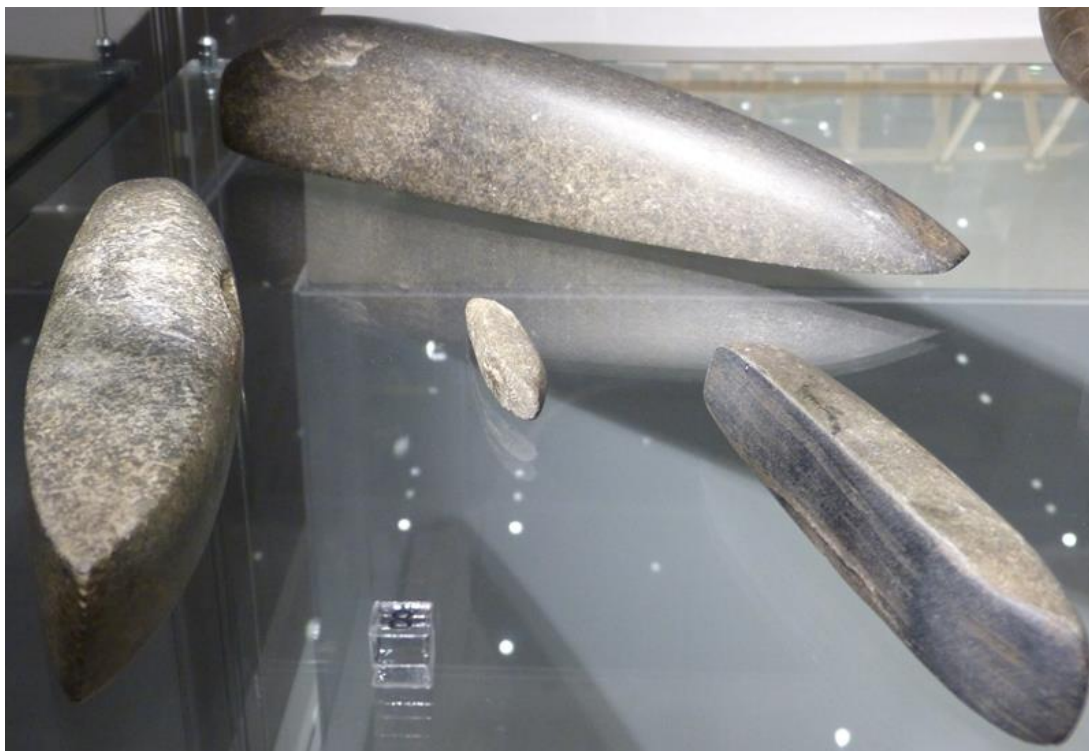
Obr. č. 3 - Broušené kamenné kopytovité klíny, ZČM Plzeň, foto autor (2017)