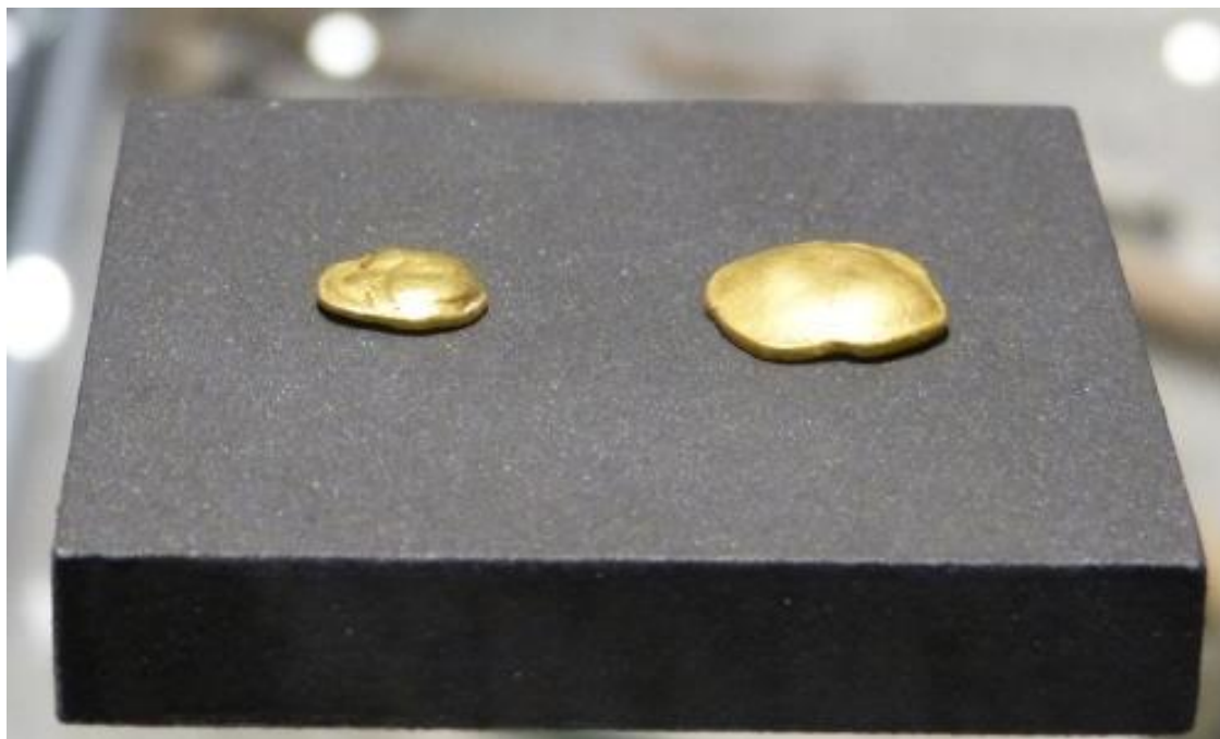
Obr. č. 17 - Keltské zlaté mince, ZČM Plzeň (2017)