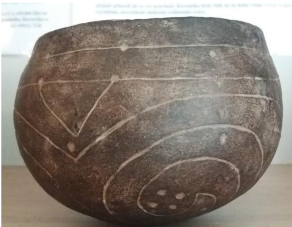
Obr. č. 6 - Miska, kultura s lineární keramikou, ZČM Plzeň, foto autor (2017)