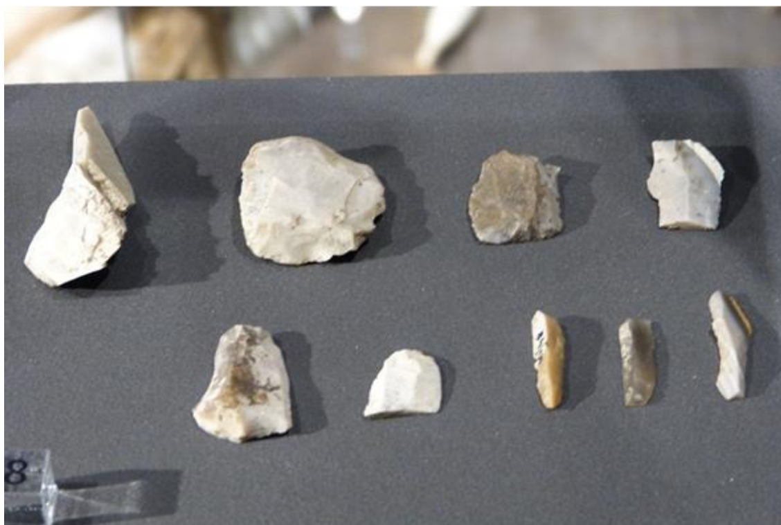
Obr. č. 13 - Štípaná industrie, ZČM Plzeň (2017)