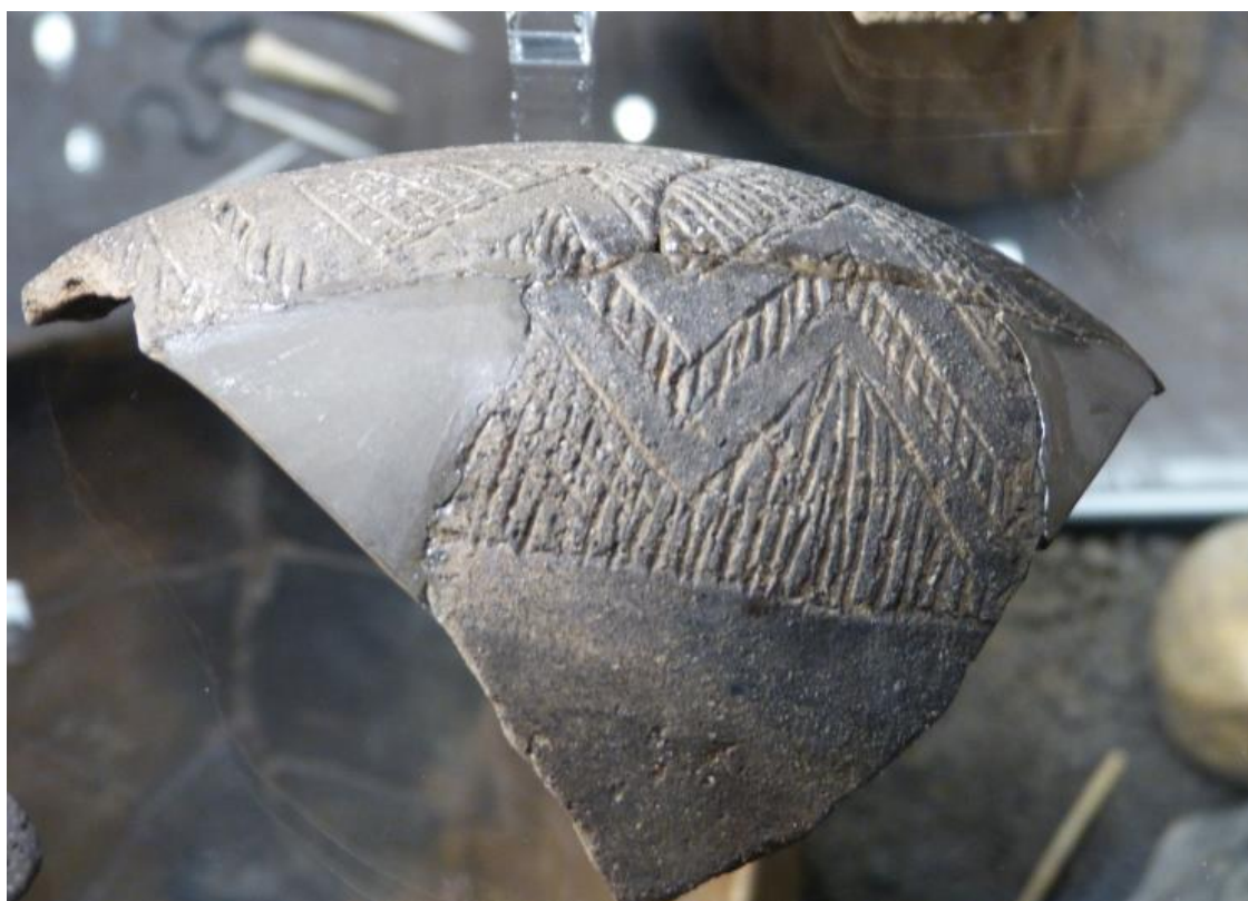
Obr. č. 12 - Keramický zlomek ze schussenriedského sídliště, ZČM Plzeň, foto autor (2017)