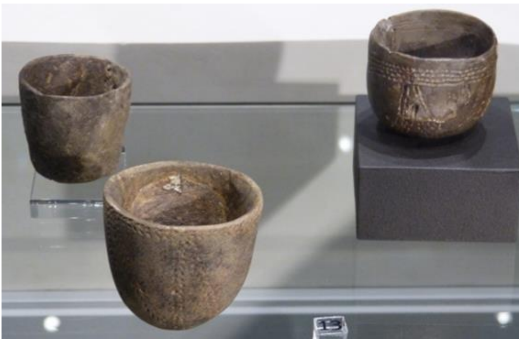
Obr. č. 5 - Miniaturní nádoby zdobené vpichy, ZČM Plzeň, foto autor (2017)