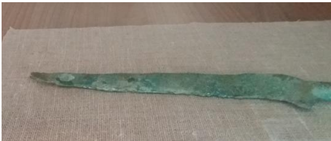
Obr. č. 16 - Bronzový nůž, Obecní muzeum Kozolupy, foto autor (2017)