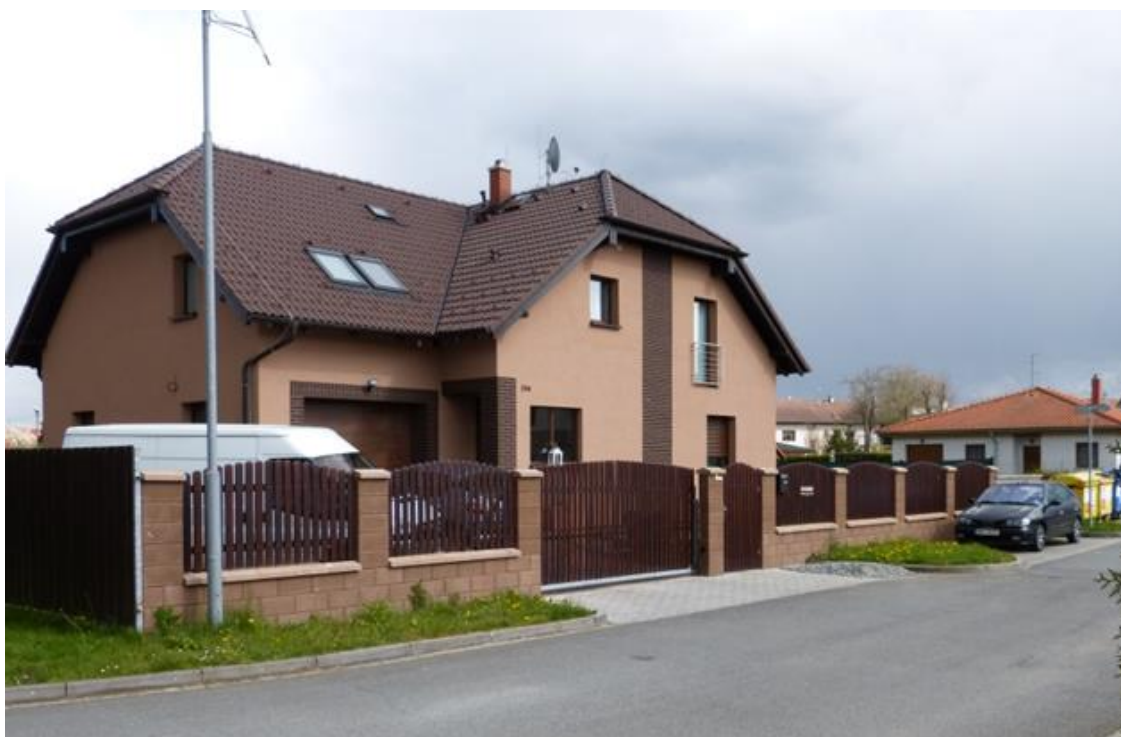
Obr. č. 10 - Bdeněves, lokalita „Za Školou“, foto autor (2017)