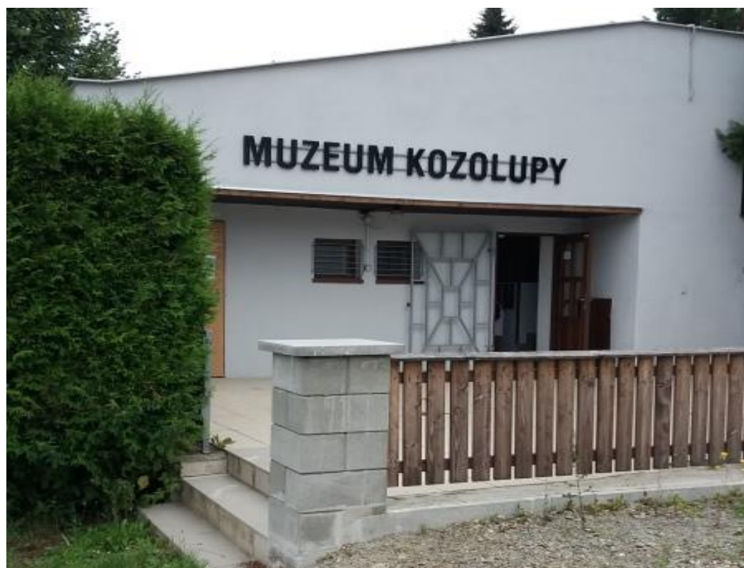
Obr. č. 22 – Muzeum Kozolupy, foto autor (2017)