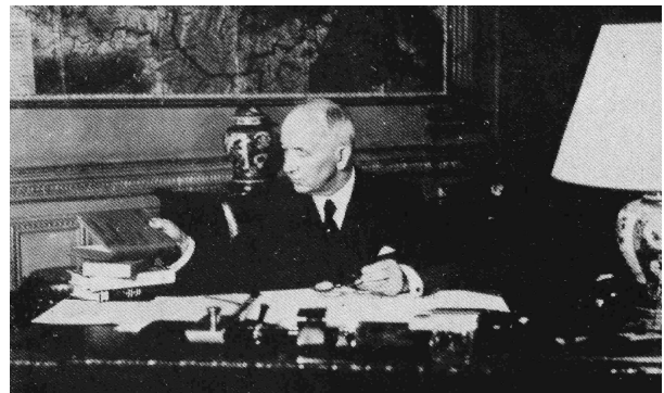
Vlevo nahoře: Zleva: gen. Janoušek, gen. Viest, prezident Beneš, gen. Ingr Vpravo nahoře: Prezident Beneš s exilovou vládou v Londýně Vlevo uprostřed: Prezident Beneš podepisuje dekrety Vpravo uprostřed: Beneš při svém projevu v Kongresu USA Vlevo dole: Prezident Beneš podepisuje dekrety Vpravo dole: Prezident Beneš při práci v londýnské kanceláři