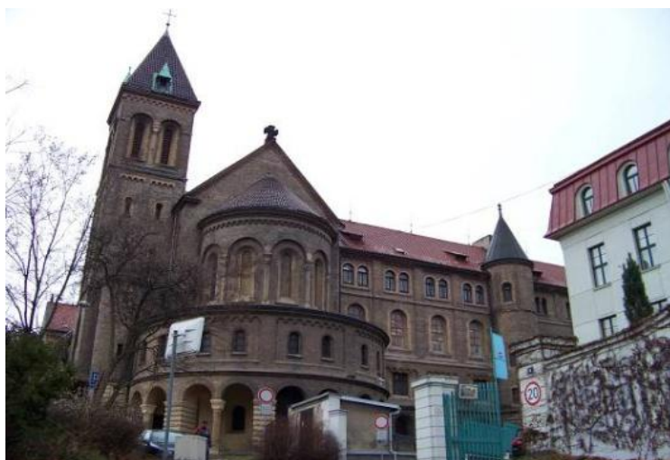
Obrázek 2 Kostel sv. Gabriela

Bazilika sv. Jiří. In: Wikipedie [online]. [cit. 2017-12-05]. Dostupné z: https://cs.wikipedia.org/wiki/Bazilika_svat%C3%A9ho_Ji%C5%99%C3%AD#/media/File:Bazilika_Svat%C3%A9ho_Ji%C5%99%C3%AD-Prague.JPG .