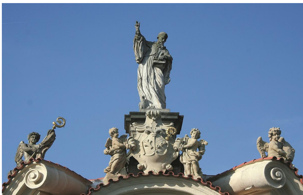
Obrázek 4 Detail sochy sv. Benedikta na vstupní bráně Břevnovského kláštera