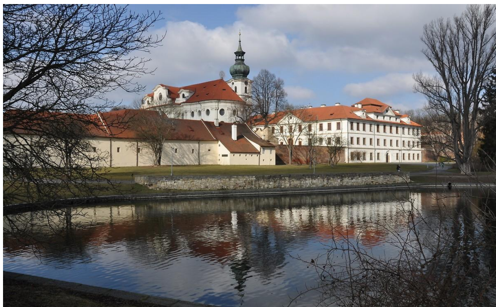
Obrázek 3 Břevnovský klášter

Břevnovský klášter: Břevnovský klášter - exteriéry. Www.brevnov.cz [online]. [cit. 2018-04-06]. Dostupné z: https://www.brevnov.cz/cs/fotogalerie/brevnovsky-klaster-dnes-exteriery#gallery-1