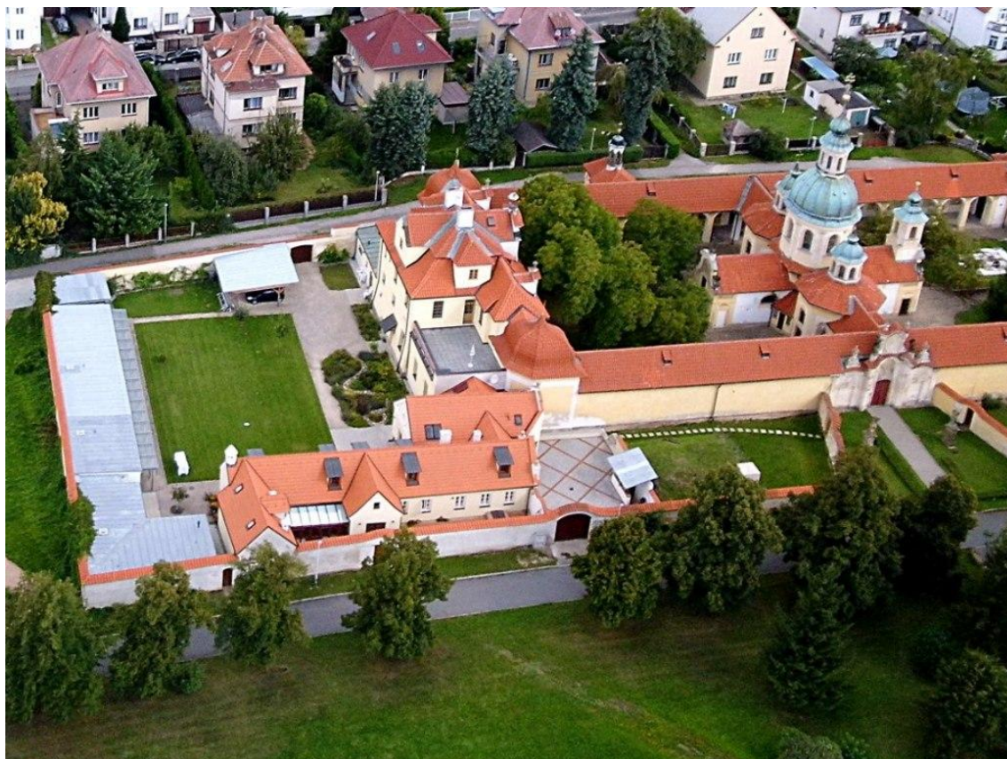
Obrázek 6 Klášter na Bílé Hoře

Komunita VENIO: Klášter na Bílé Hoře. In: Klášter benediktinek [online]. [cit. 2017-12-05]. Dostupné z: http://www.benediktinky.cz/cz/fotogalerie .