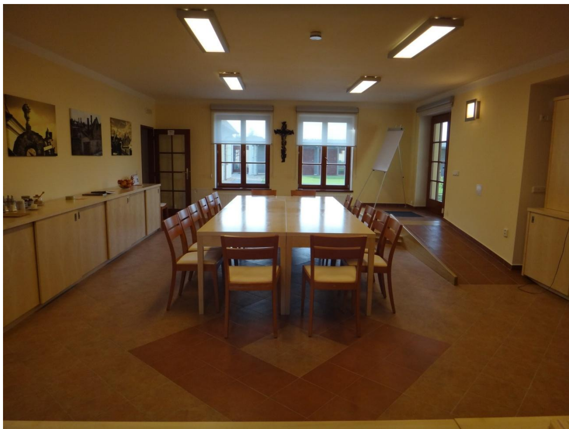
Obrázek 12 Společenská místnost domu pro hosty, klášter na Bílé Hoře

Společenská místnost domu pro hosty, klášter na Bílé Hoře Foto soukromý archiv sestry Anežky Najmanové, Praha 25. března 2018