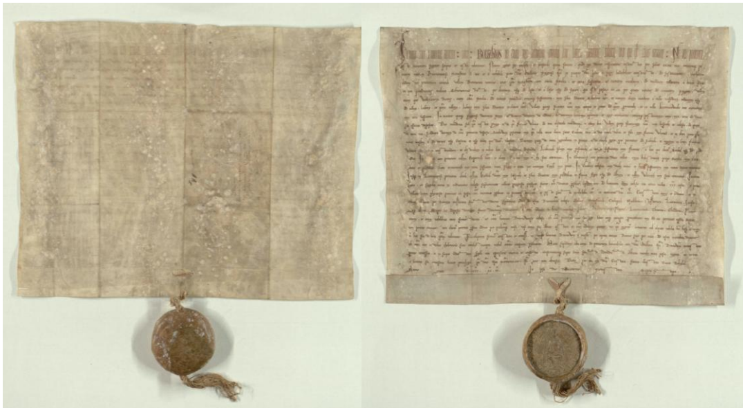
Obrázek 5 Zakládací listina Břevnovského kláštera

Boleslav [II.], kníže český, dává klášteru břevnovskému (Brevnowensi), který založil spolu s biskupem Vojtěchem z popudu papeže Jana [XV.], ves Břevnov, horu Žernovice (Schirnovnice), vsi Veleslavín (Wolezlawin) s lesem Šlachovem (Sclachow) a horou mezi Střešovicemi (Tressowicz) a Dol. Libocí (Lubocz), Dol. Liboc s lesem Malejovem, Ruzyň (Ruzen), 3 dušníky v Kuromrtvicích (Kuromirtwiche), v Praze desátý trh, desátý denár z pokut a 30 dušníků, 2 mlýny pod praž. hradem a 3 jezy, ves Vrané n. Vlt. (Nawranem) s desátkem v Radotíně, Skochovice (Schochowitz), desátek na Poříčí, lán u Vltavy (Wltaue), Libčice (Lubcicich), Vejprnice (Oyppernich), Němčice (Nymcyce), Třebestovice (Trestestowicz), Mračenice (Mracenicich), Kostel v Chcebuzi (Chocebuz), ves Hrdly (Heridel), Starý Mlýnec (Wlencich), poplatky od vládařů v Praze a Plzni na den zasvěcení kostela, desátý týden cla v zemi a desátý trh a peníz z pokut ve Slaném (Nazlanem), St. Plzenci (Plizeni), Litoměřicích (Lutomiricich), Kouřimi (Churimi) a Chrudimi. Vyjímá klášter z pravomoci provinčního soudu, osvobozuje jej od různých povinností, cel aj.