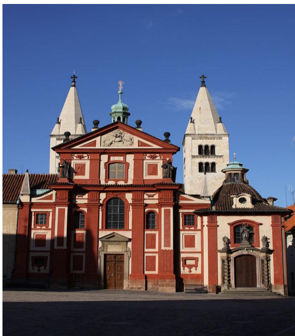
Obrázek 1 Bazilika sv. Jiří