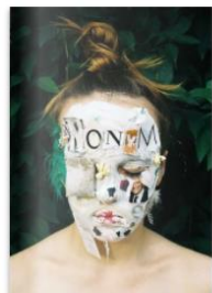
Anonym 002 by Anonym Magazine