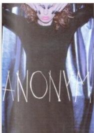
Anonym 009 by Anonym Magazine