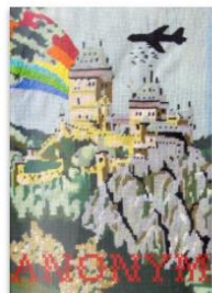
Anonym 005 by Anonym Magazine Published 6 years ago