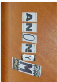
Anonym 004 by Anonym Magazine Published 6 years ago