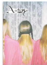
Anonym 007 by Anonym Magazine Published 6 years ago