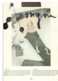
Anonym 008 by Anonym Magazine Published 6 years ago