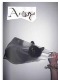
Anonym 001 by Anonym Magazine