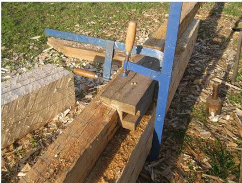
příloha č. 14 Výsrava starých trámů