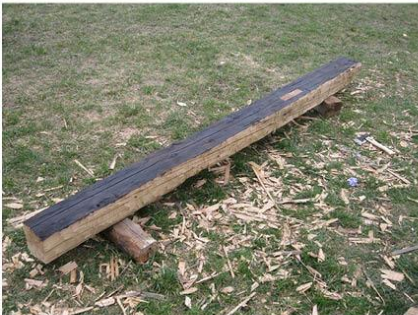
příloha č. 12 Osekaný trám s vloženým prologem