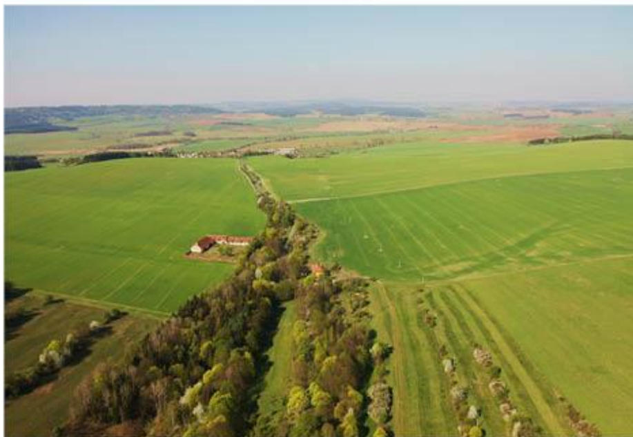
Příloha č.2 Letecký pohled na zaniklou vesnici a statek Vranov