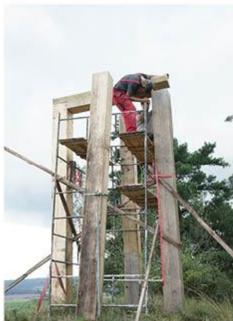
příloha č. 33 Šibeniční vrch, celkový pohled + proces práce, foto: vlastní