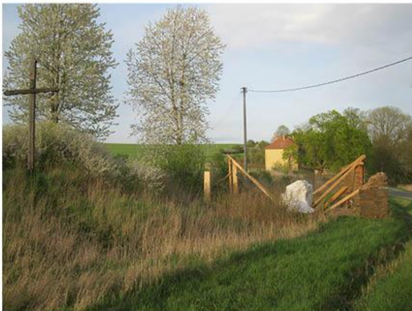
příloha č. 18 Stará stodola, celkový pohled, foto:vlastní