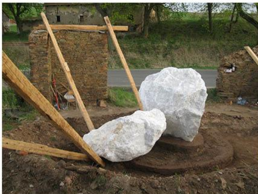
příloha č. 25 Stará stodola, detail, foto:vlastní