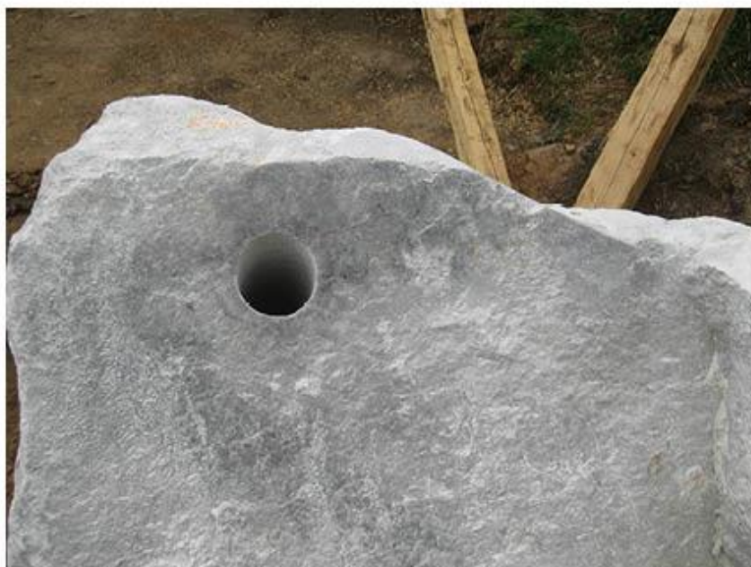
příloha č. 29 Stará stodola, detail opracování kamene, foto:vlastní