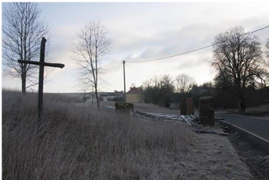
příloha č. 7 Bývalá stodola