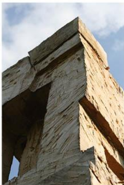
příloha č. 31 Dřevěný pilíř, detaily