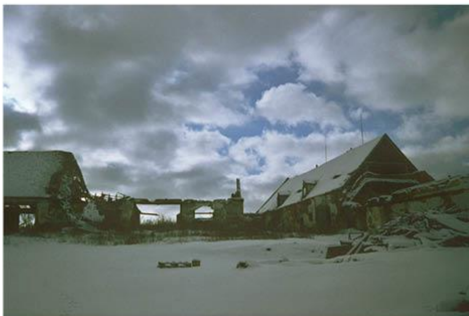
příloha č. 3 Dvůr Vranov