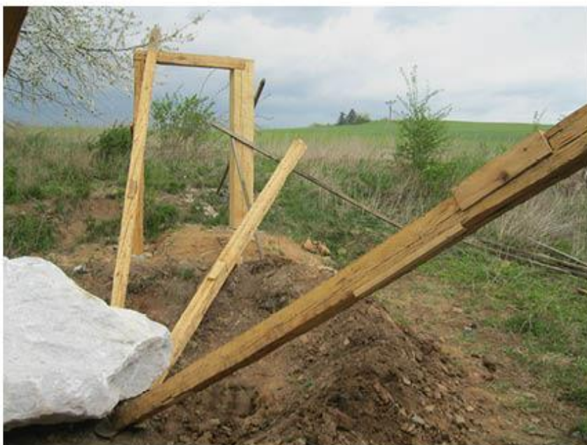
příloha č. 27 Stará stodola, detail