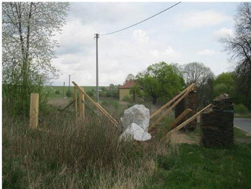
příloha č. 20 Stará stodola, celkový pohled