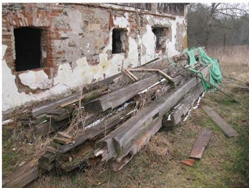
příloha č. 10 Staré trámy před osekáním