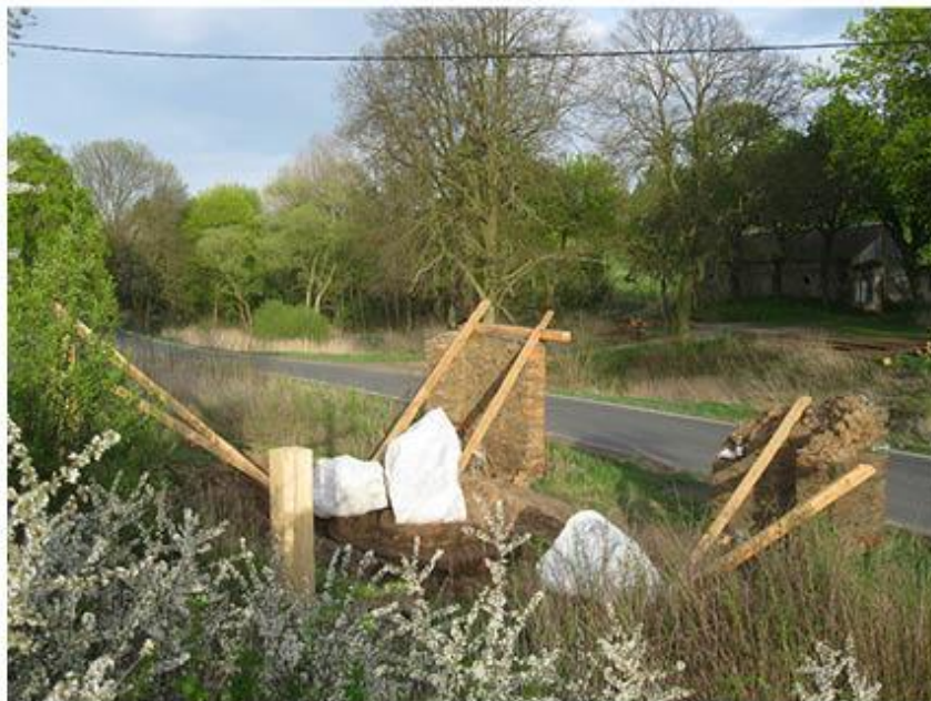
příloha č. 24 Stará stodola, celkový pohled