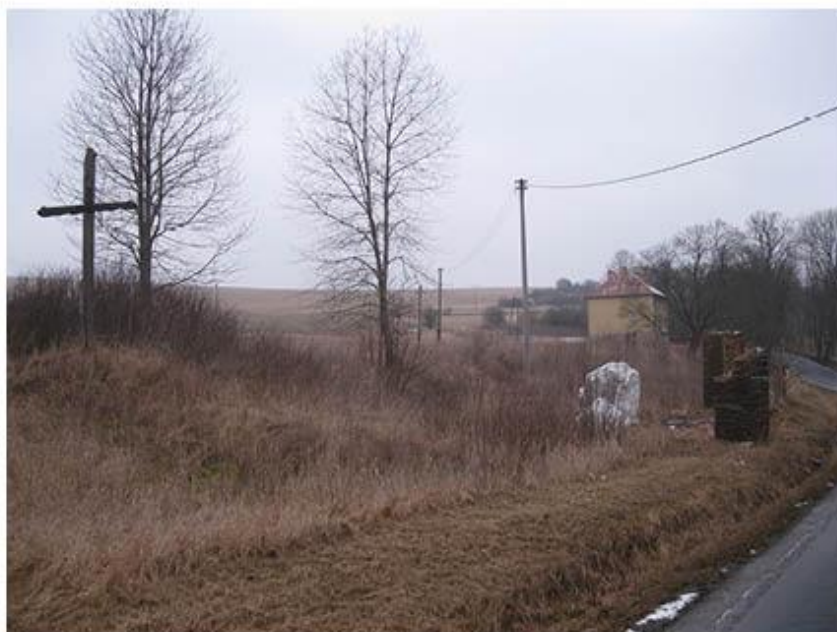
příloha č. 9 Bývalá stodola s usazenými kameny