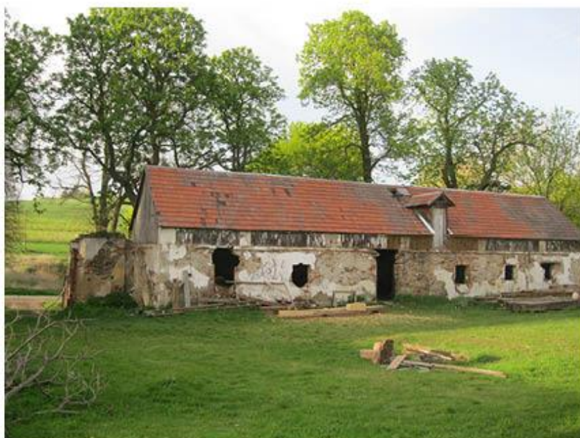
příloha č. 4 Dvůr Vranov