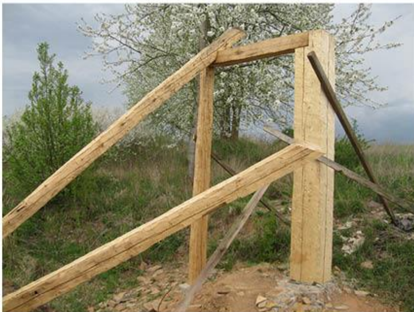
příloha č. 26 Stará stodola, detail, foto:vlastní