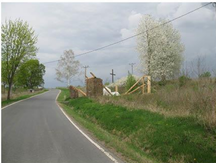
příloha č. 19 Stará stodola, celkový pohled, foto:vlastní