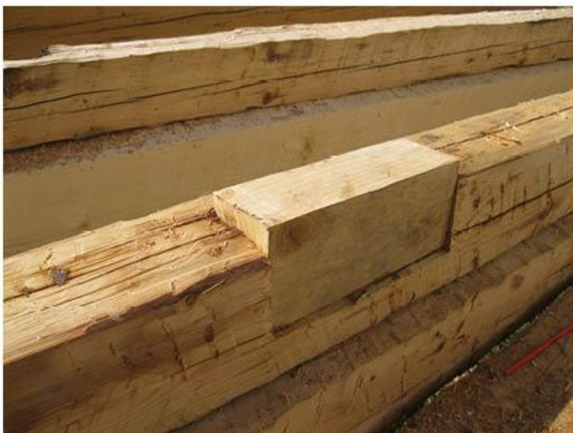
příloha č. 15 Osekané trámy, detail