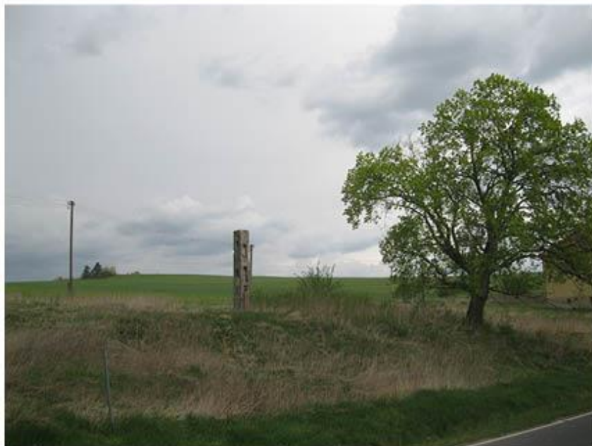
příloha č. 30 Dřevěný pilíř, celkový pohled