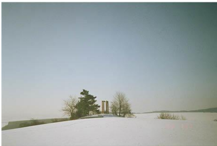
příloha č. 32 Šibeniční vrch, celkový pohled