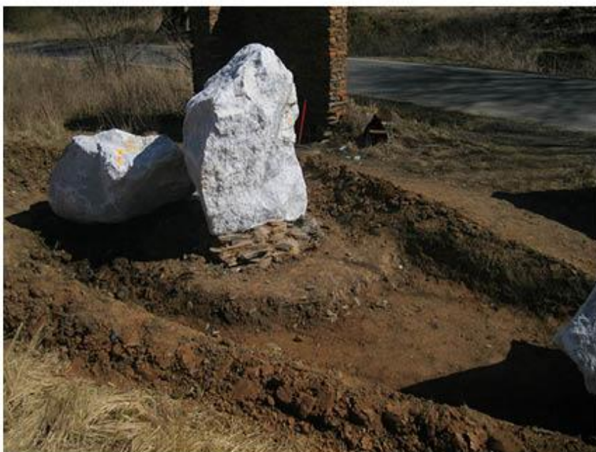
příloha č. 17 Proces práce