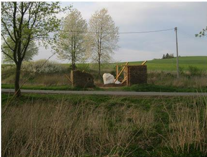
příloha č. 22 Stará stodola, celkový pohled