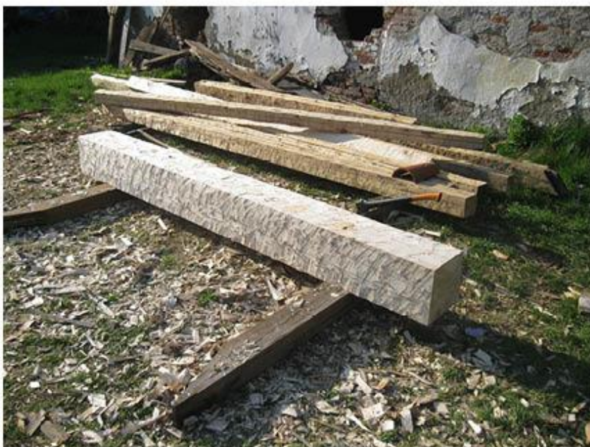
příloha č. 13 Osekané kmeny a trámy