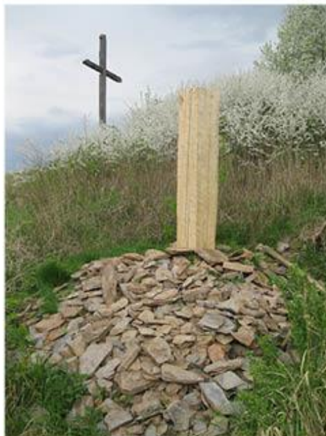
příloha č. 28 Stará stodola, detail, foto:vlastní