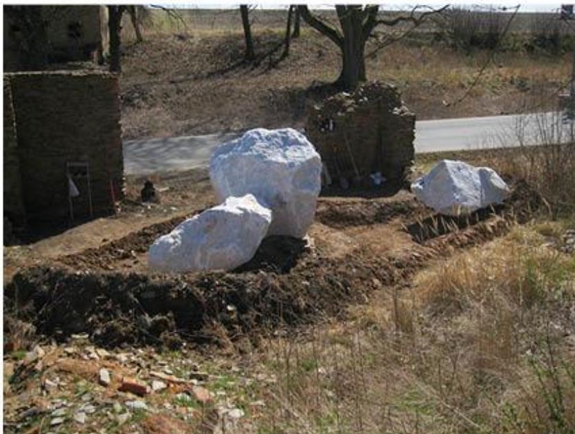
příloha č. 16 Stará stodola, proces práce, foto:vlastní