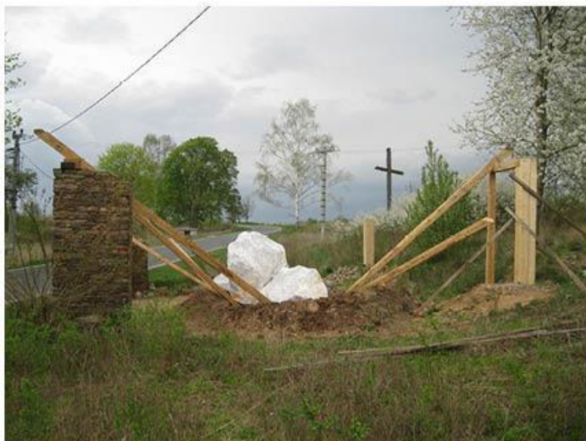
příloha č. 21 Stará stodola, celkový pohled, foto:vlastní