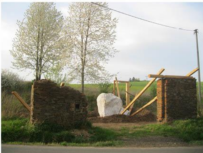
příloha č. 23 Stará stodola, celkový pohled