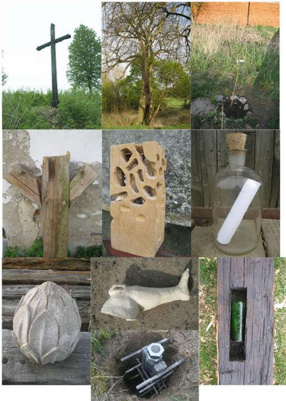
příloha č. 34 Prology, serie hmotných prologů, foto: vlastní