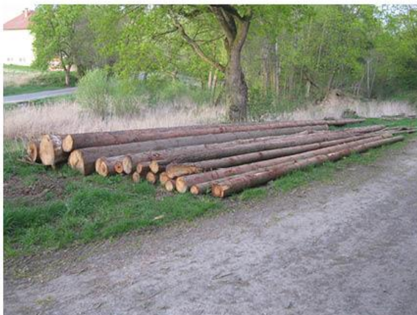
příloha č. 11 Kmeny před osekáním