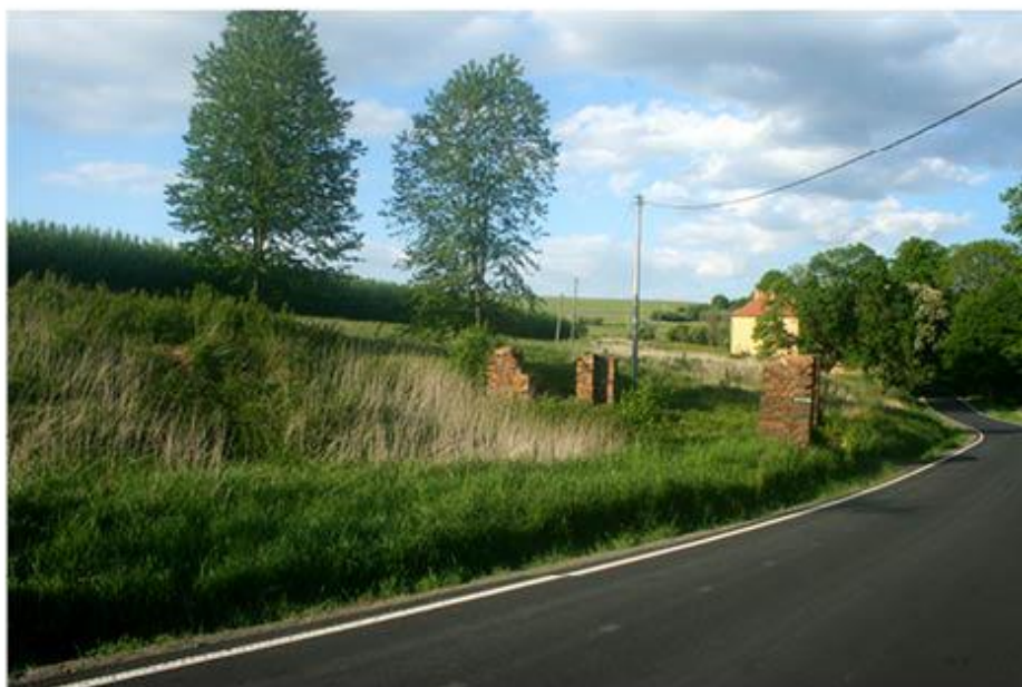
příloha č. 8 Bývalá stodola