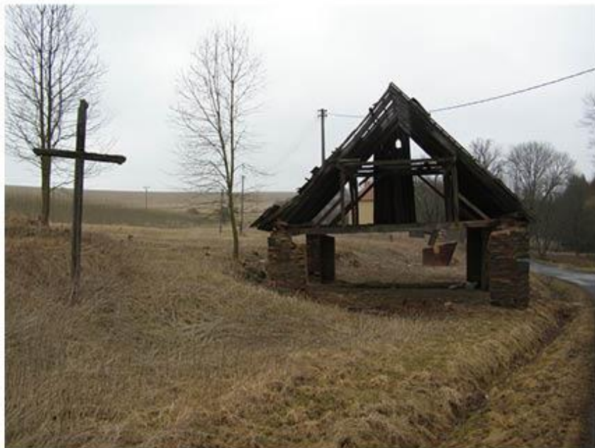
příloha č. 6 Bývalá stodola