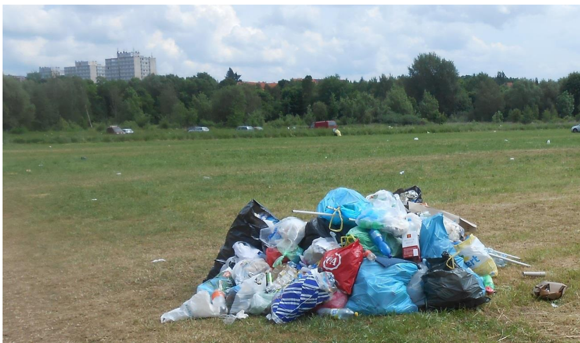
Foto 8: Odpadky na jedné z luk určených ke kempování den po skončení Metalfestu