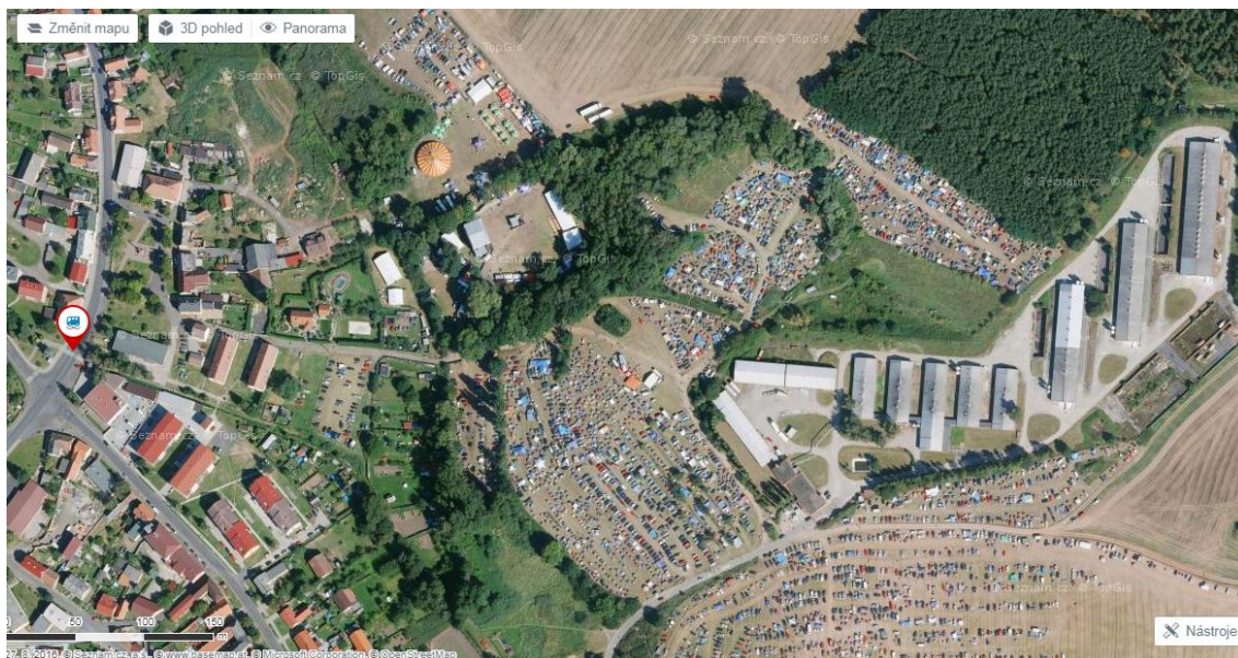
Foto 4: Satelitní mapa zachycující festival Rock for Churchill u města Vroutek