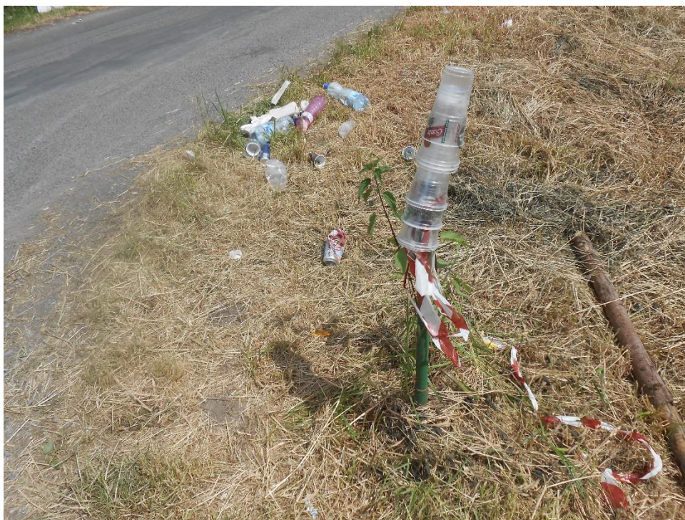
Foto 6: Odpadky v okolí amfiteátru Lochotín během Metalfestu 2017