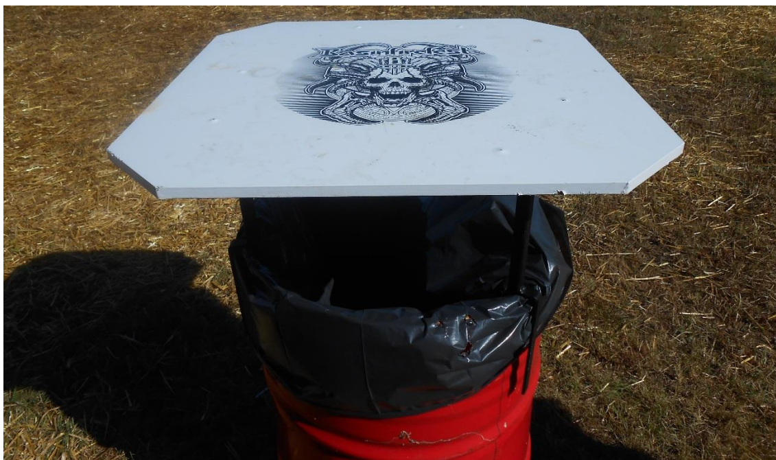
Foto 5: Multifunkční odpadkový koš na Basinfirefestu. V pozadí lze vidět slámu určenou ke zpevnění bahnitého povrchu po dešti.