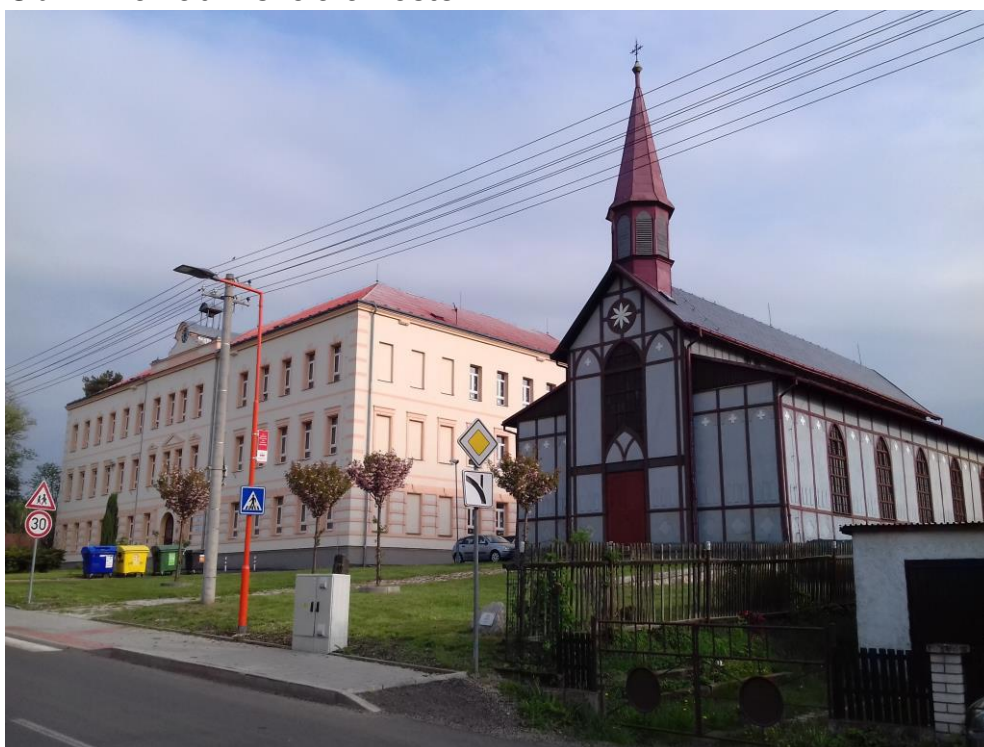
Obr. 1 Základní škola a kostel