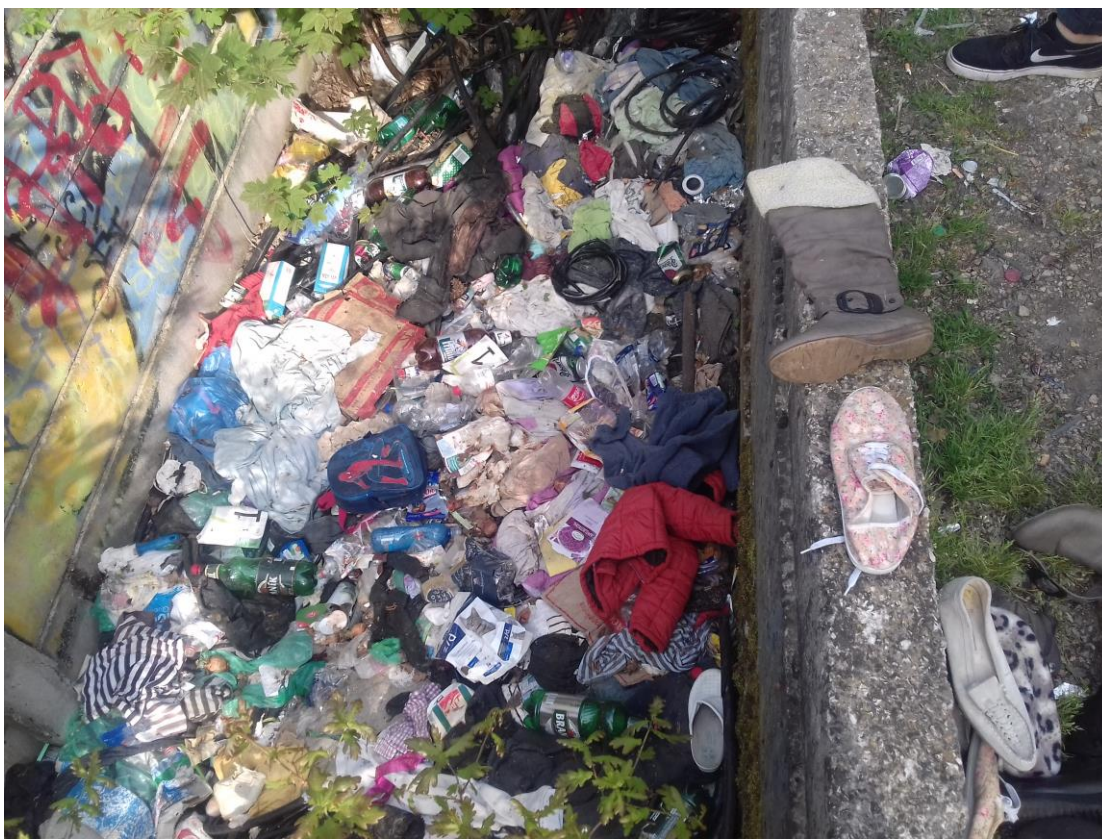
Obr. 12 Městský park (vzadu podchod propojující starou a novou zástavbu)