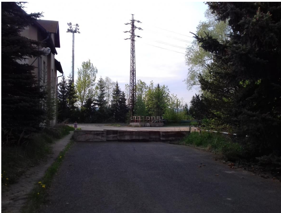
Obr. 22 Lom Družba vyfotografovaný od první cedule „Zákaz vstupu“