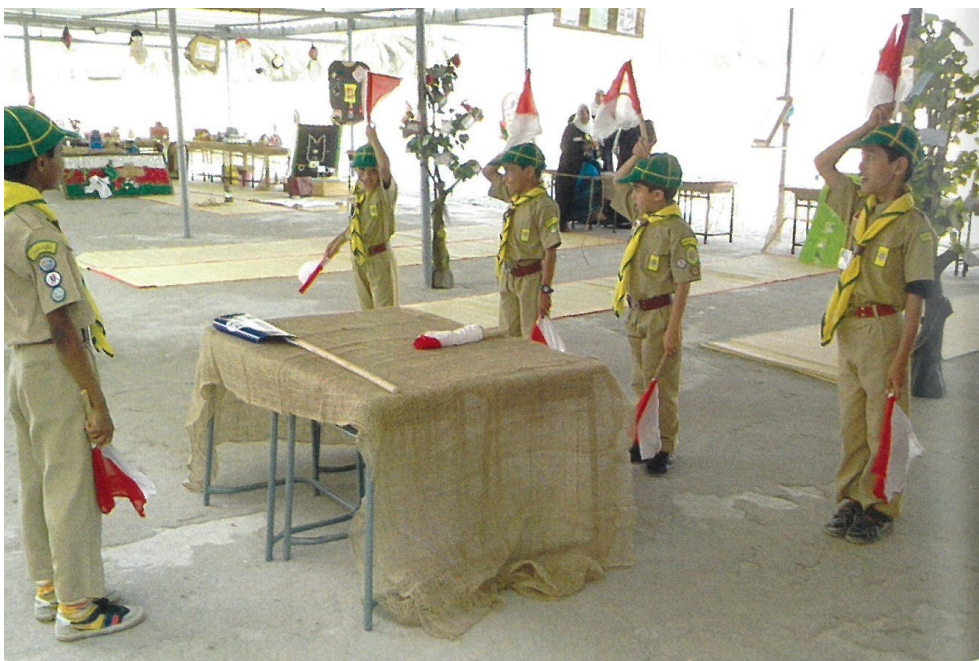
Obr. č. 14. Schůzka ománských vličit