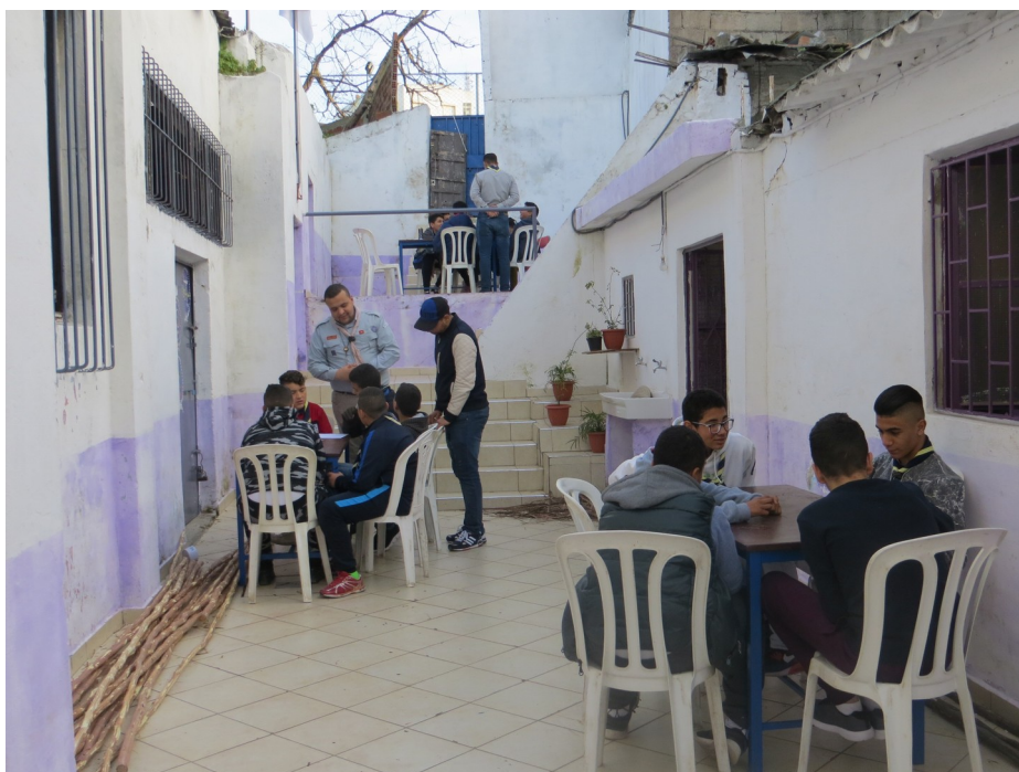
Tanger, 25. 1. 2017.