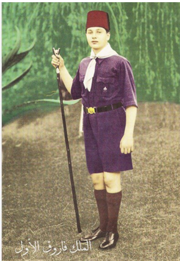
Obr. č. 3. Král Fárúq I., náčelník egyptských skautů