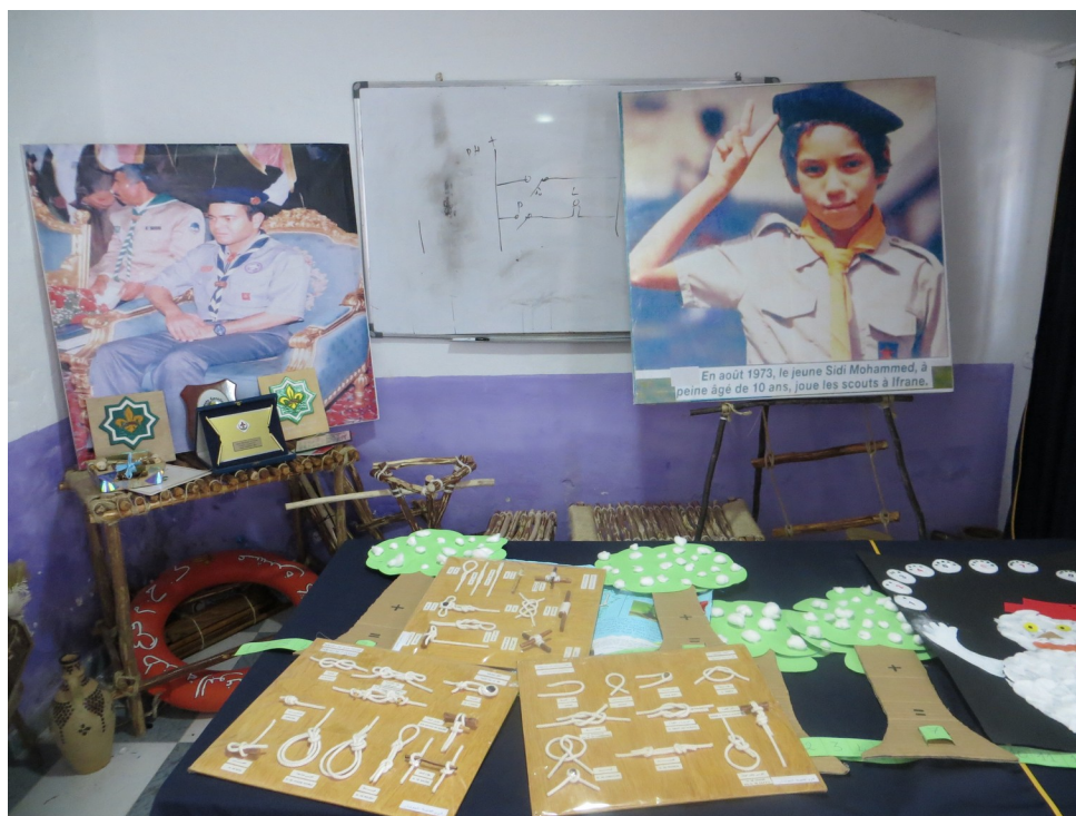
Tanger, 24. 1. 2017.