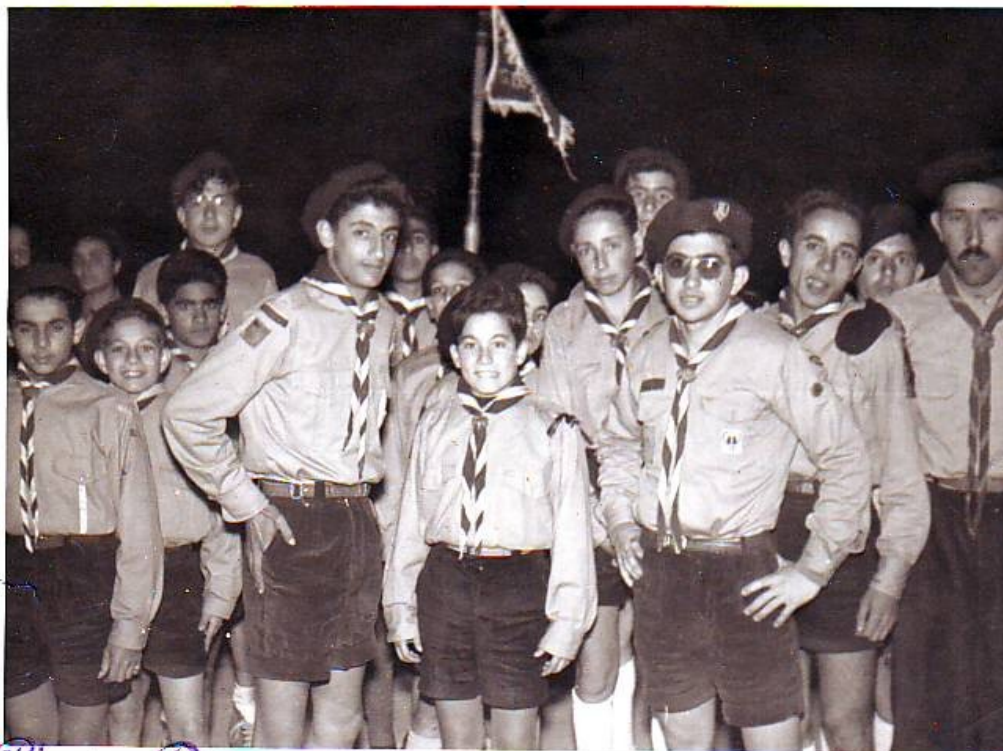
Obr. č. 7. Židovští skauti z oddílu Maimonide, Mazagan 1958