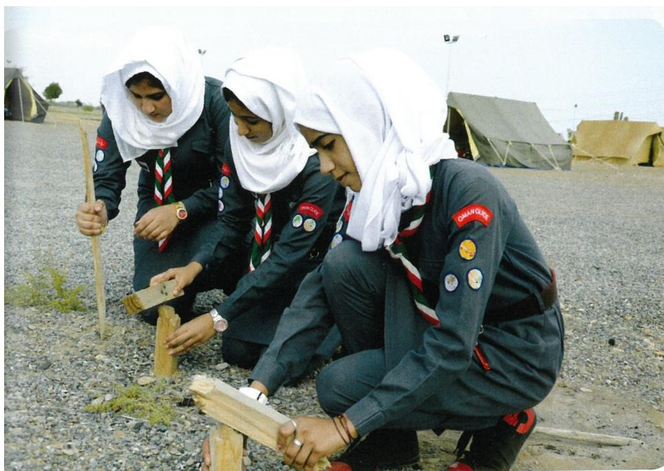
Obr. č. 13. Ománské skautky na táboře