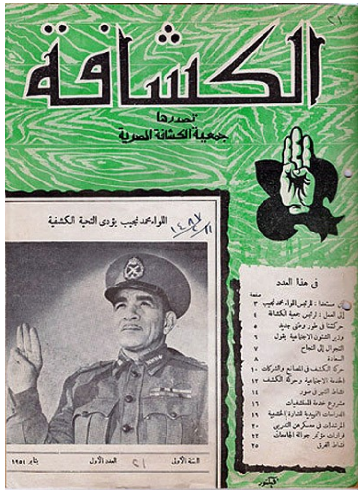
Obr. č. 4. Prezident Mohamed Nagib na obálce časopisu al-Kaššafa [Skauti] z roku 1954.