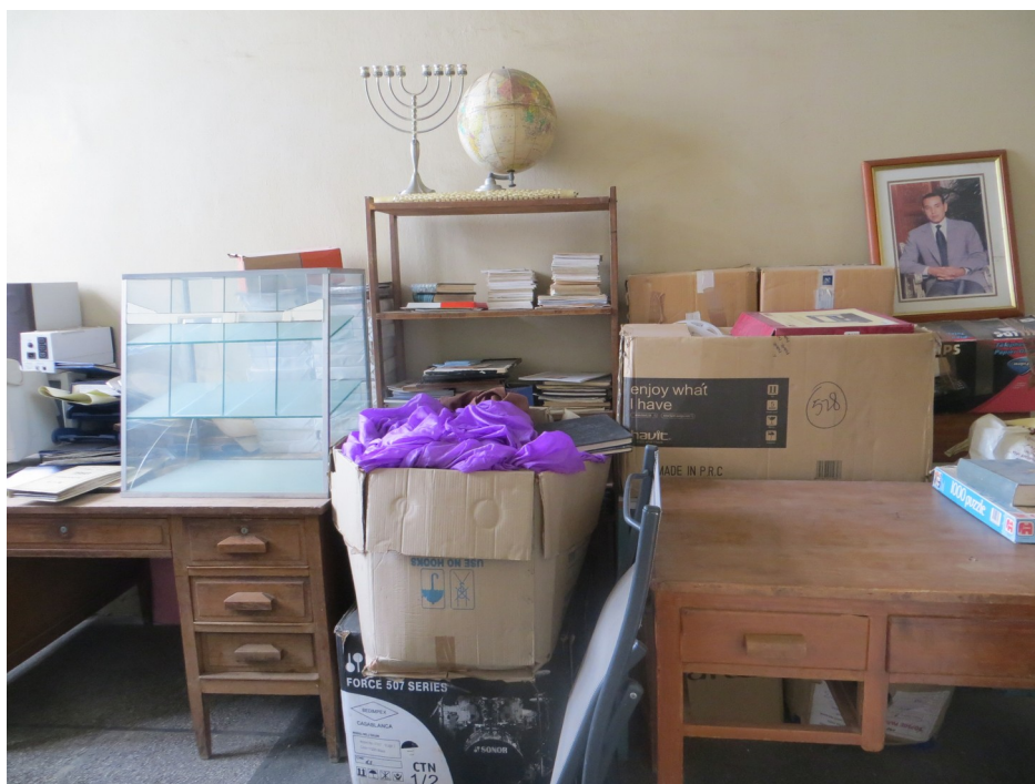
Casablanca, 27. 1. 2017.