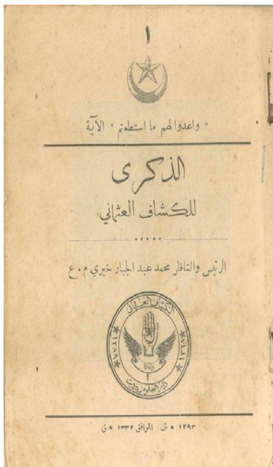
Obr. č. 1. Obálka knihy Vzpomínka na Osmanský skaut

Zdroj: CHAJRÍ, Mohammed ʿAbd al-Džabár. Al-Dhikrá al-Kaššáf al-ʿOthmání . 1913.