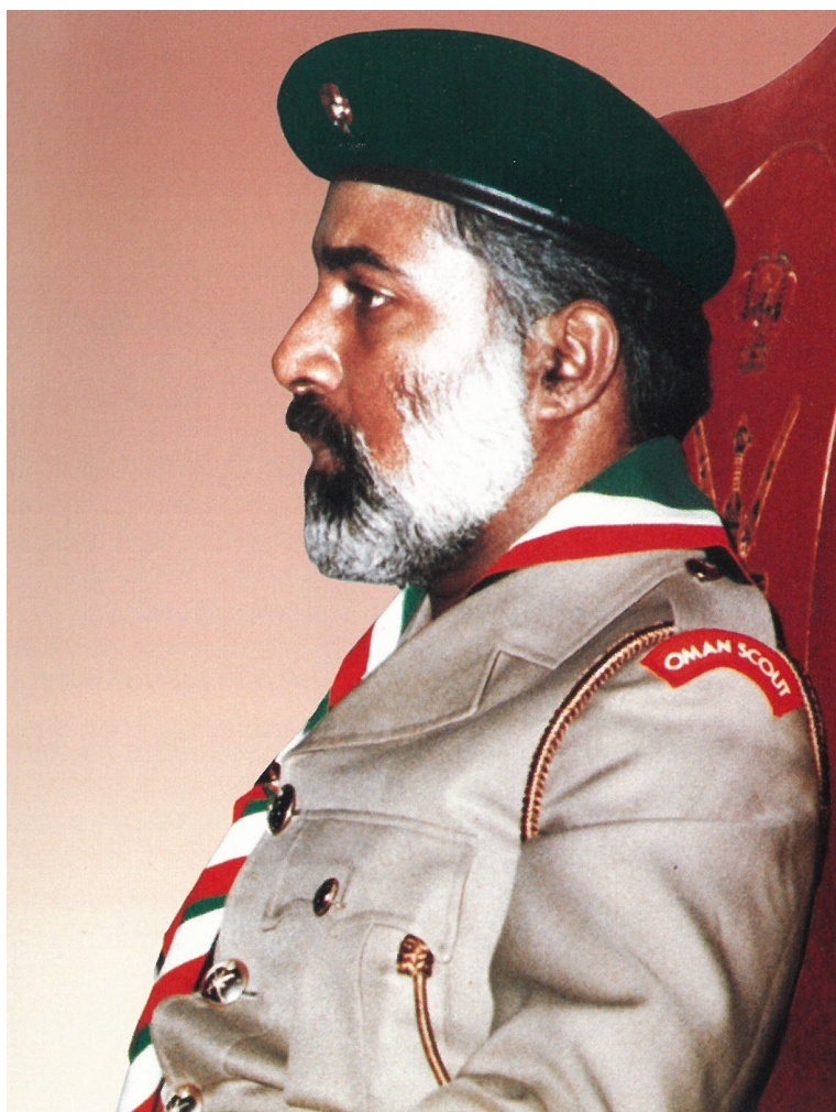
Obr. č. 12. Sultán Qábús bin Sa'íd, čestný náčelník ománských skautů