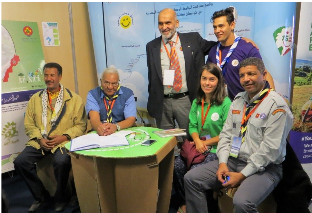
Marrákeš, 17. 11. 2016.