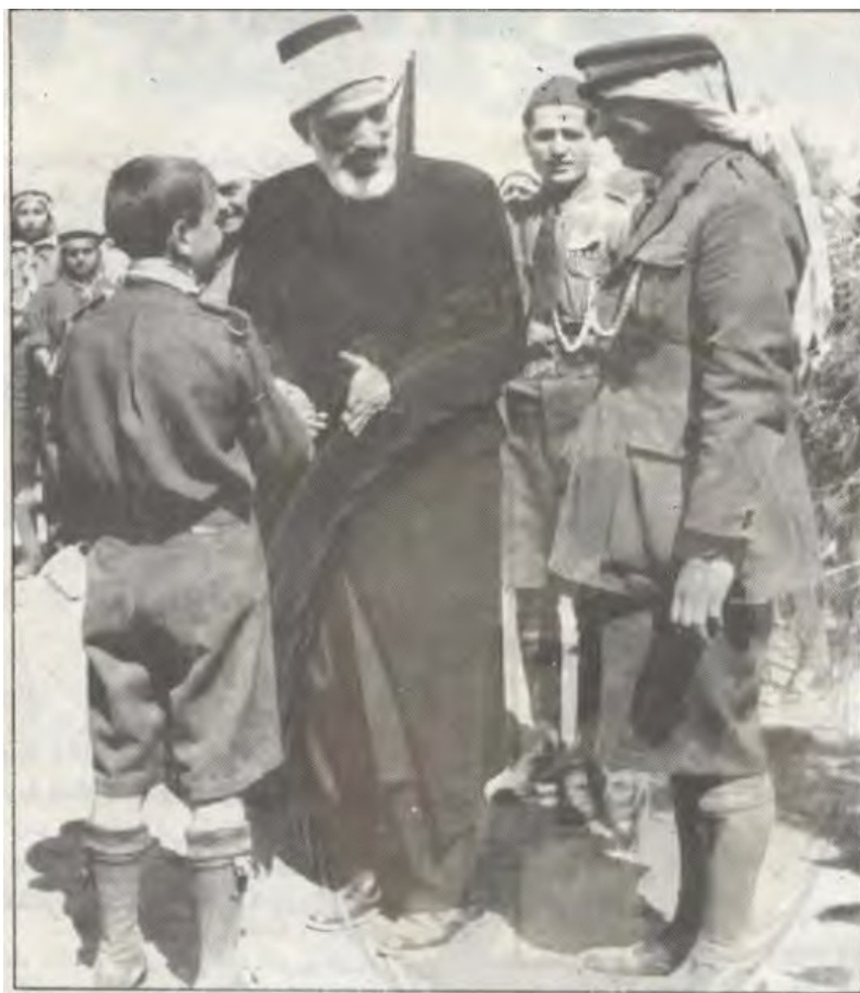
Obr. č. 2. Spoluzakladatel Osmanského skautu Šejch Muhammad Taufiq al-Hibrí se zdraví se skauty