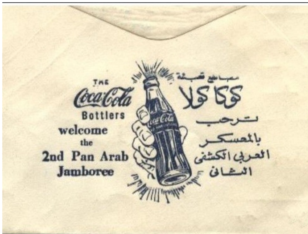
Obr. č. 5. Obálky Coca-Coly, sponzora 2. pan-arabského Jamboree v Egyptě roku 1956