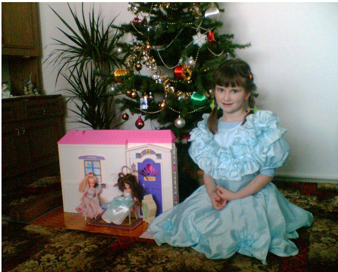
Fotografie jedné z informátorek o Štědrý den.