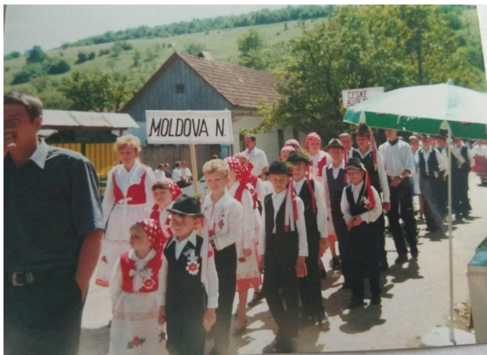
Opět fotografie z průvodu.