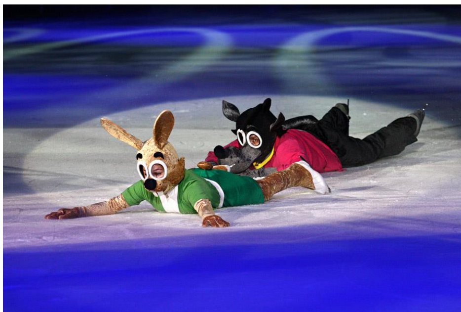
Obrázek č.6 – fotografie z ledového revue Jen počkej, zajíci! 44

Nejlegendárnějším zpracováním tématu seriálu bylo vytvoření digitální hry Hy, nozodu! . Jednalo se o obdélníkovou herní konzoli. Ve hře jste zastupovali roli vlka, který chytá vejce, které snáší vejce z různých stran a žádné vejce vám nesmí upadnout. 43