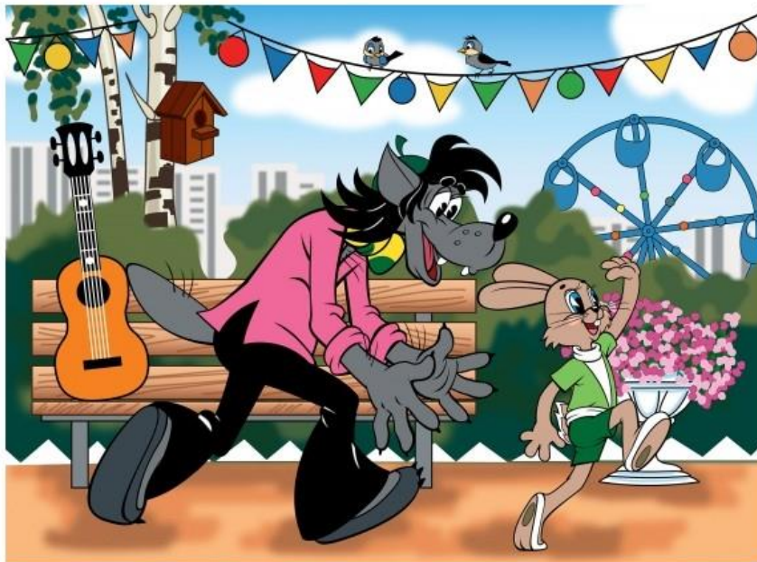
Obrázek č.3 – hlavní postavy seriálu Jen počkej, zajíci! 32