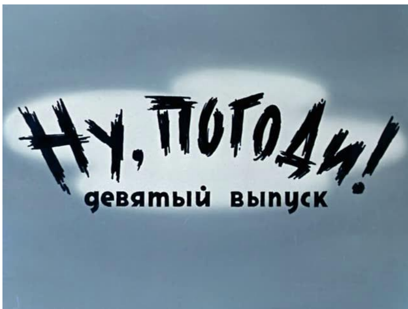
Obrázek č.1 – logo seriálu zobrazené v devátém díle 23

Mnoho režisérů odmítlo pracovat na tomto animovaném filmu. Avšak sám Vjačeslav Kotěnočkin řekl: „ Na tomhle něco je! “, a začal pracovat na projektu. 22