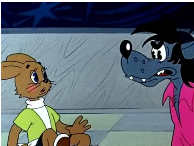
Obrázek č.7 – hlavní postavy seriálu Jen počkej, zajíci! 45

Velkým rozdílem u těchto dvou seriálů je to, že v několika případech u Toma a Jerryho spolu oba aktéři vystupují jako kamarádi. A místo toho, aby bojovali proti sobě, bojují proti společnému nepříteli, kterým jim zabraňuje například v klidném odpočinku na pláži. Dalším rozdílem mezi těmito dvěma dvojicemi je pojmenování. Na rozdíl od vlka a zajíce, kocour s myšákem mají jména, Tom a Jerry.