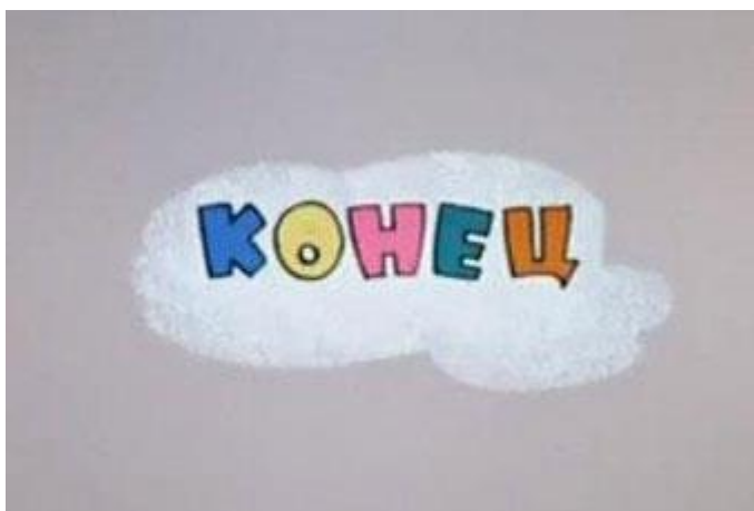
Obrázek č.2 – zobrazení snímku Конец na konci dílu 24

Každý díl tohoto seriálu je natočen v délce přibližně deseti minut. Začíná zobrazením loga Sojuzmultfilm , po kterém následuje buďto krátká scénka, končící fází „ Jen počkej, zajíci “ či se rovnou zobrazí název a číslo dílu. Zajímavostí je, že původní díly seriálu byly jen číslované, tudíž v jednotlivých distribucích v zahraničí se mohou názvy lišit. Titulky vždy probíhají bez nadbytečné animace, jedná se pouze o text. Po titulcích přichází již samotný děj seriálu. Každá epizoda po skončení příběhu vždy končí jednou jedinou replikou, kterou není žádná jiná věta, než „ Jen počkej, zajíci! “. V konci dílu již nenalezneme titulky, ale pouhý snímek s nápisem Конец .