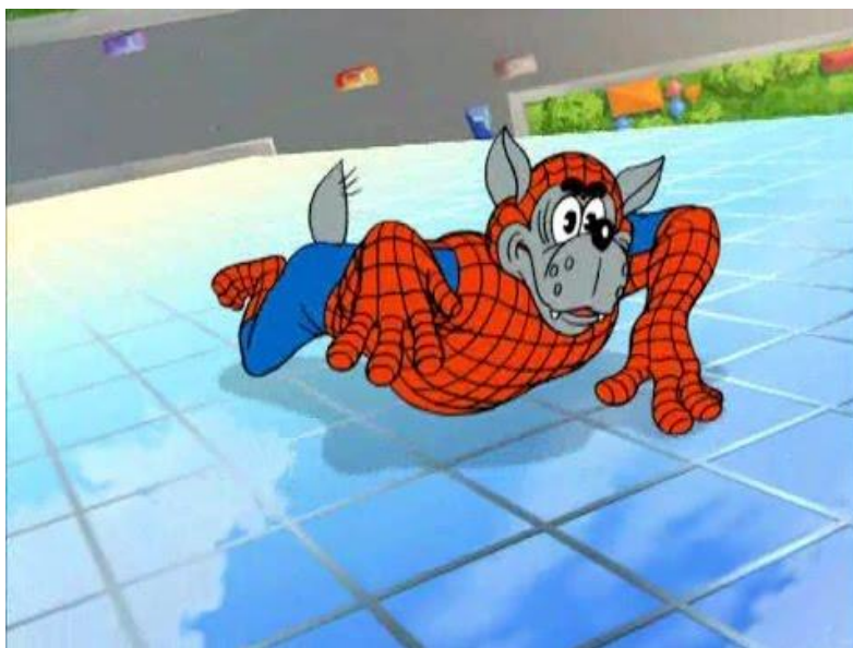
Obrázek č.5 – představa vlka, že je známou postavou Spidermana 38

Nejsou zde však jen rozdílné momenty. V nových dílech je jasný odkaz k těm původním. V díle Na chatě , konkrétně v jeho první části, se opakuje scéna z první části prvního dílu Na pláži . Jedná se o scénu s balkonem. Vlk prochází na ulici kolem domu, uslyší hudbu, podívá se vzhůru a na jednom z balkonů spatří zajíce, který zalívá květiny. A jelikož touží zajíce chytit, snaží se k němu všelijakými způsoby dostat. Scéna z konce tohoto dílu, kdy má vlk na hlavě košík je zase půjčená z dílu číslo patnáct Zajetí chór .