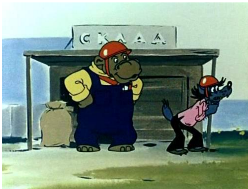
Obrázek č.4 – postava hrocha v díle s názvem Na stavbě 34

V seriálu vystupují i další zvířata. Například kocour v roli kouzelníka, bobři, kteří jsou plavčíky z povolání či mrož, který je kapitánem lodi. Tato ostatní zvířata se však v průběhu jednotlivých epizod neustále mění a nevykazují žádné zásadní charakterové vlastnosti.