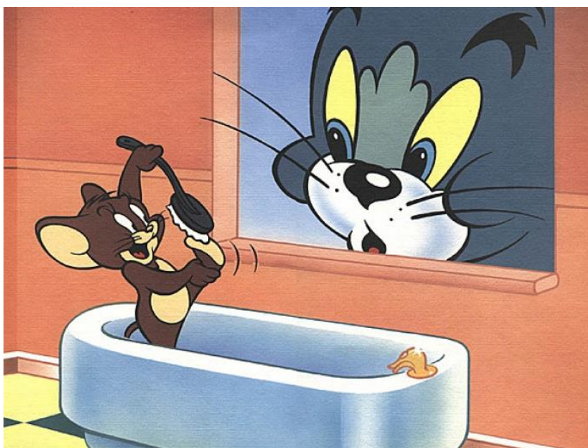
Obrázek č. 8 – hlavní postav seriálu Tom a Jerry 46