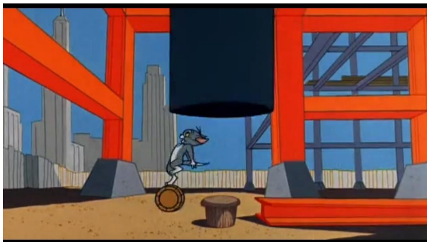
Obrázek č.10 – snímek ze seriálu Tom a Jerry , konkrétně z dílu Na stavbě (scéna s hydraulickým strojem) 48

plácačkou, kterou Jerryho i několikrát trefí. Ne však definitivně, myšák se náhle zastaví, vezme kocourovi plácačku a sám ho s ní udeří, poté utíká. Kocour v zápalu dohonění Jerryho padá ze střechy. Zachrání ho potrubní roura, kterou putuje dál po staveništi. Mine, stejně jako Jerry, hydraulický přístroj, který ho naštěstí neudeří. Jeho trasa ale i přes to nekončí šťastně. Doputuje totiž do budovy, kde právě probíhá výstava psů, kteří se na něj vrhnou. Myšák se mezitím dostane zpátky na kocourovo zahradu, lehne si na jeho lehátko a začne si užívat stejně jako Tom na začátku dílu.