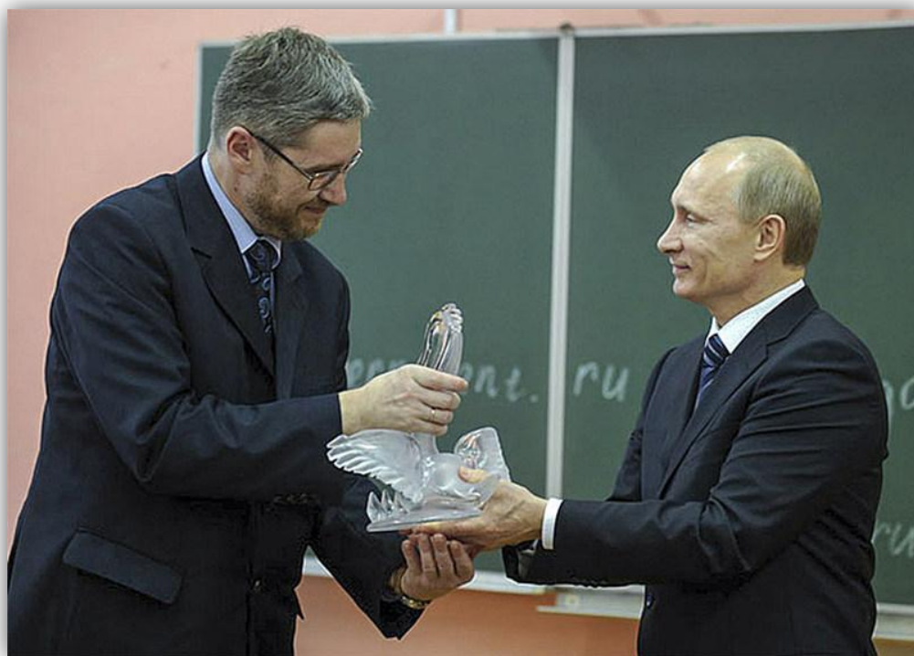
Приложение 18. Президент России В.В. Путин в вальдорфской школе в Москве. 2008 год.