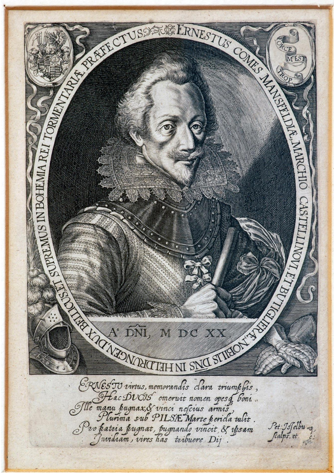
Příloha 4: Rytina Petera Isselburga „Arnošt hrabě Mansfeld“

Zdroj: Sbírka grafických listů Jiřího Sternberga, hrad Český Šternberk, katalogové č. 473–206.