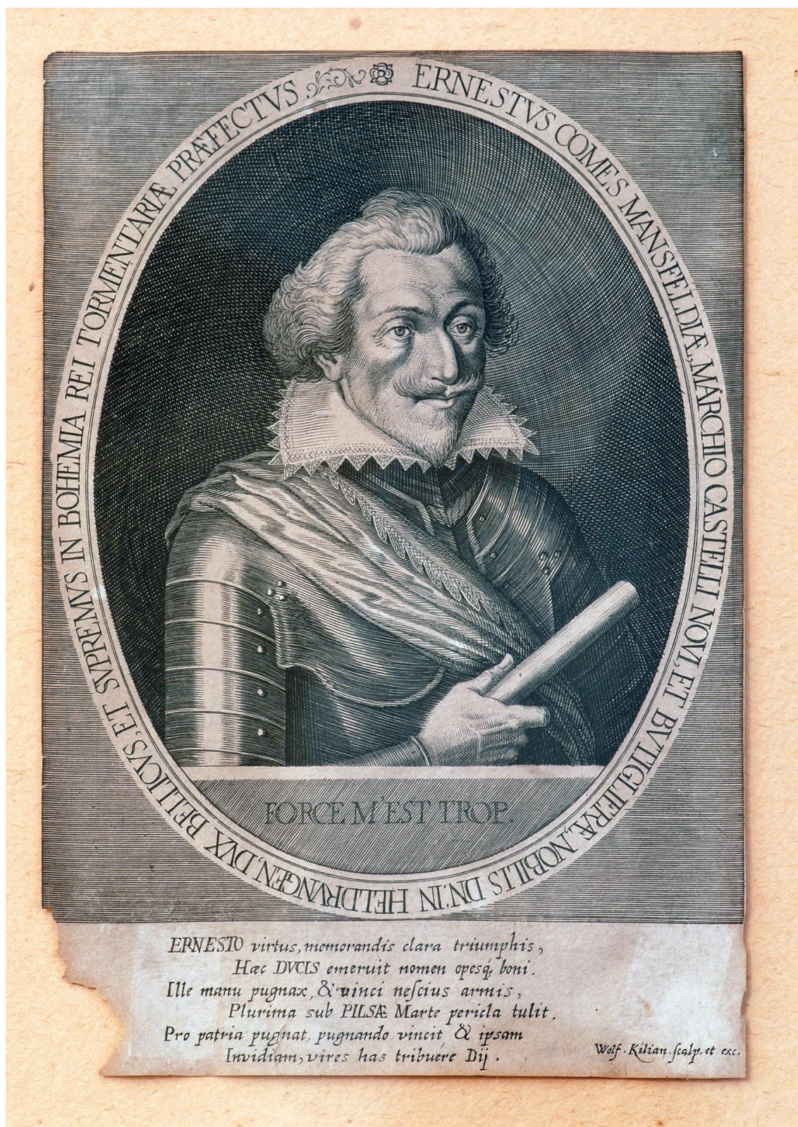
Příloha 5: Rytina neznámého autora „Generál Arnošt hrabě Mansfeld“