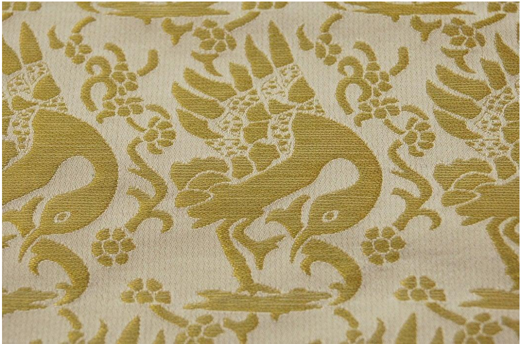
Obrázek č. 12.

Vzor na pohřebním rouchu Rudolfa I. Habsburského.