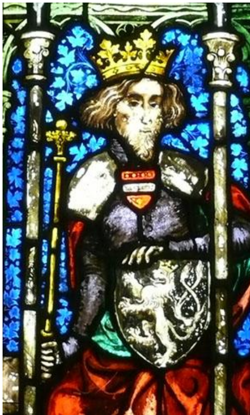
Obrázek č. 6.

Vyobrazení Rudolfa I. Habsburského na vitráži.