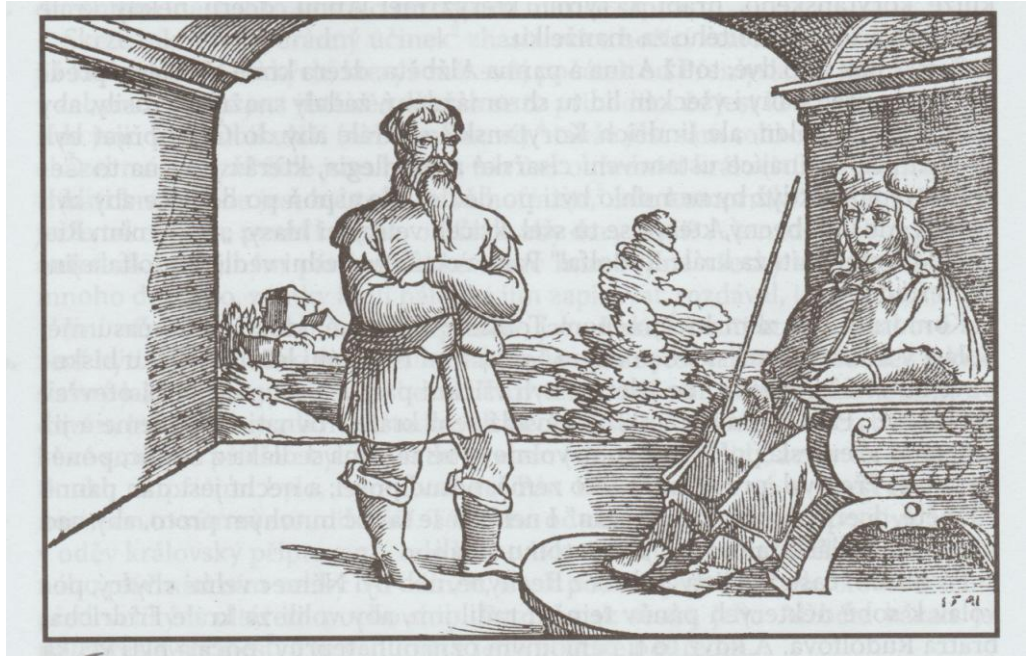
Obrázek č. 8.

Vyobrazení Rudolfa I. Habsburského - Václav Hájek z Libočan, Kronika česká.