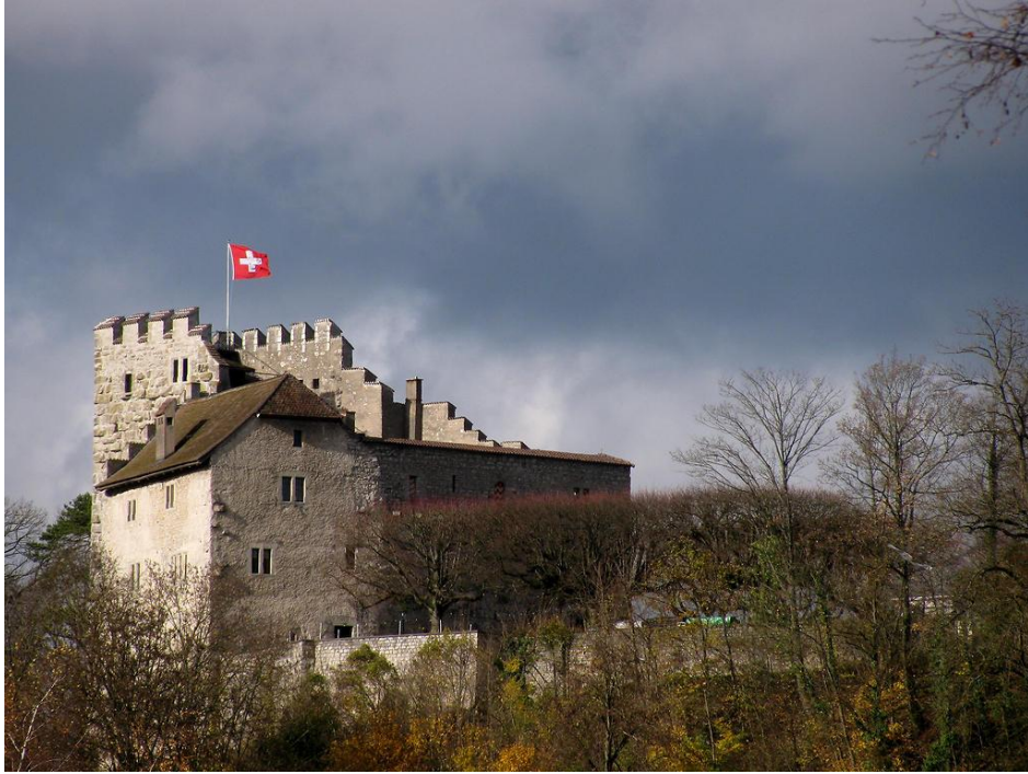
Obrázek č. 2.

Radbot hrabě Habsburský, v pravém horním rohu původní erb Habsburků.