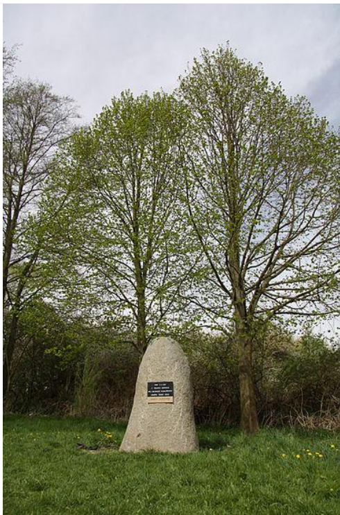
Obrázek č. 10.

Pamětní Kámen poblíž poutní kaple Svatého Jáchyma a svaté Anny.