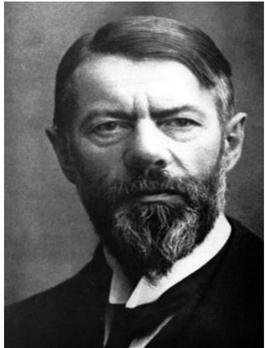
Pozn.: Max Weber v roce 1909

Zdroj: http://blogs.reuters.com/archive/tag/catholic-protestant-calvinist-max-weber-european-central-bank-economy-income-inequality/ , 5.12.2011, http://www.economist.com/node/12762398 , 5.12.2011.