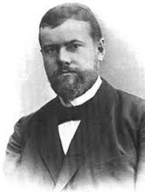
Pozn.: Max Weber v roce 1894