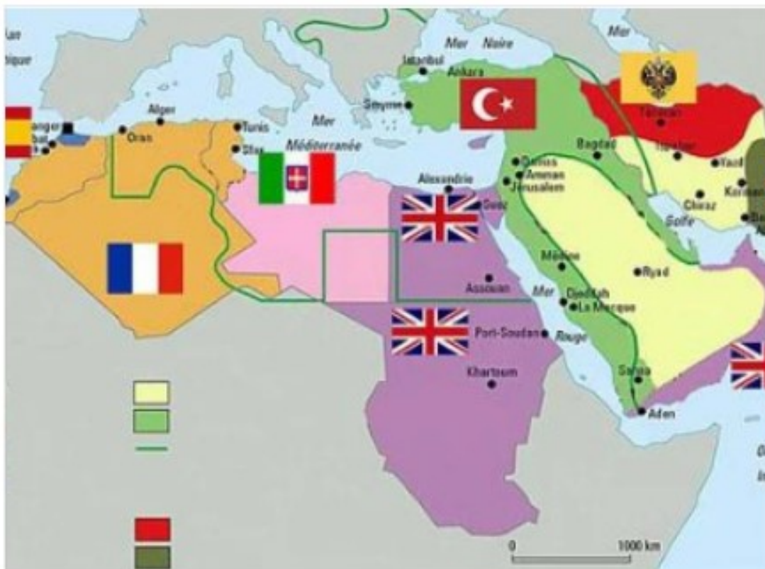
Obrázek č. 1 – Kolonie v Africe

Egypt – do roku 1922 britská kolonie, do roku 1952 Egyptské království, od roku 1952 Egyptská republika. Ekonomika byla vždy závislá na zemědělství, v době britské nadvlády dochází k jeho rozšiřování, budují se zavlažovací kanály, vodovody, komunikace. Později se začíná rozvíjet lehký průmysl. Země má velké zásoby uhlí, ropy a plynu. 90% obyvatelstva vyznává islám. V říjnu roku 1955 uzavřena obchodní dohoda: bavlna pro Československo za výzbroj pro egyptskou armádu. Mimo jiné se Československo podílelo na stavbě první etapy Asuánské přehrady.