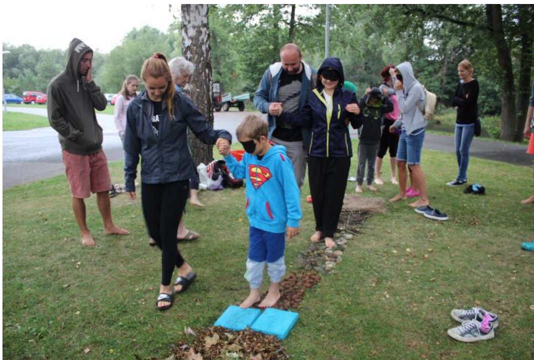
Obr.14 Bosý chodníček - letní tábor