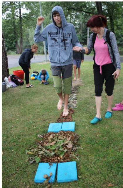
Obr. 5 – Bosý chodníček, letní tábor