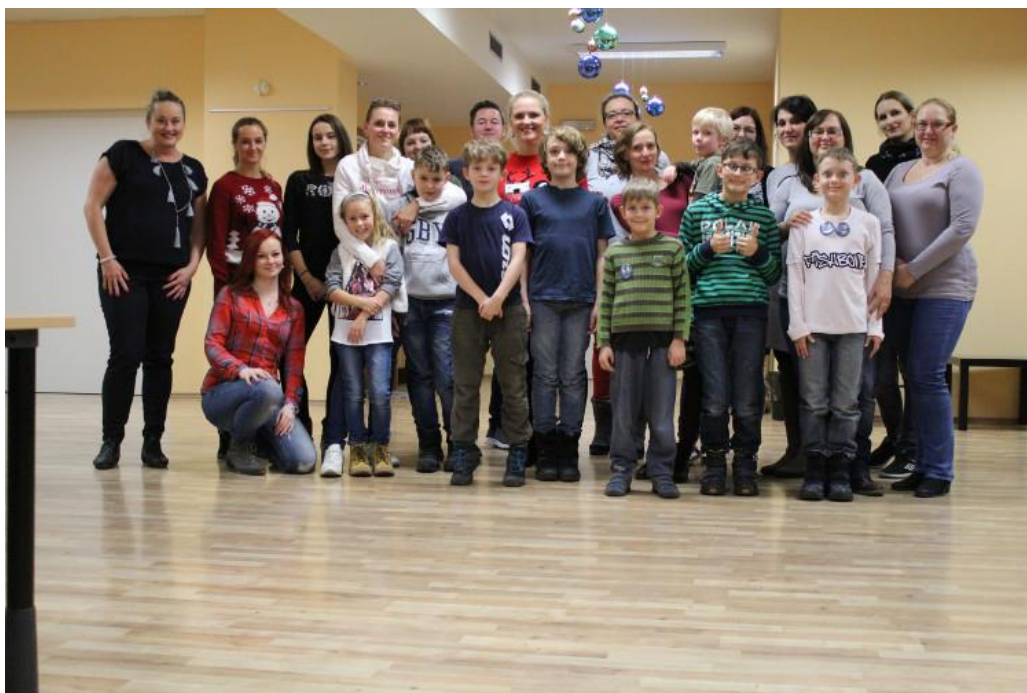
Obr. 19 – Vánoční pečení – dobrovolnické centrum Totem