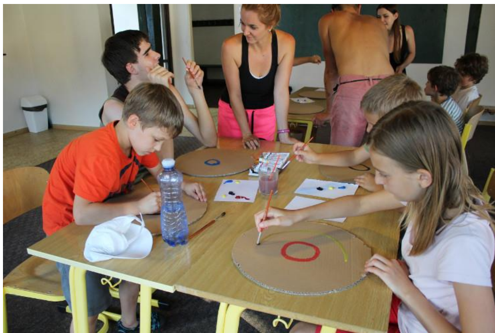
Obr. 17 – Výtvarná a tvořivá činnost – tvorba terčů