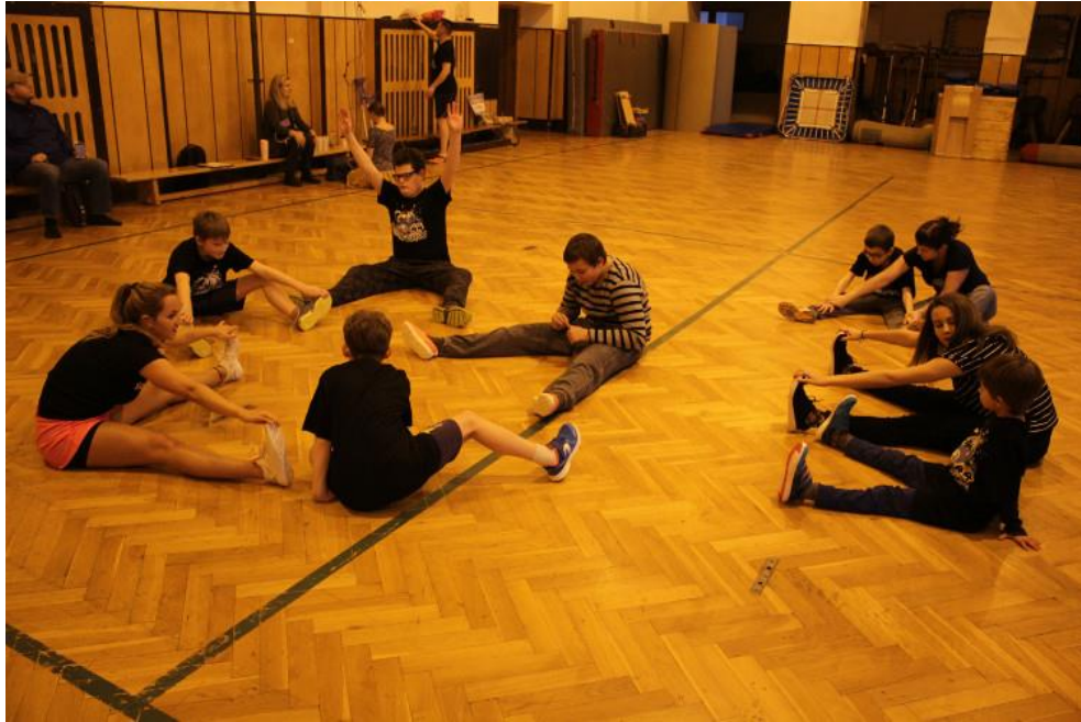
Obr. 23 – Cvičení s dětmi s PAS – protahovací část