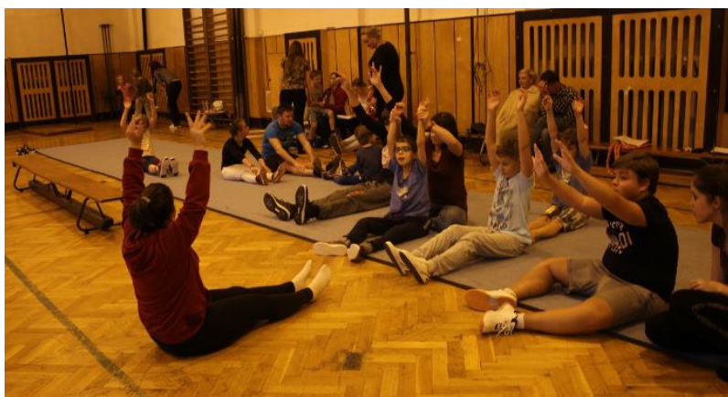
Obr. 7 – Cvičení pro děti s PAS na Fakultě pedagogické Západočeské univerzity

Ukázkovou hodinu pro děti s PAS, kterou jsme zorganizovali společně s asistenty, dokládám na DVD v přílohách.