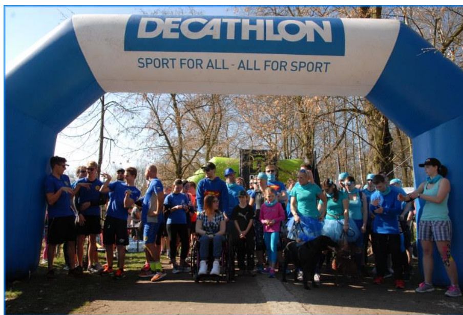
Obr. 3 – Třetí ročník charitativního běhu Run ProCit