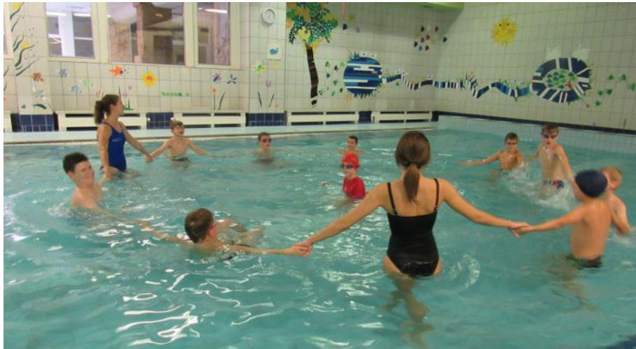
Obr. 12 – Plavání v bazénu na Slovanech