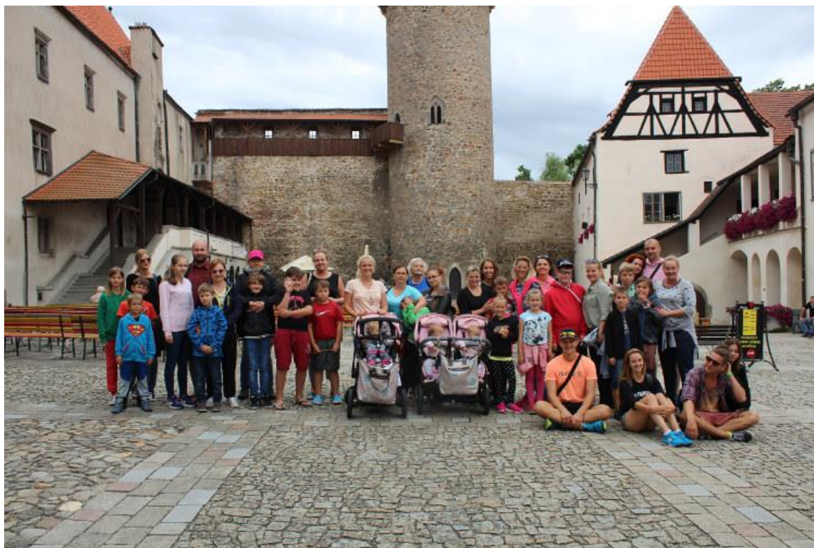
Obr. 15 – Výlet na hrad ve Strakonících