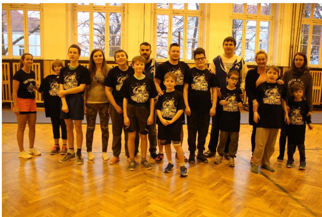
Obr. 22 – Cvičení s dětmi s PAS