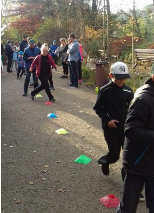
Obr. 2 – Slalom v areálu plzeňské ZOO

Většina dětí se u zvířátek ani nezastavila. Ti, kteří ano, obohatily mne novými poznatky o nich. Musím říci, že čím více se děti s PAS věnují sportování, tím lépe daný pohyb zvládají a během mé praxe s nimi, myslím, že se i fyzická zdatnost u dětí zlepšila, což při návštěvě Zoo jasně potvrdily.