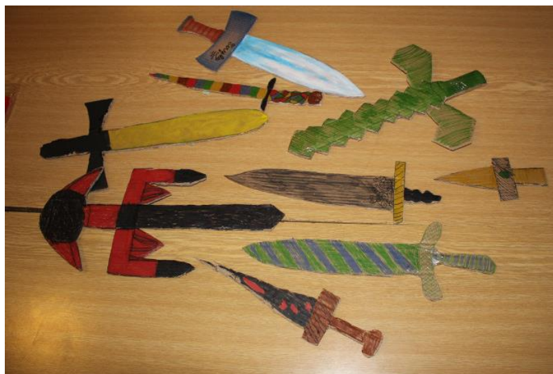
Obr. 6 – Tvorba mečů při tvořivé činnosti

Výtvarných a pracovních činností se účastnili děti i asistenti, kteří pomohli dětem s jejich představitivostí. Děti vytvářely během týdne vlastní erby, terče ale také meče. Při těchto činnostech jsem si v praxi vyzkoušela, jak jsou děti v této oblasti zcela závislé na pomoci druhých. Dětem s autismem pomáhali asistenti nebo přítomní sourozenci. Děti, především se střední formou autismu pracovaly samostatně a u aktivit vydržely po celou hodinu. Jiné děti však u činnosti nevydržely a daly nám najevo, že se tvoření nezúčastní. Většina dětí si pomáhala, bavilo je to a velkou motivací pro ně bylo, že si dané výtvary mohou ponechat. Výtvary se využily během aktivit, které souvisely s tématem tábora.