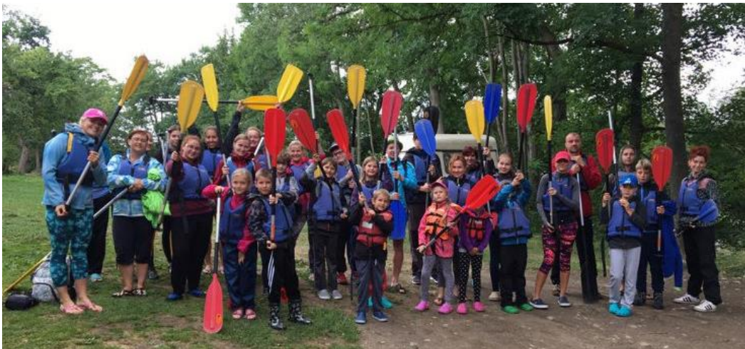
Obr. 4 – Rafting na letním táboře

pokladu. Děti u této hry rozvíjely hlavně svou paměť a soustředění a některé také rychlost. Tábor byl se zaměřením na sportovní a pohybové aktivity a děti se mohly hýbat celý den. Pokud bylo přijatelné počasí, snažili jsme se být s dětmi na hřišti, kde jsme pro ně vytvářeli program. Našli se i jedinci, kteří seděli a vše pozorovali z dálky. Hlavní náplní odpoledne měla být praktická ukázka nordic walkingu, ale na tuto aktivitu se už většina dětí necítila, byly unavené z dopoledního programu. Děti jsme vzaly na skákací trampolínu, kde se většina zabavila a aktivně trávily čas bez rodičů. Někteří se aktivity ani nezúčastnili z důvodu únavy a zůstali s rodiči. K večeru se už však nemohli dočkat střelení z pistole NERF na vlastnoručně vyrobené terče. Dětem jsme terče zavěsili na stromy a úkolem bylo strefit se cíl. Dle jejich reakcí jsem usoudila, že je to velmi bavilo a u aktivity vydržely dlouho. Součástí tábora byla praktická ukázka raftingu, kde děti dostaly potřebné vybavení a prošly si nácvikem na místní řece. Na tuto aktivitu se děti těšily a účastnila se jí převážná většina účastníků tábora. Byla to pro ně nová zkušenost a děti si odnesly mnoho krásných zážitků.