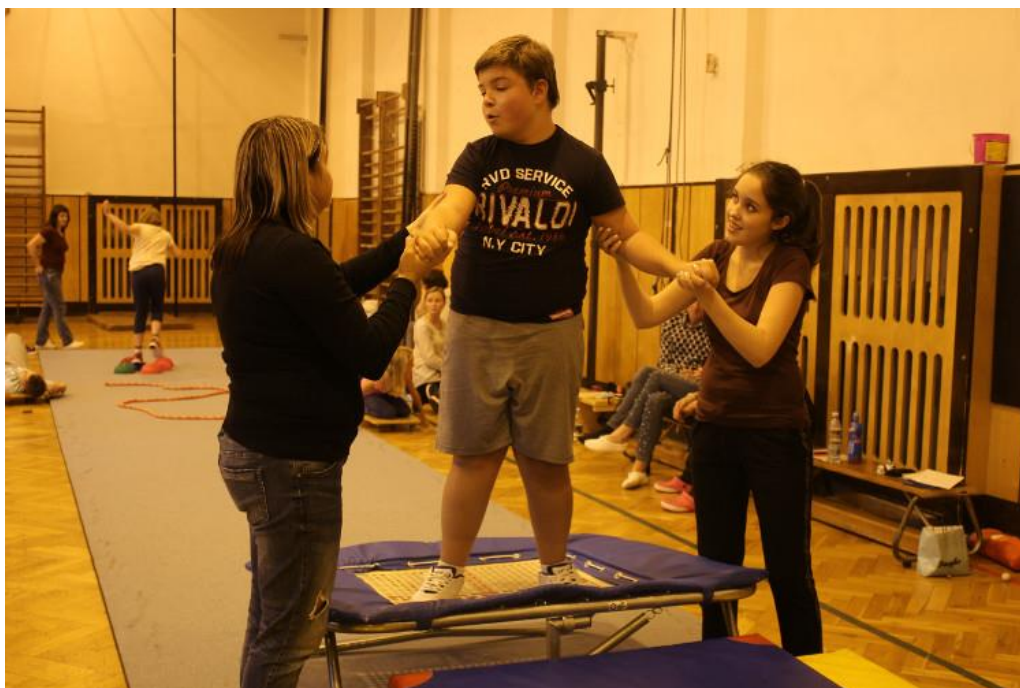
Obr. 21 – Cvičení s dětmi s PAS – gymnastická průprava