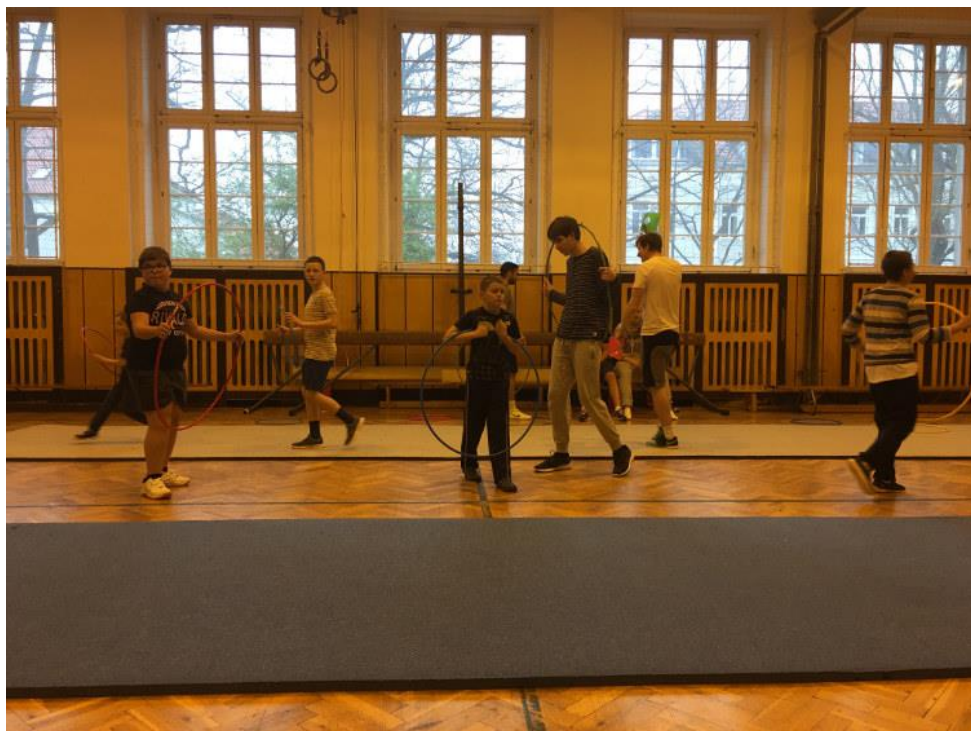
Obr. 24 – Cvičení s dětmi s PAS – rozcvičení s obručemi