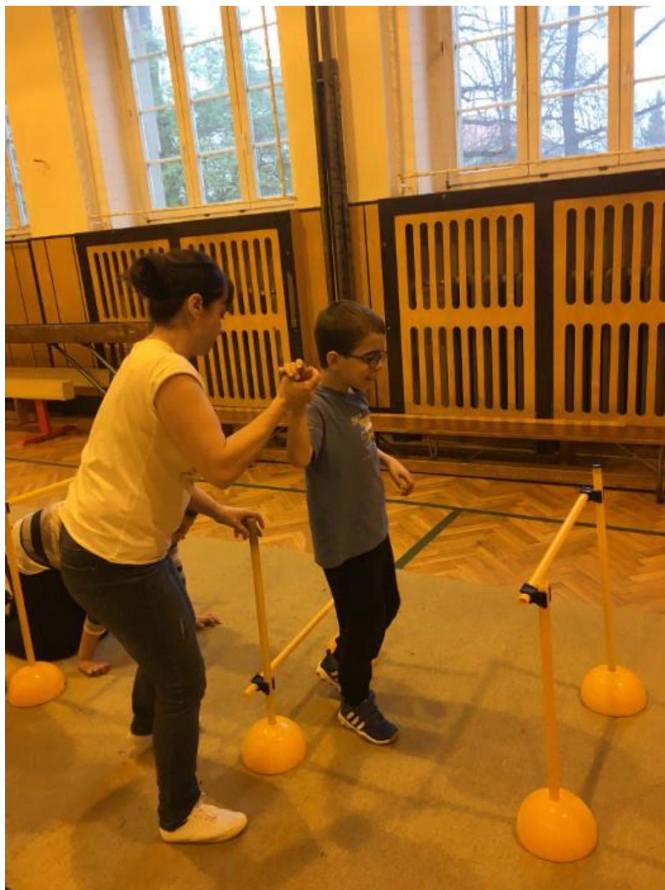
Obr. 20 – Cvičení pro děti s PAS na pedagogické fakultě