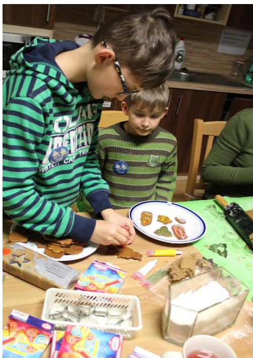
Obr. 8 – Vánoční pečení perníčků