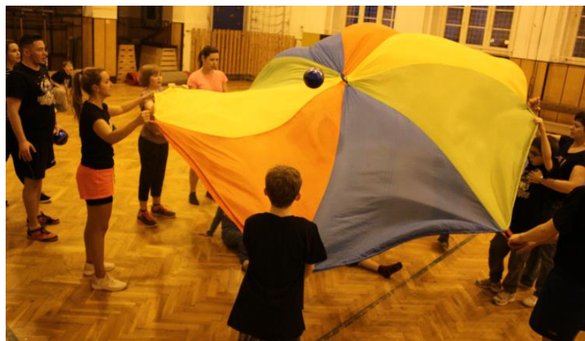
Obr. 13 – Psychomotorický padáček – druh terapie

Tento barevný kus látky s otvorem uvnitř zařazujeme v hodinách vždy na konec cvičební jednotky. Hra s barevnou plachtou rozvíjí u dětí s PAS komunikaci a schopnost spolupráce, dále děti vnímají barevnost, která rozvíjí zrakový analyzátor. Padáček napomáhá k psychomotorickému vývoji. Mezi vhodná cvičení řadíme manipulaci s plachtou – vlnění, točení, podlézání padáčku. Velkou spoluprací mezi jedinci vyžaduje přidání míček do plachty, kdy je cílem míčky nadzvedávat nebo jen udržet uvnitř. Vhodné je zvolit říkanky týkající se barevnosti, kterou si děti mohou zapamatovat. Děti si budou moci danou aktivitu spojit buď s písničkou, nebo říkankou.