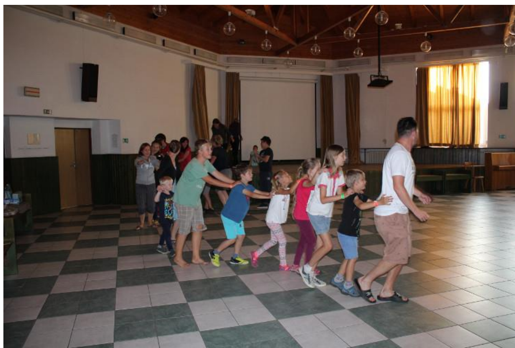
Obr. 18 – Diskotéka – letní tábor