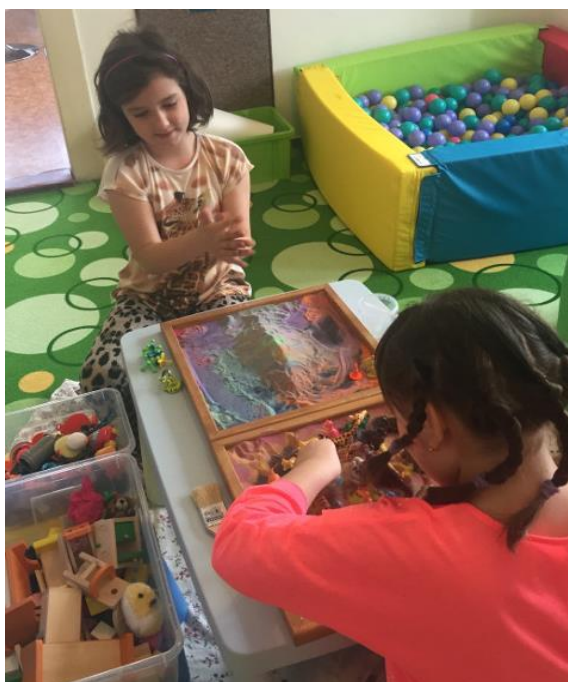
Obr. 9 – Pískování – nácvik sociálních dovedností

Pískování je terapeutická metoda, která otevírá cestu neverbálnímu kreativnímu procesu v každém z nás. K pískování se používá pískovnice (deska) a barevný nebo tekutý písek. Děti rozvíjí svou představivost k vytvoření obrázků, ale také jemnou motoriku. Terapie slouží k odbourávání psychických traumat, pomáhá tento svět otevřít a léčit příčiny, které způsobují psychické poruchy. Velmi oblíbená je nedirektivní terapie hrou, kdy se v písku rozestaví postavičky, které dítě instinktivně vybírá do svého modelu vnitřního světa. Dětem s PAS může terapie pomoci zvládat vztek, agresivitu, ale i odbourat strach či úzkost. V občanském sdružení ProCit z.s. se této terapii nevěnují tolik do hloubky, neboť je potřeba během terapie zkušeného pracovníka, psychoterapeuta. Pískování využívají jako formu relaxační nebo během jiných aktivit pro zpestření činností.