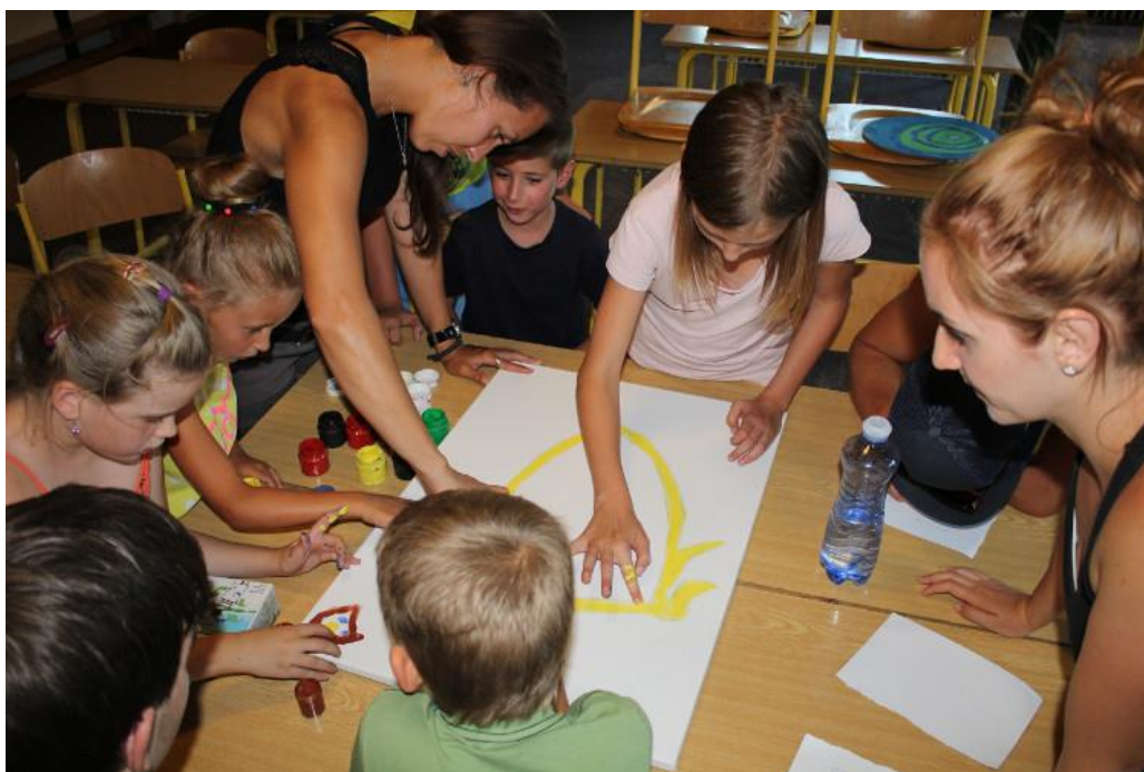
Obr. 16 – Výtvarná a tvořivá činnost – letní tábor