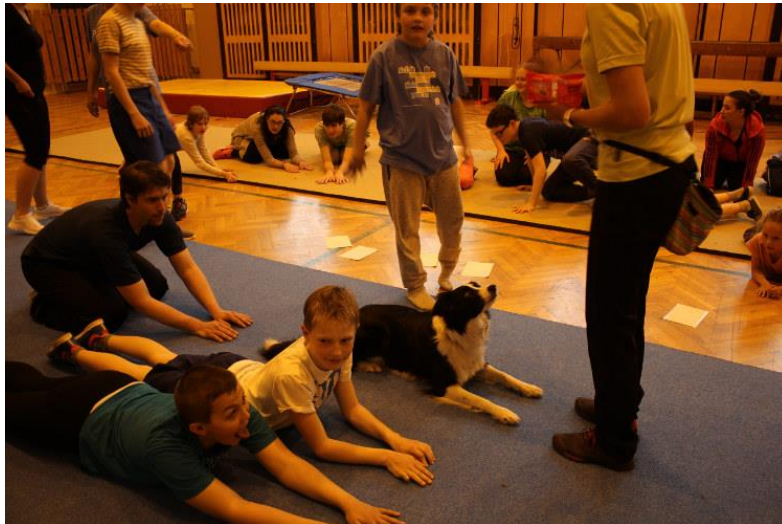
Obr. 10 – Canisterapie během cvičení s dětmi